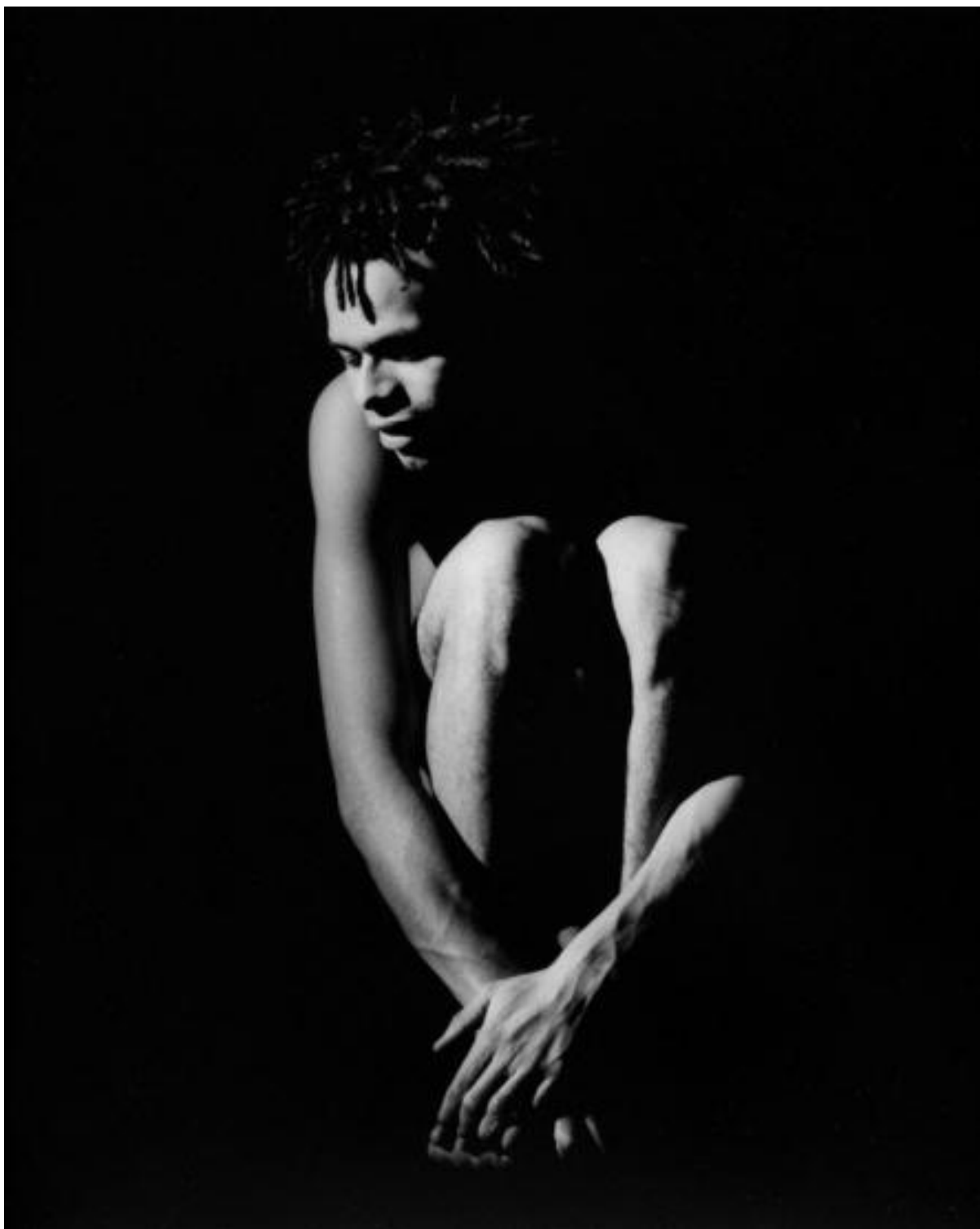
Compagnia Fanny&Alexander, "Heliogabalus"