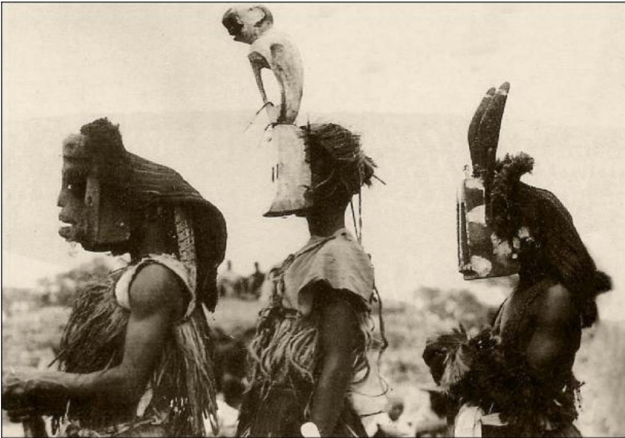
Pays Dogon, "Masques du dama", 1931, da L'Afrique fantôme

l'Expo del 1937 (dove dall'anno seguente Leiris trovò impiego come ricercatore restandovi sino al '71). Sul cornicione del Museo figura tuttora incisa, a lettere d'oro, una frase trionfale di Paul Valéry – «Ogni uomo crea senza saperlo, come respira. Ma l'artista è cosciente del suo creare. Questo atto ne impregna tutto l'essere. Egli è fortificato dalla sua amata sofferenza» – nella quale si condensa tutto ciò che Leiris non volle essere, e davvero non fu.