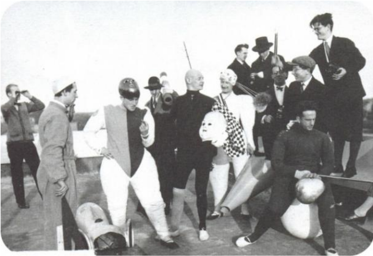
Dessau, theatre workshop, 1927

in altri termini ricercava degli standard oggettivi. Un proposito estetico che comportava, in pittura, la rinuncia allo sfumato, ai cromatismi e ai giochi tonali nonché un rigore formale garantito allora solo dall'astrazione.