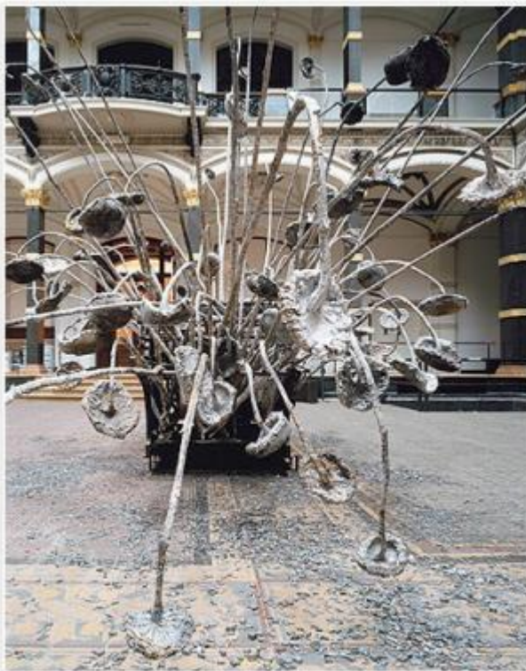
Anselm Kiefer, Die Buchstaben, 2012, © Anselm Kiefer, Foto Stefan Korte

L'arte del Novecento – a partire dai cubisti e dai futuristi che fisicamente inserivano titoli di giornale nelle proprie tele – ha vissuto questo choc culturale, questa contraddizione fondante. Ma c'è stato un momento in cui, secondo Fredric Jameson, linguaggio e temporalità sono entrati in una “rottura schizofrenica” che ha provocato “un investimento compensatorio nell'immagine e nell'istante”. Si sono così paradossalmente capovolti i tradizionali rapporti gerarchici fra Attimo ed Eternità. Questo momento è il postmoderno, ed è stato Andy Warhol, senz'altro, l'artista che con maggiore spietatezza ha saputo intuire, e poi codificare, precisamente questa condizione. Risponde a un caso la simultaneità di due grandi mostre dedicate allo stesso tema, ma non è dunque un caso che questo suo ruolo di pioniere venga indicato sia dalla grande personale in corso alla Galleria Nazionale d'Arte Moderna di Roma, Warhol Headlines (che per la prima volta tematizza direttamente la sua ispirazione “giornalistica”) sia dall'ancor più titanica collettiva da poco conclusasi alla Martin Gropius Bau di Berlino: Art and Press. Kunst. Wahrheit. Wirklichkeit . Mettendo fra parentesi (in una sala documentaria, come in appendice) i primordi protonovecenteschi, è proprio dalle prime serigrafie warholiane del 1962-63, con le foto dei Car crashes apparse sulle pagine dei quotidiani, che Art and Press inizia infatti il proprio percorso.