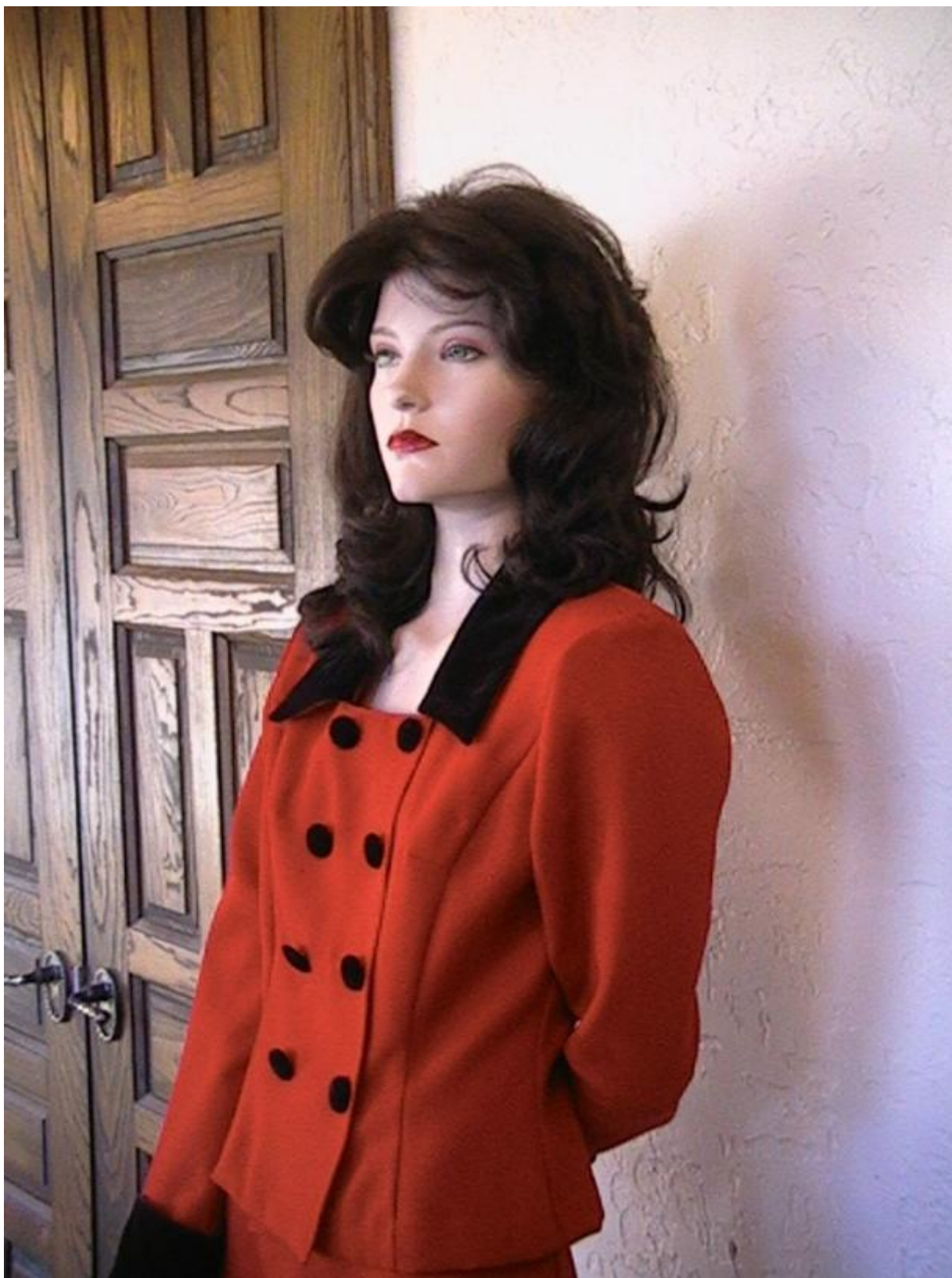
Valerie, un robot umanoide

Ciò conferma quanto siamo sensibili alle sembianze delle creature che ci circondano: l'estetica è sempre stata una guida importante per le nostre azioni e per le nostre scelte (per esempio in campo sessuale e procreativo). Inoltre etica ed estetica sono legate a doppio filo: ciò che è bello ci appare spesso anche buono e viceversa (l'endiadi greca kalòs kài agathós , bello e buono, la dice lunga). Etica ed estetica affondano le loro radici nella nostra storia evolutiva, anzi nella coevoluzione tra noi e l'ambiente.