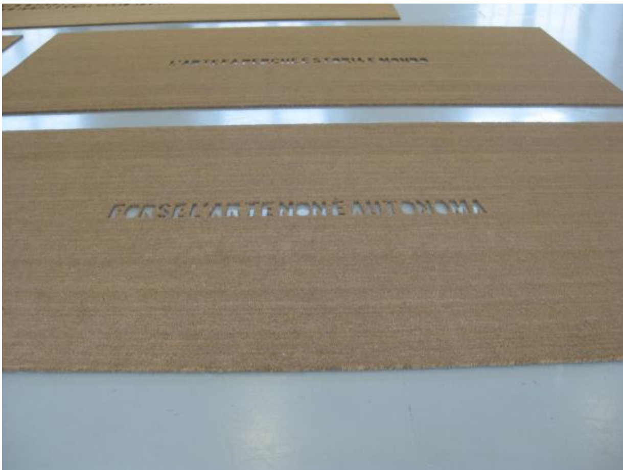
Fabio Mauri, Forse l'arte non è autonoma , 2009, tagli su zerbino, 2 x 200 x 620 cm; L'arte fa perché è storia e mondo , 2009, tagli su zerbino, 2 x 200 x 420 cm. (Museum Fridericianum, DOCUMENTA (13), Kassel, Germania)

L'opera e l'immaginario di Boetti rivivono in modo significativo nell'intenso film-documentario Tea (2012) dell'artista messicano Mario Garcia Torres in cui, attraverso la dimensione itinerante del viaggio, sono ricostruiti i fili dell'esperienza dell' One Hotel aperto da Boetti a Kabul nel 1971. Decentrando il suo lavoro a Kabul, Boetti fu uno dei primi artisti che, trasferendo geograficamente il suo centro di attenzione, anticipò concettualmente una realtà in cui l'Occidente cessava di essere il sistema culturale dominante. L'analisi critica dell'ideologia e la riflessione aperta sul problema della costruzione dell'identità culturale, oltre ad essere al centro delle installazioni L'universo, come l'infinito, lo vediamo a pezzi , Forse l'arte non è autonoma e L'arte fa perché è storia e mondo realizzate da Fabio Mauri nel 2009 ritagliando parole da grandi tappeti di stuoia, trovano massima espressione nella sua intensa performance Che cos'è la filosofia. Heidegger e la questione tedesca. Concerto da tavolo del 1989, riproposta durante i giorni di apertura ufficiale della manifestazione.