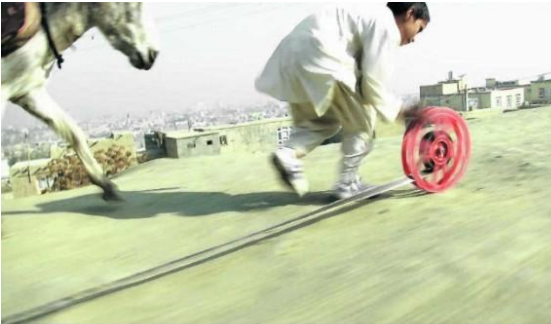
Francis Alÿs, Reel-Unreel, 2011, still da video, DOCUMENTA (13), Kassel, Germania

Inaspettatamente in una piccola casa dentro Karlsaue park un tempo dimora di un giardiniere, ecco comparire le tracce di un intervento molto intimo e singolare Here & There (2012) realizzato dall'artista italo-brasiliana Anna Maria Maiolino. Un insieme di diverse forme realizzate con dell'argilla (dalla serie Modeled Earth iniziata sul finire degli anni Ottanta) ricoprono, investono e si appropriano di ogni superficie e mobilio dell'abitazione, la voce dell'artista trasmessa da un piccolo autoparlante che ripete ininterrottamente la frase I am I , diverse fotografie appese ai muri e una serie di abiti e di oggetti di uso quotidiano. Tutto dà l'impressione di essere irreversibilmente catturato in un'atmosfera bloccata nel tempo e paralizzata nello spazio. Questa grande installazione, affronta il tema della memoria e della costante ricerca delle proprie origini rappresentata simbolicamente dall'immagine della casa, utilizzando l'argilla modellata dall'uomo come metafora espressiva dell'identità individuale e collettiva.