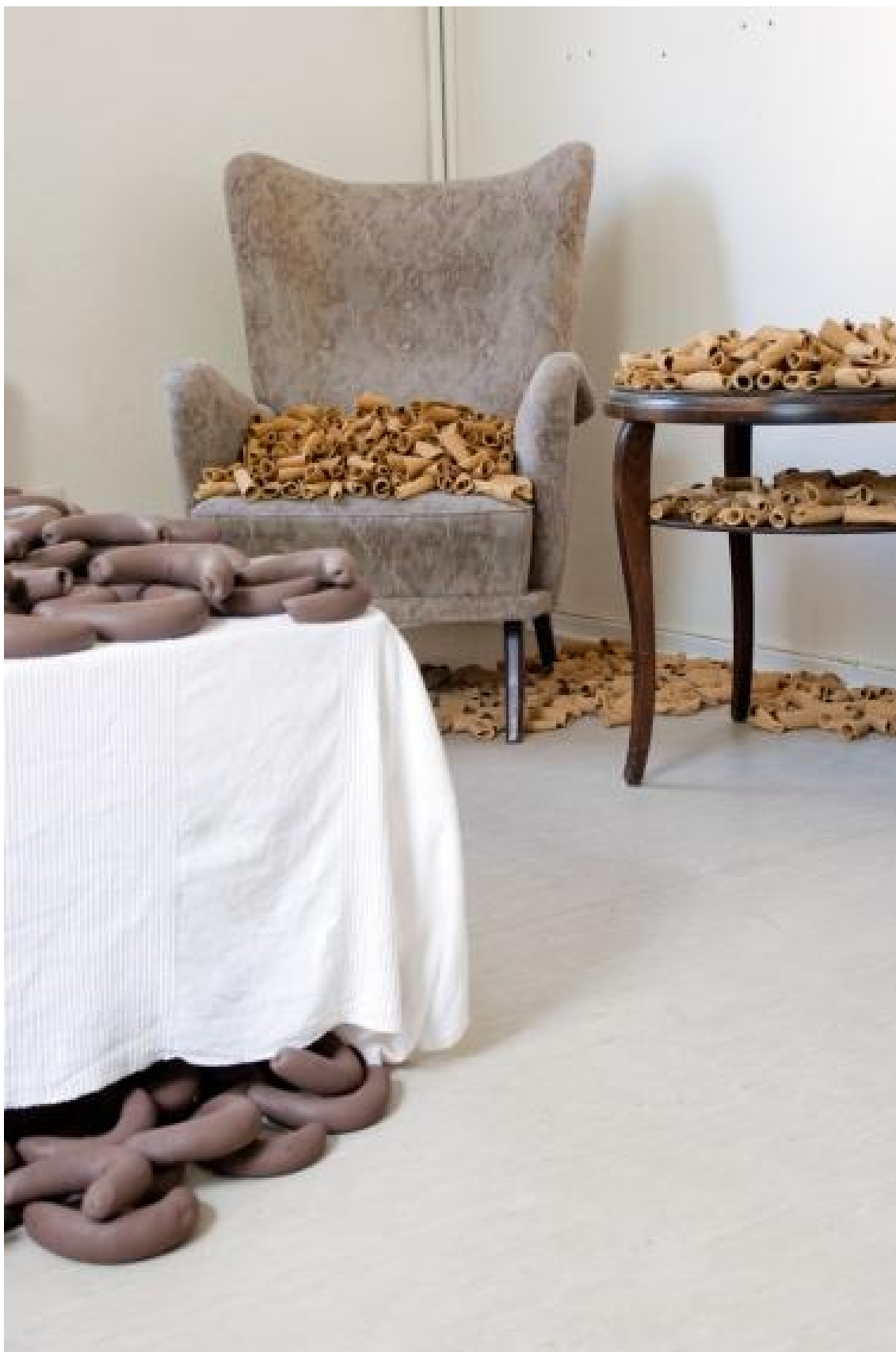
Anna Maria Maiolino, Here & There, 2012, installazione (2000 kg di argilla modellata, oggetti, fotografie, vegetazione, suoni). (Karlsaue Park: Maintenance Area, dOCUMENTA (13), Kassel, Germania)

Definita da Carolyn Christov-Bakargiev come “la mente”, la rotonda semicircolare del Fridericianum è un grandecaleidoscopio critico e immaginifico che crea rapporti trasversali tra documenti, immagini, reperti archeologici e opere d’arte, unendo le nature morte di Giorgio Morandi ai sinistri metronomi di Man Ray, le