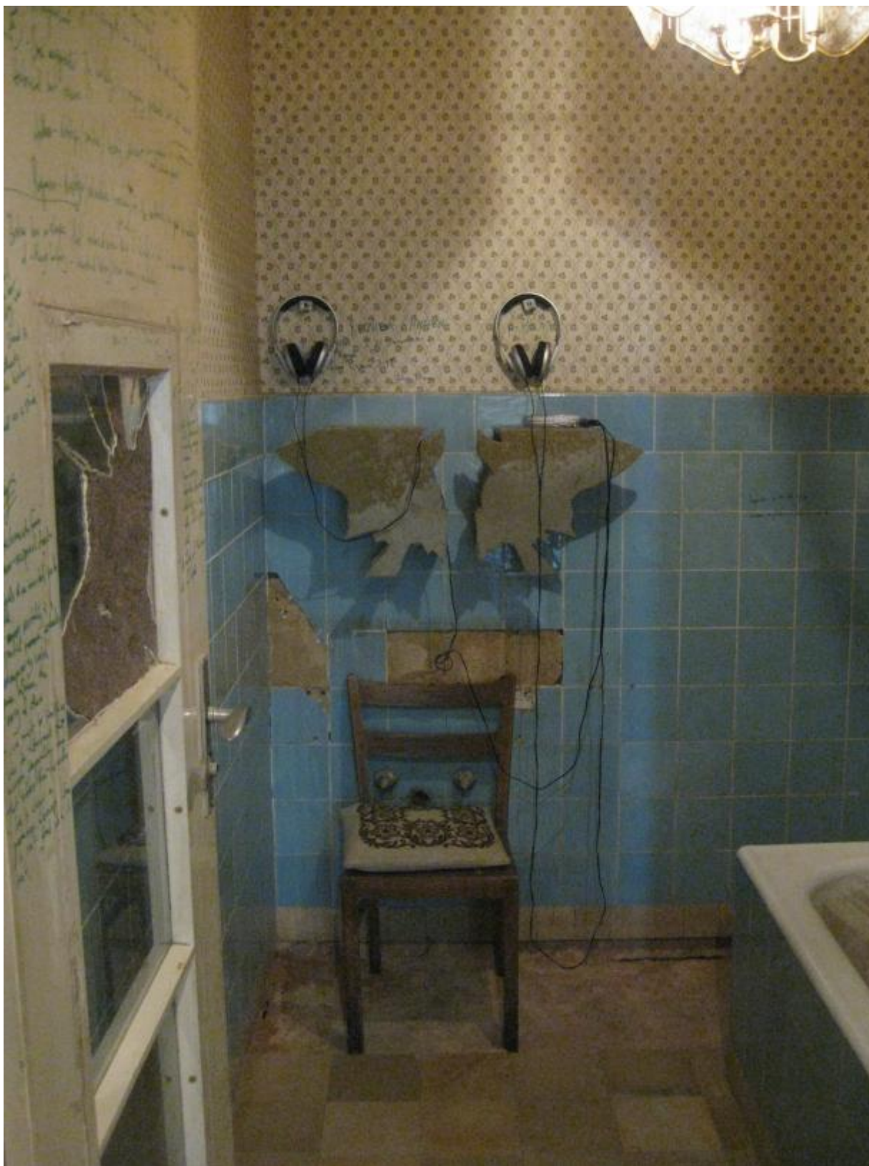
Theaster Gates, 12 Ballads for the Huguenot House, 2012, legni rotti e altri materiali da costruzione dal 6901 South Dorchester, Chicago, video, suoni, 9,14 x 18,29 x 36,56 m. (Huguenot House, dOCUMENTA (13), Kassel, Germania)