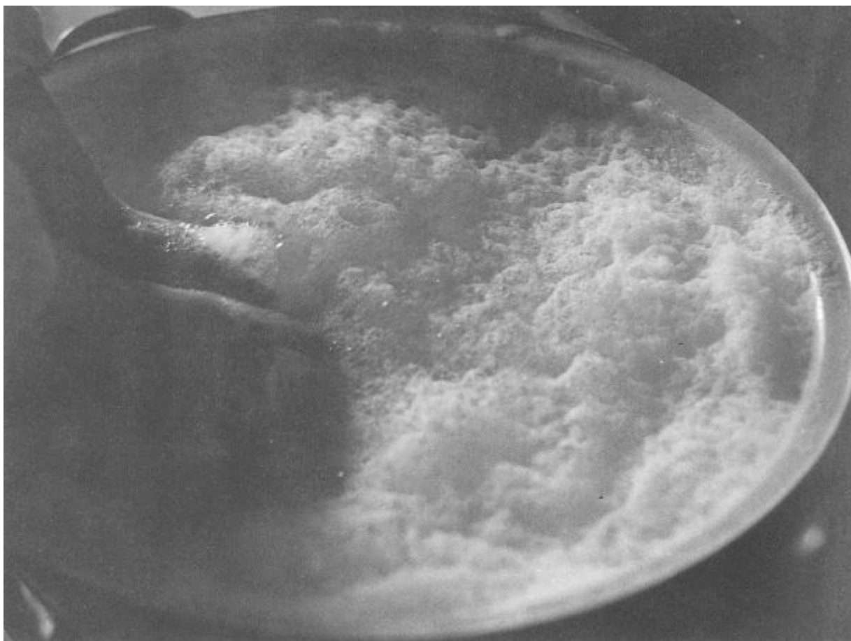
Raoul Hausmann, Senza titolo, 1931

Forse potremmo dire anche che è uno sguardo come quello di un bambino. Me lo suggerisce un possibile paragone con quello che adotta scientemente Marina Ballo Charmet, e dunque uno sguardo “con la coda dell’occhio”, come lo chiama lei, cioè con un’altra attenzione, motivata diversamente, che sa bene quello che vede e che vuole fare, ma pensa più a se stesso e comunica solo in seconda istanza, trasversalmente. Uno sguardo davvero particolare, che dà immagini singolari.