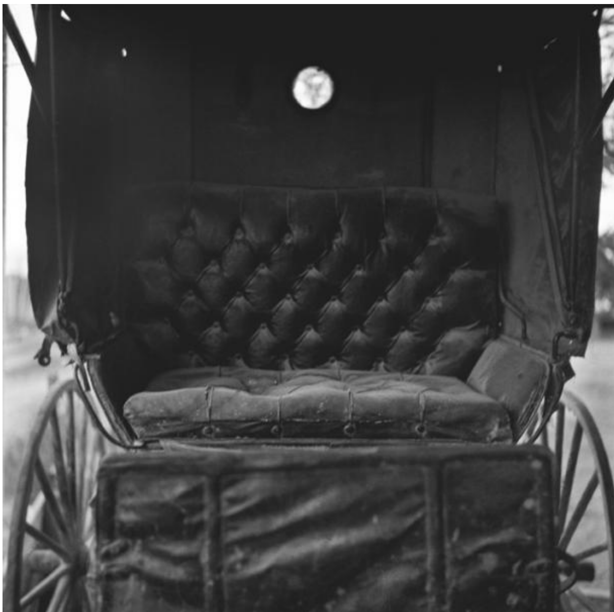
Robert Rauschenberg, Untitled (Interior of an Old Carriage), 1949

Prima ancora, nel 1950, si troveranno le cianografie già rese famose anche da noi per l'analisi formalista di Rosalind Krauss che le riconduce all'interesse di Rauschenberg per l'indice, la traccia, l'impronta, a riprova della sua consapevolezza teorica anche riguardo a questo aspetto della fotografia, e dell'arte.