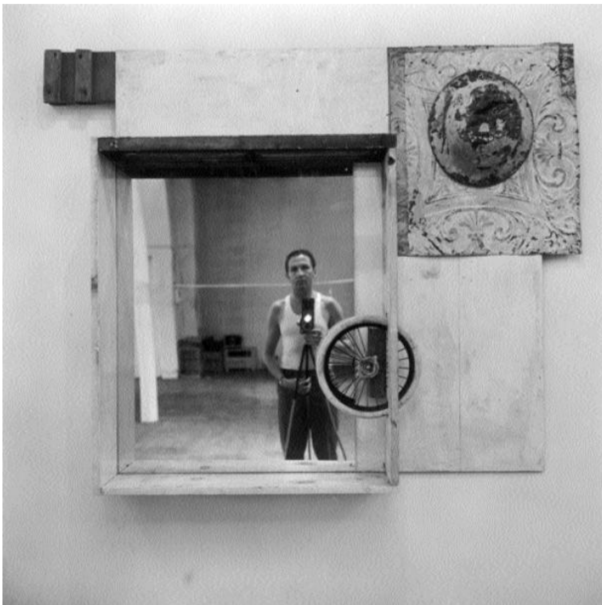
Robert Rauschenberg, Untitled (self-portrait with Inside Out, early state), ca. 1962

Oppure si guardi la prima foto all'interno, di fatto impostata allo stesso modo: un bellissimo interno di carrozza foderata di tessuti, con le ruote sui lati – la ruota torna spesso nell'opera di Rauschenberg e in tante delle sue fotografie – e quel semplice piccolo cerchio al centro, equivalente dello specchio dell'altra fotografia, che buca il fondo della carrozza ma al tempo stesso balza in avanti verso di noi, come una luna piena su un cielo notturno.