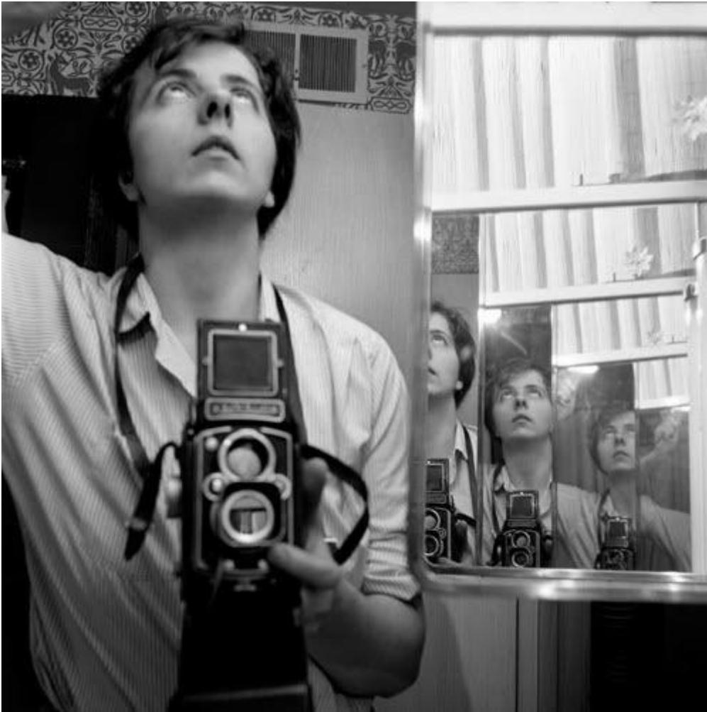
Autoritratto, 1962, Estate of Vivian Maier, courtesy of Maloof Collection and Howard Greenberg Gallery, NY.

Entrando, ci si affaccia nella prima sala dedicata agli autoritratti. Filone tanto importante nella ricerca di Vivian Maier quanto quello di reportage urbano, ci permette di prendere – o riprendere – confidenza con gli occhi che avrebbero dato vita ad alcune delle immagini più iconiche del secondo Novecento.