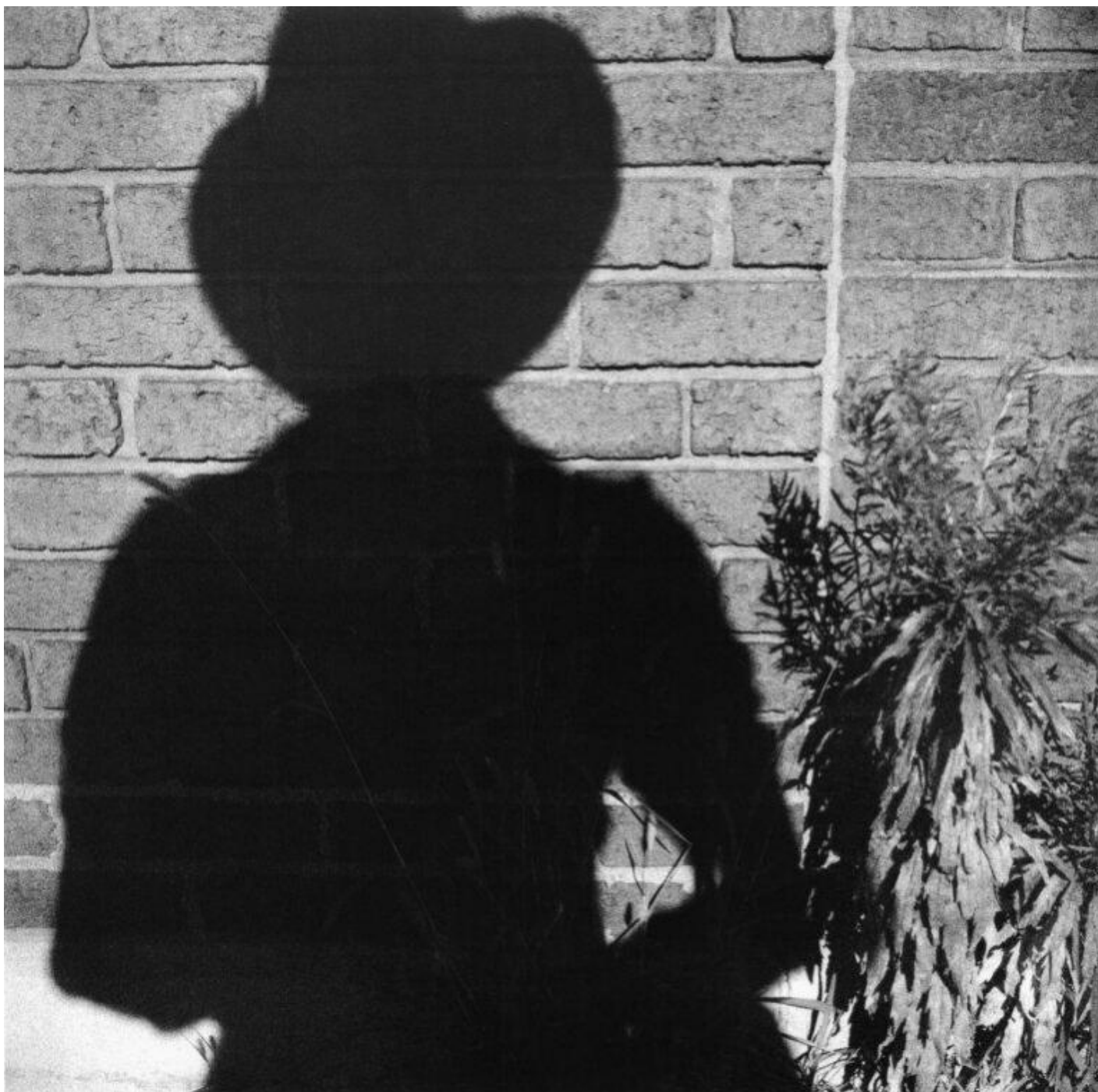
Autoritratto, 1962, Estate of Vivian Maier, courtesy of Maloof Collection and Howard Greenberg Gallery, NY.

In una poetica maturamente sintetica, che vede sì una moltitudine di scatti, ma unificati sotto pochi e correlati filoni, proprio l'astrazione è un secondo modo di vedere che la Maier sa far convivere perfettamente col proprio sguardo lucido sulla realtà umana: nelle sezioni "Gesti" e "Forme", dettagli di scenari in cui si muoveva diventano vere composizioni informali dei segni che l'uomo lascia – riflessi, pozzanghere, tende, oggetti lasciati per strada o buttati nella spazzatura. Ogni lascito umano è per la Maier fonte inesauribile a cui attingere per addentrarsi con cautela nel mondo, cercando di capire qualcosa da cui si è sempre tenuta lontana, in una solitudine calmierata soltanto dalla sua professione.