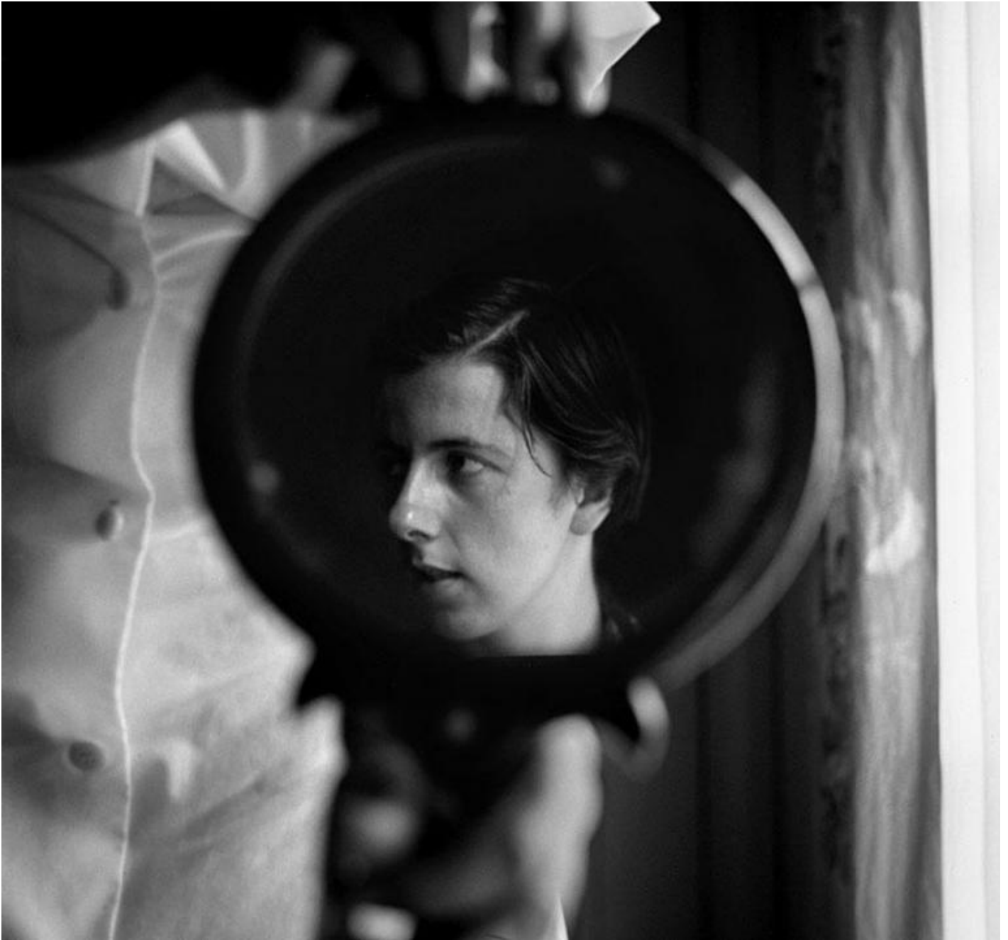
Autoritratto, 1962

dall'uomo come necessaria. Così facendo, oltre al suo sguardo rimasto precluso agli altri, l'unica tesoriera di quel mondo visto, l'unico archivio di quelle immagini impresse, è stata la sua stessa memoria. Gli occhi per un momento, la memoria per quanto tempo possibile. Questa interruzione del meccanismo che vede l'attenzione posta solo sulla prima fase del processo, ovvero quella della raccolta di informazioni e suggestioni, è il fatto tanto curioso, il punto di rottura che rende impossibile qualsiasi immedesimazione e che per questo suscita tanta attrattiva.