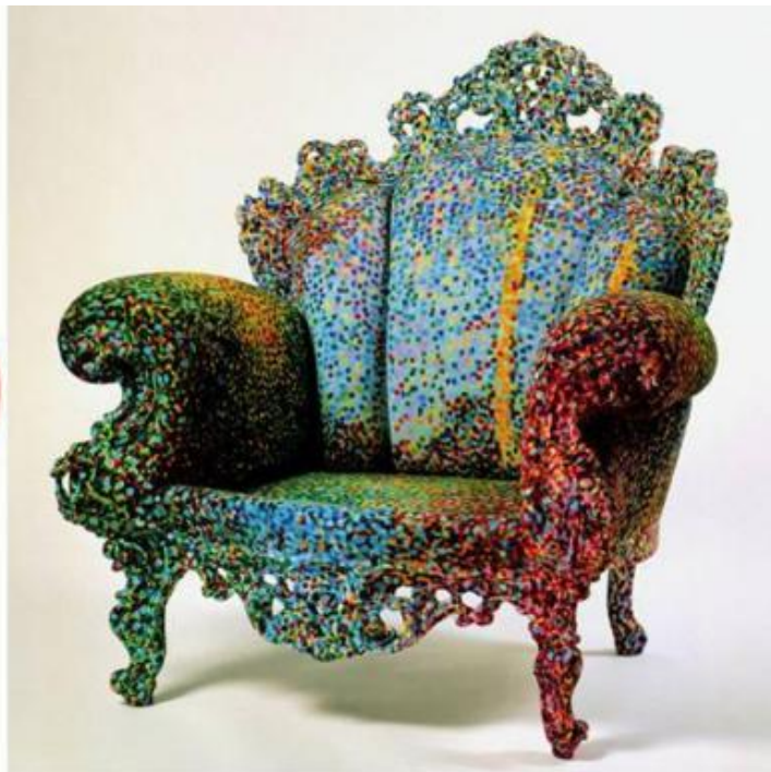
Marco Zanuso, Poltrona Lady, 1951 (vincitrice della Medaglia d'oro alla IX Triennale); Alessandro Mendini, Poltrona di Proust, 1976/78, Studio Alchimia.

Se la Lady incarna dunque il linguaggio del modernismo in tutte le sue accezioni, la Poltrona di Proust , al contrario, lo contesta con evidente determinazione.