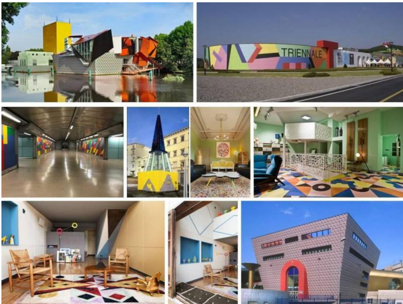
Alessandro Mendini. In alto: Groningen Museum (Olanda), 1989-94. Triennale di Incheon, Corea del Sud, 2009. Al centro: Napoli, stazione Mater Dei e stazione Salvator Rosa della metropolitana, 1993-2015. Casa Olda, Val Taleggio (Bg), 2006. Negozio Atelier Fragile, Milano Via San Damiano, 2014. In basso: nell'appartamento n. 50 della Unité d'Habitation di Marsiglia di Le Corbusier: due vedute. Piscina comunale Bruno Bianchi, Trieste, 2002.