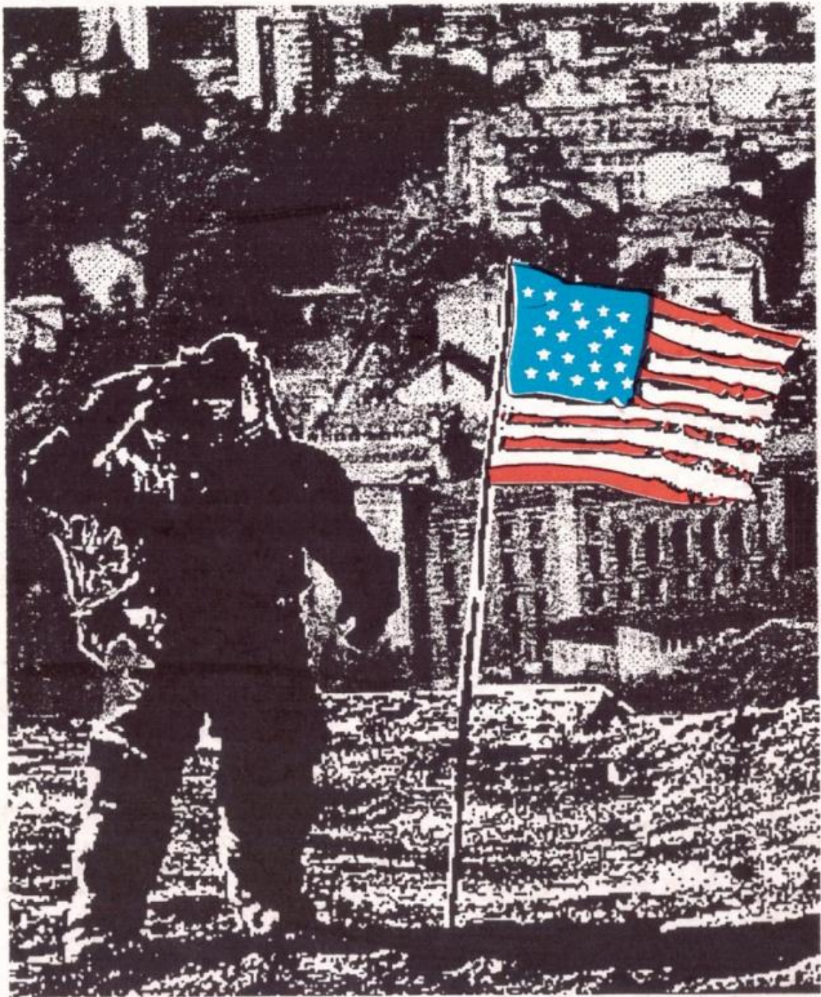
"Man on the Moon" - Design "Trio" - Sarajevo

"That's one small step for Sarajevo, but one giant leap for mankind..."