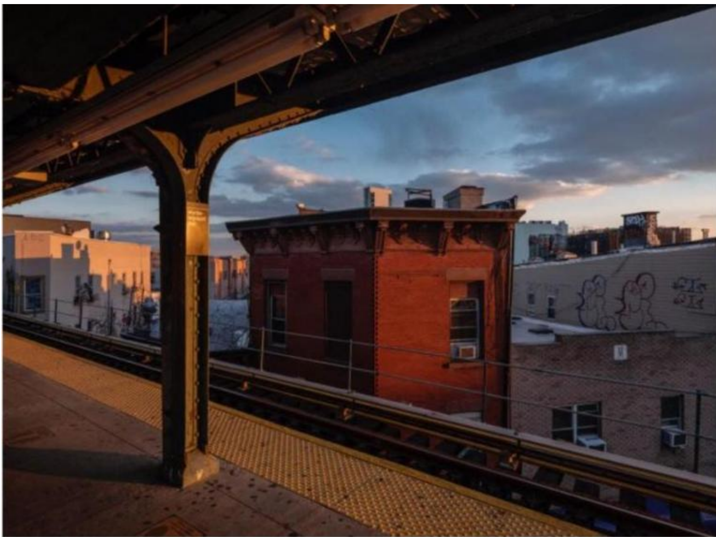
Red house, Lynn Saville, courtesy of the artist and Alessia Paladini Gallery.

Si è detto spesso che la fotografia tradizionale – e quella di Saville per certi versi lo è – ha cercato di rassicurare le coscienze dando l'illusione che la realtà fosse concretamente raffigurabile nelle immagini fotografiche. Solo l'incompletezza, l'apertura allusiva, la forza evocativa e un approccio non documentario – secondo questo modo di intendere le fotografie – può conferire un valore aggiunto alle immagini, aprirle all'immaginazione del fruitore. Ebbene, è come se le immagini di Saville dimostrassero che è vero anche il contrario: infatti, indagando con la massima precisione la realtà visibile ciò che emerge è qualcosa di invisibile. Un invisibile da intendersi però – almeno nel suo caso – in un doppio senso. Da una parte la realtà, tradotta in immagine, s'impone con un'alterità enigmatica e rinvia a un che di straniante, di inafferrabile.