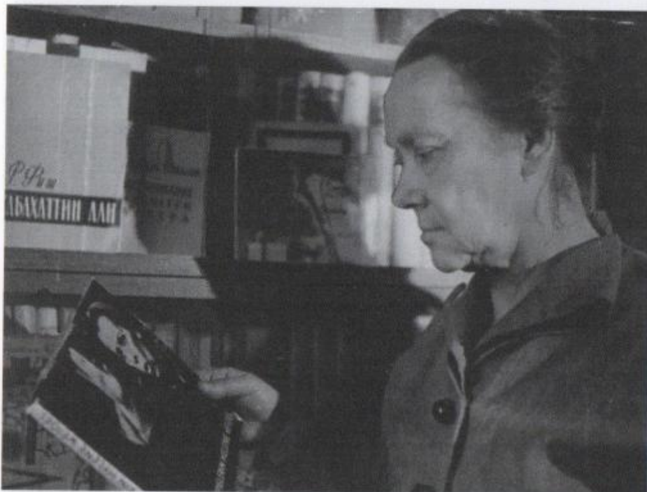
Ritratto di Asja Lācis, anni Cinquanta.