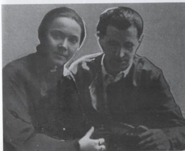
Fotomontaggio con immagine di Bertolt Brecht.