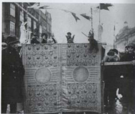
Presentazione del Teatro delle marionette Petrushka in una strada di Mosca, 1° maggio 1929