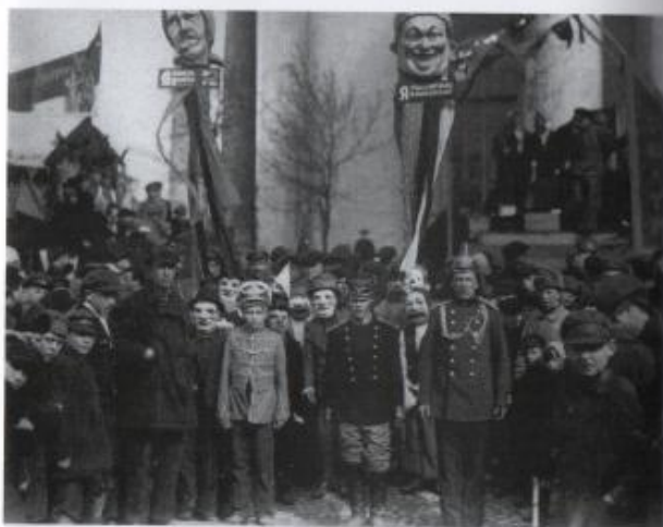
Dimostranti con maschere a Leningrado, 1° maggio 1924. Slogan: a sinistra "Compro dal mercante privato"; a destra "Compro dalla cooperativa". "Krasnaja Gazeta", 2 maggio 1925.

È proprio il teatro dei bambini uno dei primi argomenti di conversazione con Benjamin. I due si conoscono a Capri nel 1924, dove L?cis trascorre la primavera e l'estate con la figlia Daga e il futuro marito Bernhard Reich. È piuttosto noto l'episodio che la vede in difficoltà mentre cerca di comprare delle mandorle di cui non conosce il nome in italiano, quando Benjamin, che da giorni la osservava da lontano, accorre in suo aiuto. Si può leggere qui il bel racconto dei rapporti tra Benjamin e L?cis dal punto di vista del filosofo, che non ha mai nascosto la fascinazione che la regista esercitava su di lui. A volte la scrutava così intensamente che a stento ascoltava ciò che lei diceva, scrive nel Diario moscovita , resoconto del viaggio che Benjamin fece tra il dicembre 1926 e il gennaio 1927 nella Russia 'sovietista', come veniva allora chiamata la Russia sovietica nella pubblicistica italiana.