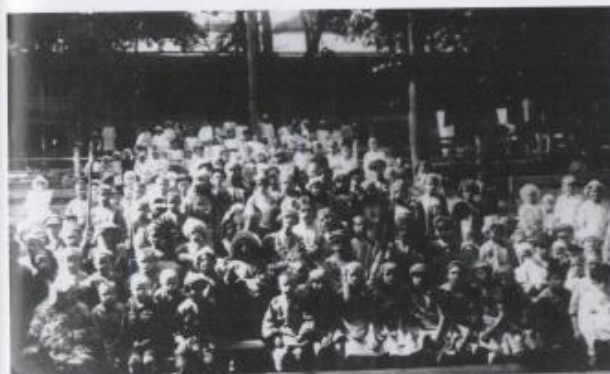
Membri del gruppo di teatro per bambini che con Asja Lācis mettono in scena la fiaba Alina di V. Mejerchol'd, Orel, luglio 1920.