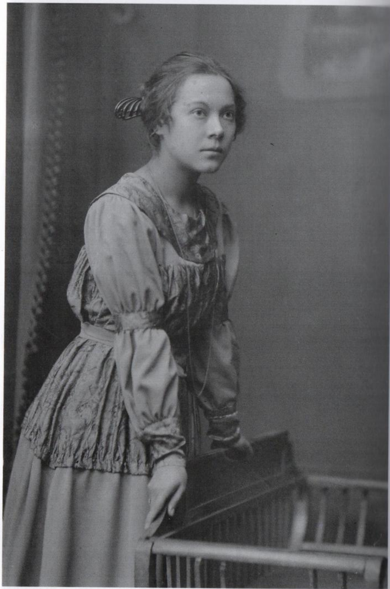
Ritratto di Asja Lācis, 1910-12 circa.