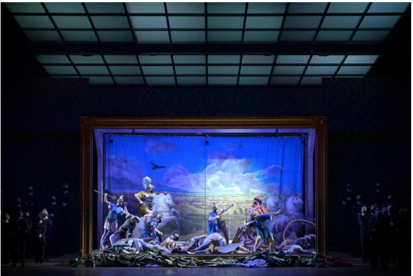
Un particolare della Scena del Trionfo all'Opéra Bastille, febbraio 2021.

Quanto al finale dell'opera, la morte di Aida e Radamès (lei piuttosto misteriosamente raggiunge lui, condannato ad essere sepolto vivo per alto tradimento), una notte d'estate di molti anni fa all'Arena di Verona la sentii definire da un autorevole critico musicale, forse ironicamente o forse non del tutto, "la via italiana al Liebestod ". Rispetto al Tristan wagneriano, cui alludeva la battuta, l'unico generico collegamento consiste nella morte per amore, ma naturalmente le analogie si fermano qui. Massimo Mila aveva idee ben diverse: per lui quella scena è un tentativo di colpo grosso da parte del musicista, tentativo "non interamente riuscito".