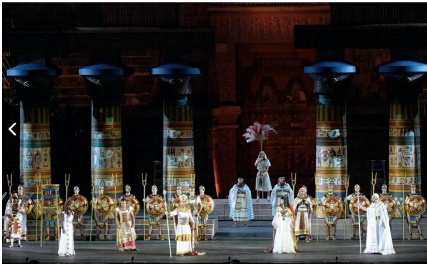
Una scena della versione 1913 di “Aida” all’Arena di Verona.

Il riferimento non detto ma chiarissimo era a Richard Wagner. Il debutto dell'opera egizia era avvenuto poche settimane dopo la prima esecuzione di un'opera dell'autore tedesco in Italia. Si trattava di Lohengrin , rappresentato a Bologna nel novembre 1871. A una replica aveva assistito anche il bussetano, munito di partitura che annotò fittamente (e quasi mai in senso positivo). L'opera d'arte dell'avvenire (anche se è difficile definire in questo modo Lohengrin ) iniziava la sua strada nel Paese del melodramma e anche se la tecnica dei leitmotive , dei temi ricorrenti, in questo dramma musicale è solo embrionale, non mancò chi osservò che un simile approccio aveva adottato anche Verdi in Aida , in particolare rendendo “musicalmente riconoscibili” con temi strumentali specifici le due protagoniste femminili, Aida e Amneris. Ma anche delineando un inedito spazio per l'orchestra, e oscillando fra i “numeri chiusi” della tradizione italiana e una più ampia concezione formale. In quest'opera, in effetti, Arie, Duetti o Terzetti (con o senza cabaletta) e Concertati a volte risuonano “all'antica”, altre volte costituiscono scene di notevole articolazione drammatica e musicale.