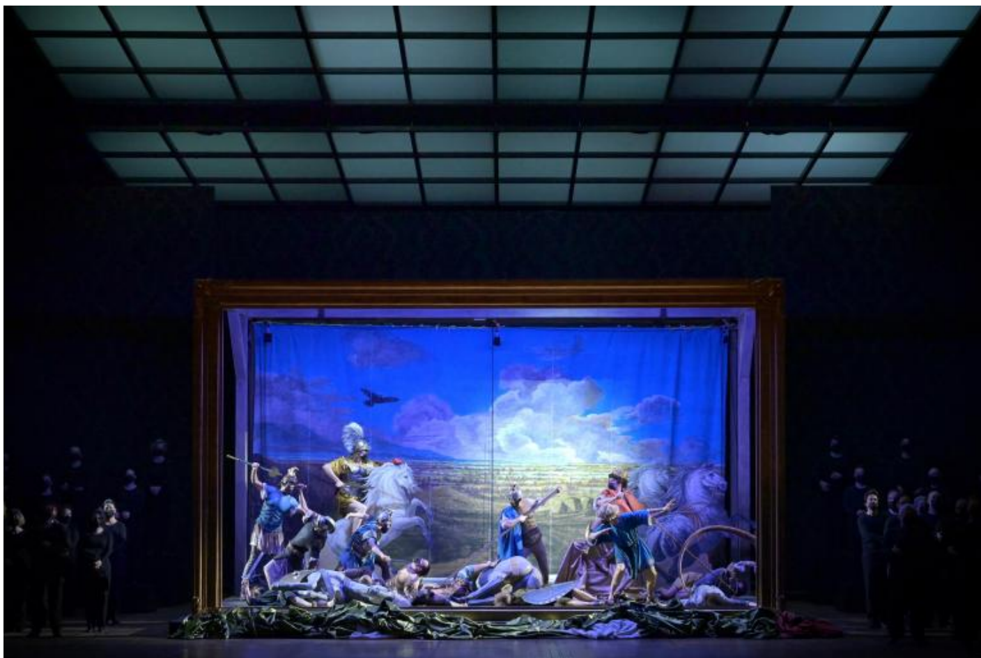
Un particolare della Scena del Trionfo all'Opéra Bastille, febbraio 2021 (Vincent Pontet).

Lo stesso Mila, nel libro che conclude e riunisce decenni di studi sul bussetano ( L'arte di Verdi , Einaudi, 1980), metteva a fuoco la questione- Aida uscendo dall'ambito storico e musicologico per entrare nel problema della messa in scena: "Scenografi e registi non hanno ancora trovato uno stile contemporaneo per la parte spettacolare e decorativa di Aida ". Vista nella prospettiva di oggi, la considerazione appare quasi una divagazione per attenuare la severità del giudizio musicologico. In realtà, qualcosa si è mosso negli ultimi tempi e specialmente di recente, secondo l'auspicio di Mila. A fianco di molte scelte conservative o semplicemente inefficaci, e in parallelo con l'enorme successo decretato a partire dal 1982 alla ricostruzione realizzata da Gianfranco de Bosio dello spettacolo del 1913 in Arena, che continua a essere proposta nell'anfiteatro romano di Verona, anche Aida è diventata oggetto di "regietheater", non senza connotazioni politiche, con il corredo delle forti ripulse tradizionalistiche tipiche delle discussioni sull'opera nell'epoca dei social network.