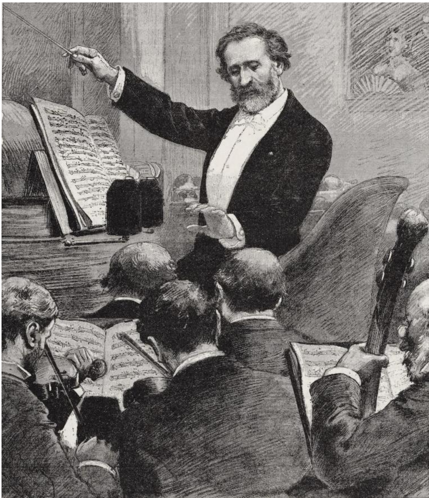
Verdi dirige “Aida” all’Opéra di Parigi nel 1880.

Il clamoroso successo scaligero era però anche l’inizio del “doppio binario” su cui spesso si muove ancor oggi, fra pubblico e critica, la ricezione di Aida . Una situazione ben presto colta da Verdi. Dalla soddisfazione iniziale («Questa è fra le mie delle meno cattive. Il tempo poi le darà il posto che le conviene. Per dir tutto in una parola, parmi sia un successo che riempirà il teatro») il musicista sarebbe passato al fastidio non dissimulato per le «noje infinite e disillusioni artistiche grandissime» causategli da questo