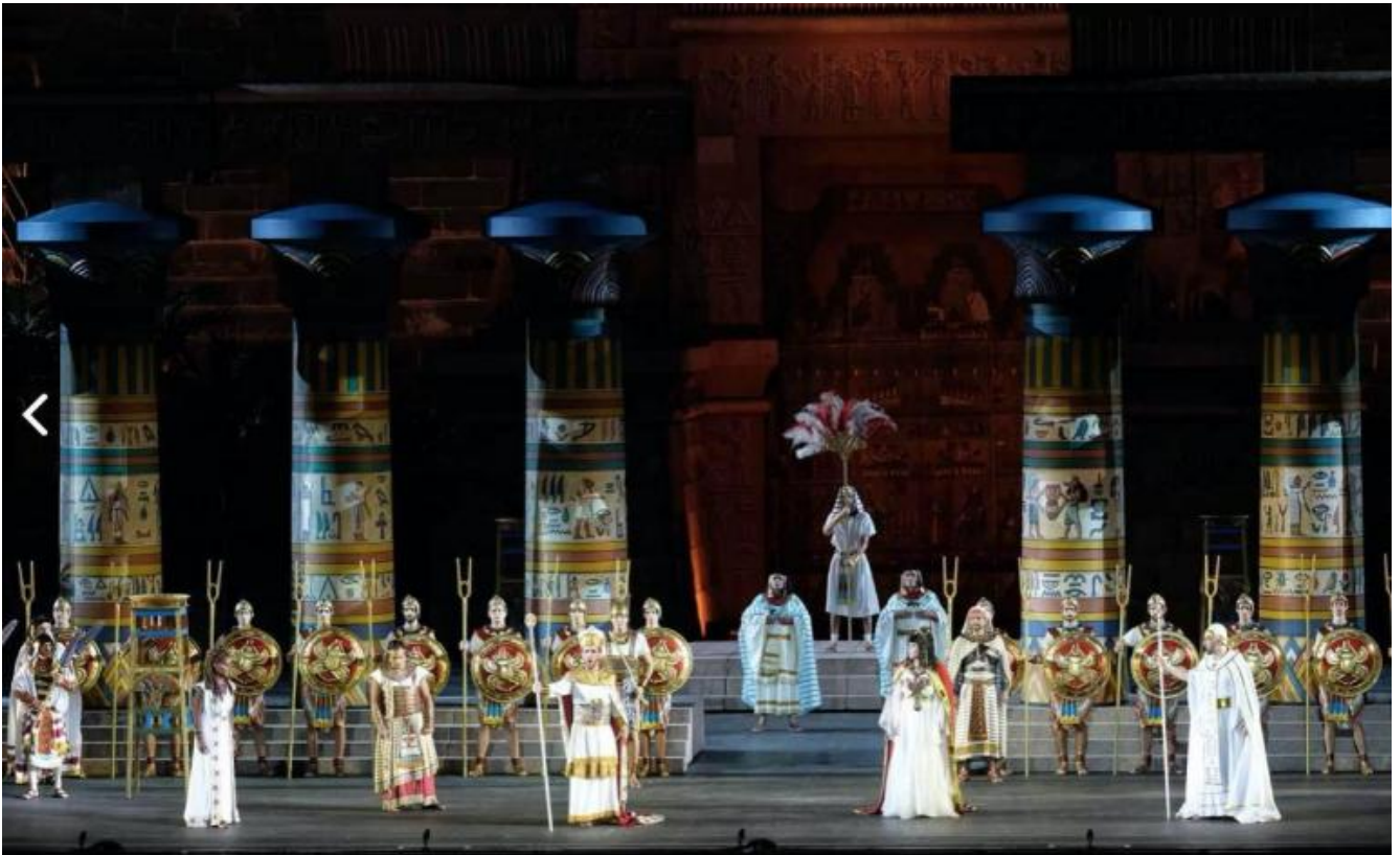
Una scena della versione 1913 di "Aida" all'Arena di Verona.

La situazione fu "fotografata" dopo la prima scaligera da Filippo Filippi, il più autorevole critico musicale italiano dell'epoca, che l'opera l'aveva sentita anche al suo debutto egiziano, un mese e mezzo prima. «Non c'è persona che si occupi seriamente di arte - scrisse nella sua recensione sul giornale "La Perseveranza" - la quale non abbia trovato nell' Aida un singolare dualismo, o meglio dire antagonismo, una tendenza cioè spiccatissima ad accettare nell'opera in musica le idee, i principî, le tendenze ed anche i procedimenti scientifici della nuova scuola: negare che Verdi non ha subita l'influenza di Meyerbeer, di Gounod e di Riccardo Wagner sarebbe negare la luce del sole: d'altronde questo stesso maestro conserva un affetto immenso per il suo passato e quindi con strana singolare precipitosa transizione passa dall'uno all'altro stile». Filippi concludeva che questo stile "composito" era già presente in Don Carlos e che là gli pareva meglio risolto, mentre in Aida aveva condotto a qualche "disuguaglianza". E non fu sufficiente la difesa - vagamente d'ufficio - del musicologo austriaco Eduard Hanslick, gran capo del movimento antiwagneriano («Nell' Aida non v'è una battuta per cui l'italiano vada debitore al tedesco») per raddrizzare le cose, almeno dal punto di vista critico.