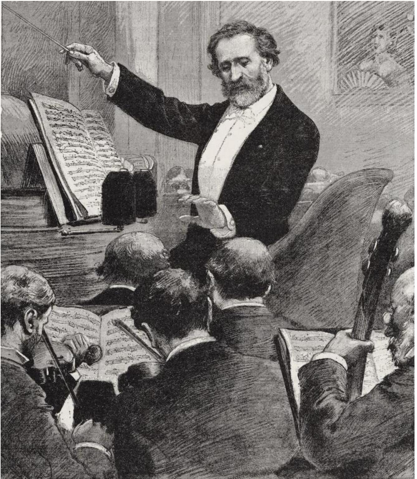
Verdi dirige "Aida" all'Opéra di Parigi nel 1880.

Il clamoroso successo scaligero era però anche l'inizio del "doppio binario" su cui spesso si muove ancor oggi, fra pubblico e critica, la ricezione di Aida . Una situazione ben presto colta da Verdi. Dalla soddisfazione iniziale («Questa è fra le mie delle meno cattive. Il tempo poi le darà il posto che le conviene. Per dir tutto