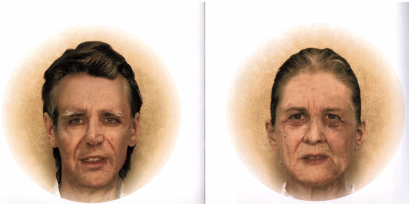
Van e Ada vecchi.

Quando si cerca di richiamare alla mente il proprio io di un tempo, a volte si incontra una figura indecisa, ferma come un ospite timido o ritardatario nella cornice illuminata di una porta. Le ricostruzioni sono sempre congetture: quel che conta è l'eccitazione nella riscrittura, non quel che accadde davvero. È questo che vuol dire "il romanzo di una vita"?