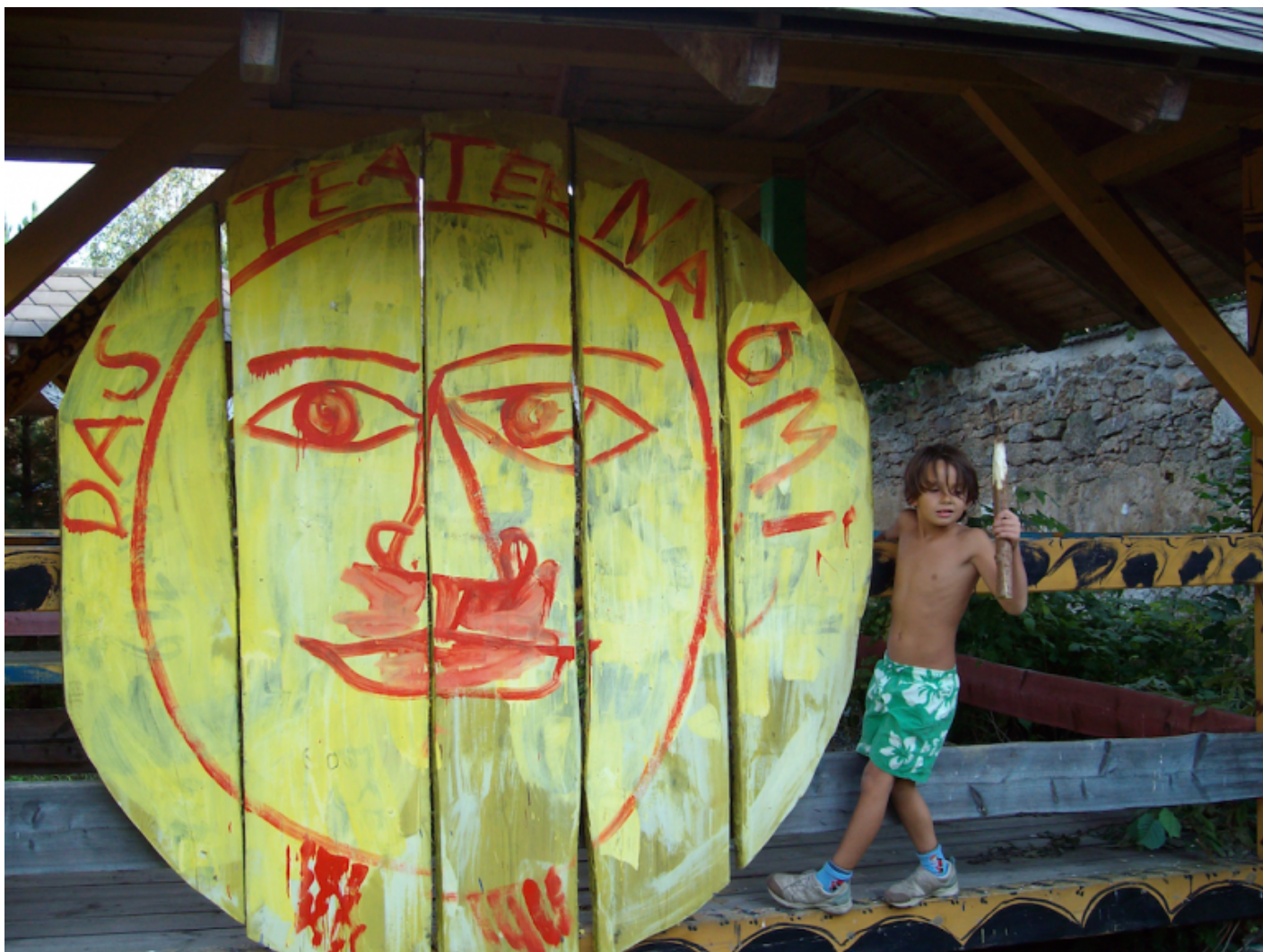
Il teatro della Casa Azzurra di Achternbusch nel Waldviertel in Austria.