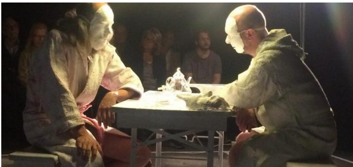
Un'immagine da Arkadia, regia di Werner Waas, ph. di P. Kees.

Ecco, ora è il 13 gennaio 2022 e ho appena letto sul giornale che sei morto pochi giorni fa. Ho ritirato fuori quel vecchio testo scritto in occasione della pubblicazione del tuo romanzo in Italia senza modificarlo granché. Voglio solo aggiungere che dopo quel 2011 ci sono state ancora molte altre lettere, e incontri, e anche un ultimo spettacolo da un tuo testo. La prima assoluta di Arkadia , l'ultimo tuo testo, nero, nerissimo, ma sempre intriso di quel tuo invincibile umorismo. L'ho realizzato in Germania in occasione del tuo ottantesimo compleanno. Ma tu eri già costretto a letto, non uscivi più di casa, accudito da tua figlia mentre guardavi alla TV i documentari sugli animali. La tua è stata un'uscita di scena lenta e silenziosa. Ma non sarò certo l'unico a ricordarti, per sempre.