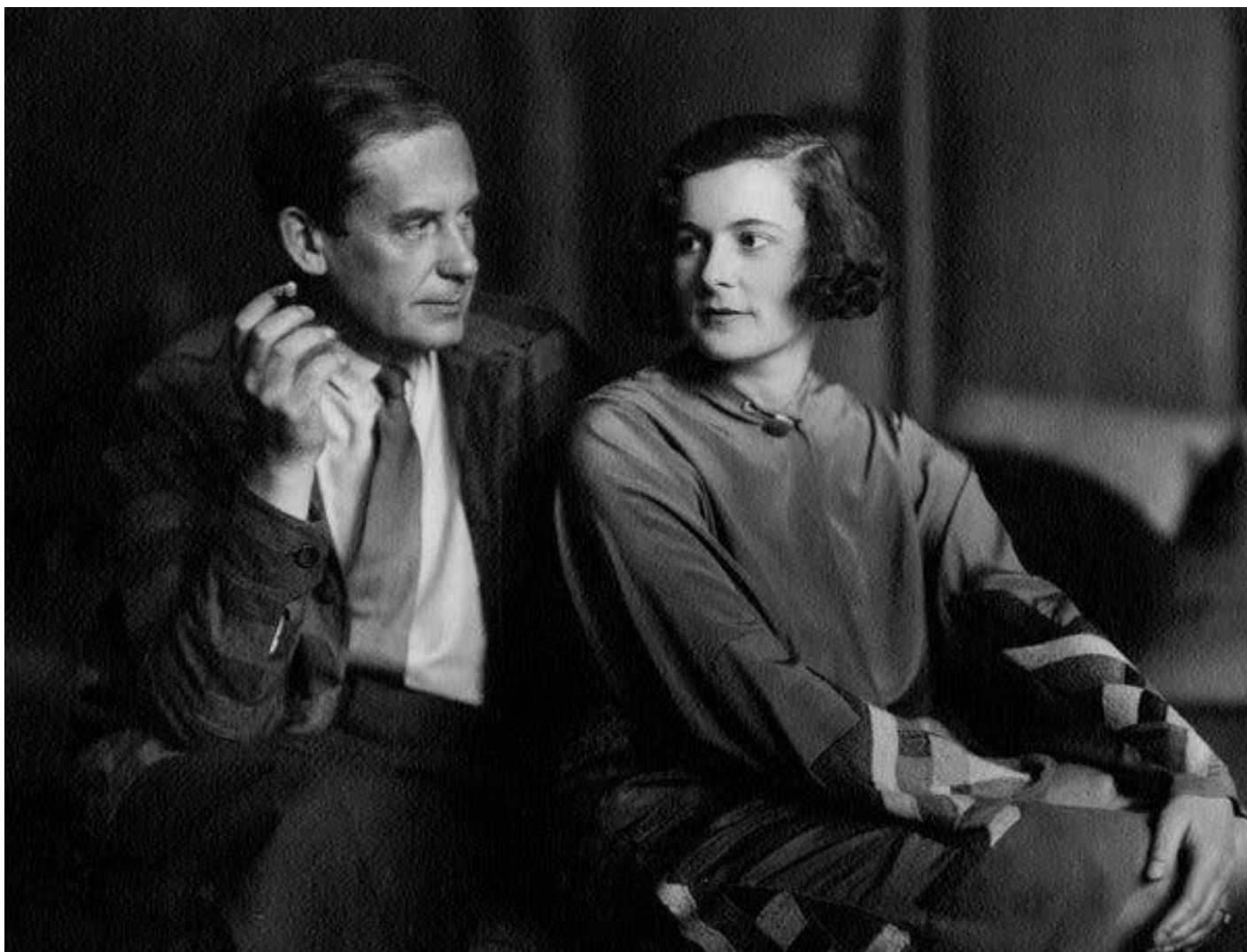
Walter e Ise Gropius il 16 ottobre 1923, poco dopo il loro matrimonio.

Il volume è anche denso di notizie e di aneddoti sulle loves tra docenti maschi e allieve (nessuna tra docenti femmine e allievi!) e di liaison , più o meno ufficiali, dei Maestri con le loro compagne.