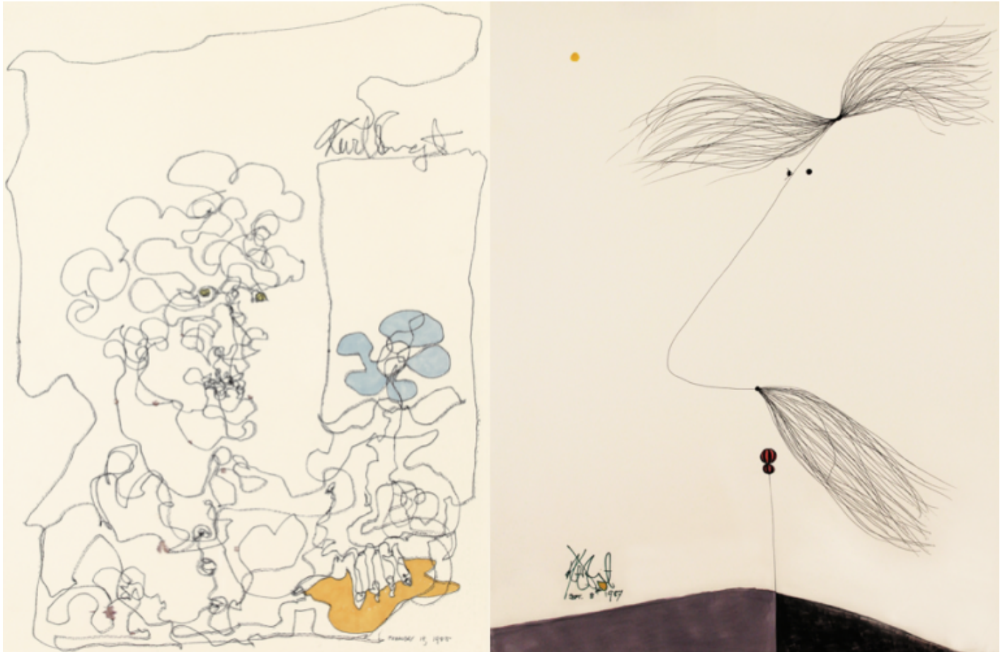
Disegni di Kurt Vonnegut.