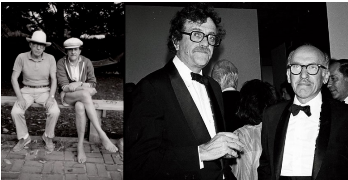
Vonnegut con Saul Steinberg