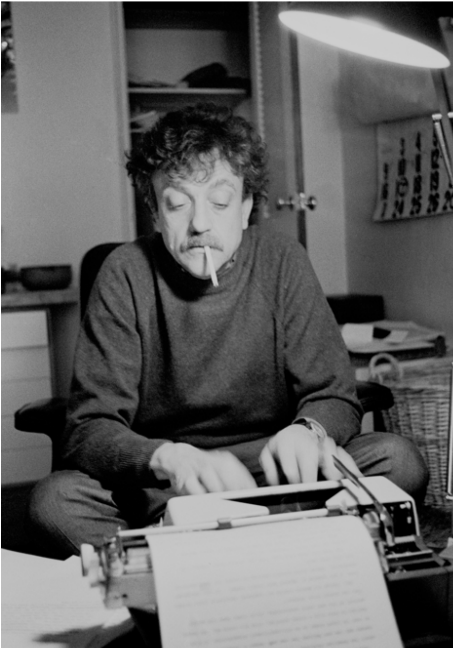
Vonnegut nel 1972.