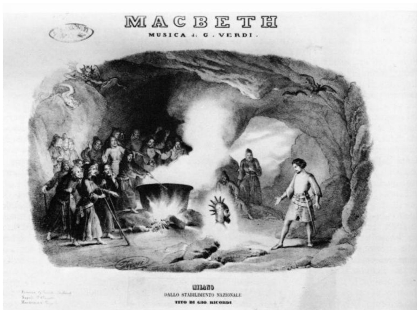
Incisione di Roberto Focosi per lo spartito per canto e pianoforte di Macbeth, Edizione Ricordi 1874.

si guastarono definitivamente, anzi. A lui il compositore si sarebbe rivolto nuovamente e ben presto per Rigoletto e La Traviata . E lo avrebbe nuovamente consultato anche per gli aggiustamenti della versione 1865 dell'opera da Shakespeare.