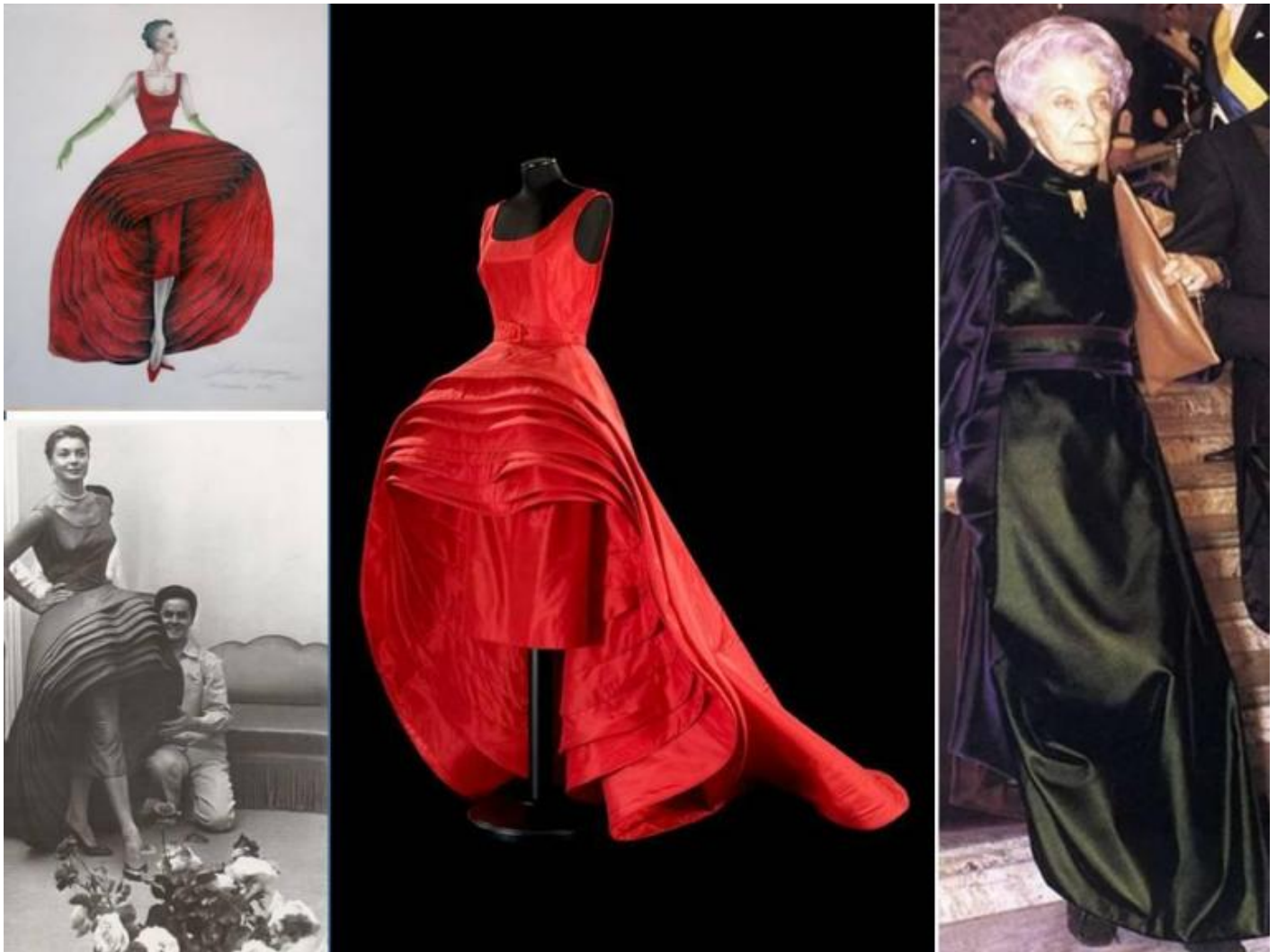
A sinistra: schizzo del progetto dell'abito Nove Gonne, 1956. In basso: l'attrice Esther Williams indossa l'abito Nove Gonne, con un giovanissimo Roberto Capucci, 1958. L'abito Nove Gonne. A destra: Stoccolma, 1986, Rita Levi Montalcini ritira il Premio Nobel con indosso un abito di Roberto Capucci.

Persino Rita Levi Montalcini, nelle occasioni ufficiali, indossava solo abiti disegnati da lui: con uno di essi andò a Stoccolma a ritirare il Premio Nobel nel 1986.