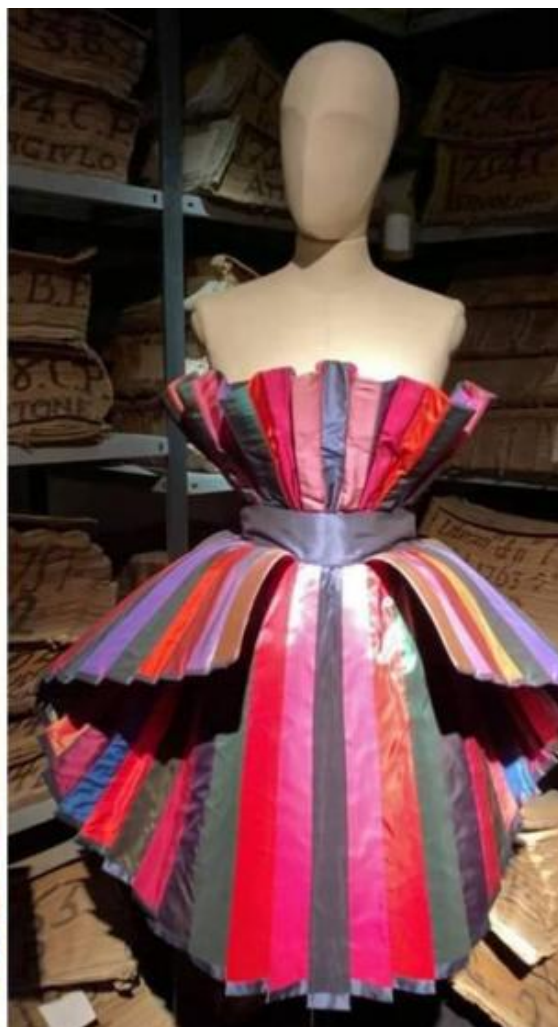
Un disegno di progetto di Roberto Capucci, con i sillibi degli accostamenti cromatici. L'abito realizzato in taffetà con intarsi policromi.