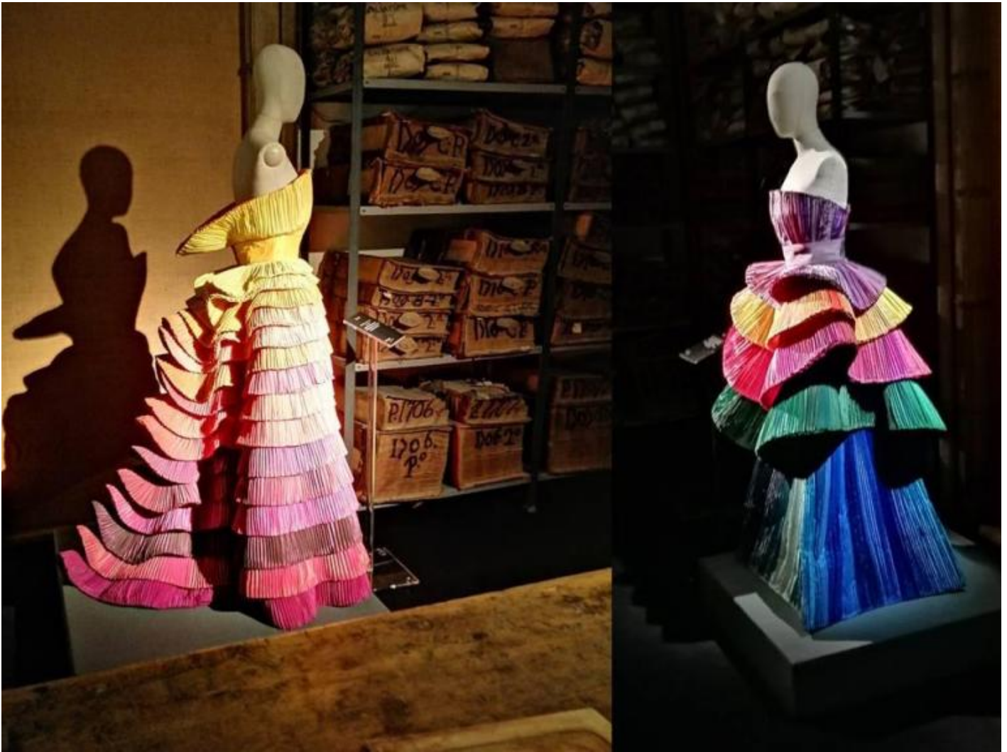
Alcuni degli abiti-scultura di Roberto Capucci, ricchi di pieghe, esposti nella mostra Pagine di seta. In alto a sinistra, L'angelo d'Oro, uno dei suoi capolavori, un trionfo di plissé, lamé, seta e taffetà, realizzato nel 1987.

Il suo amore per l'opulenza e la complicata sinuosità delle forme che crea, fanno sì che il linguaggio artistico di Roberto Capucci sia affine a quello barocco, soprattutto lo è per la sua predilezione per la piega.