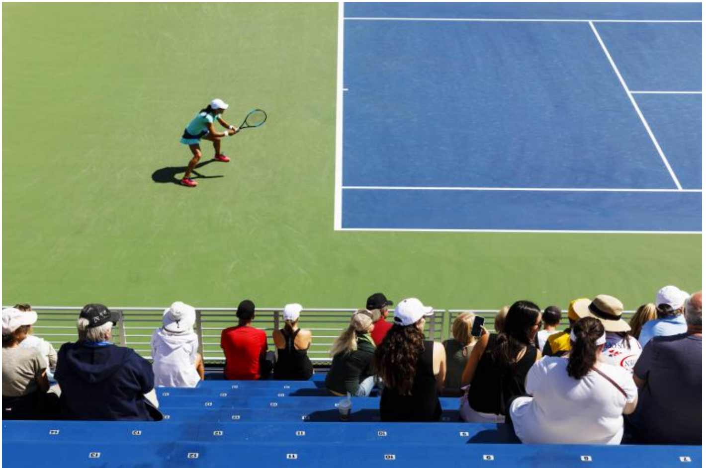
Martin Parr, Us open, New York, USA, 2017.

Stampo sempre la short list di circa 200 immagini su carta da 20/30 e poi la passo attentamente in rassegna e finisco con un'altra short list di poco più di 100 immagini. Da quel momento in poi, lavoro con l'editore, cercando di capire quali immagini vanno insieme e la loro sequenza, fino ad arrivare a circa 80 immagini.