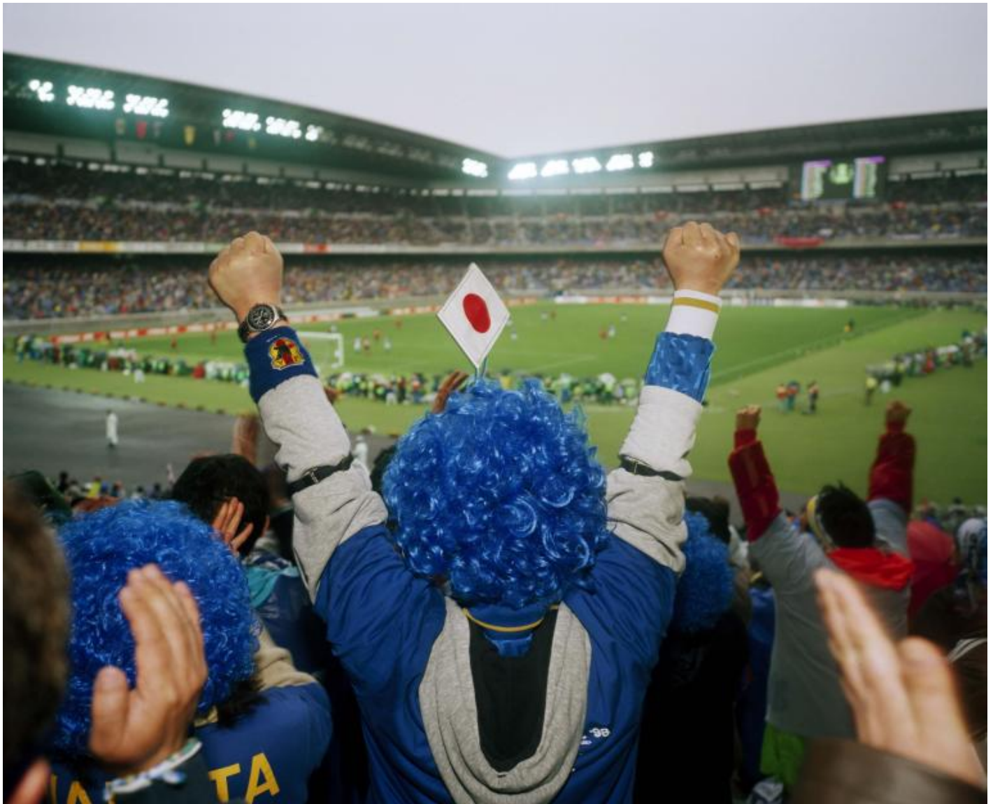
Martin Parr, Japan versus South Korea dynasty cup, Yokohama Stadium, Japan, 1998.

questioni universali. In occasione della mostra presso CAMERA –Centro Italiano per la Fotografia, abbiamo chiesto all'autore britannico di parlarci di alcuni temi e delle immagini che sono diventate icone del nostro tempo.