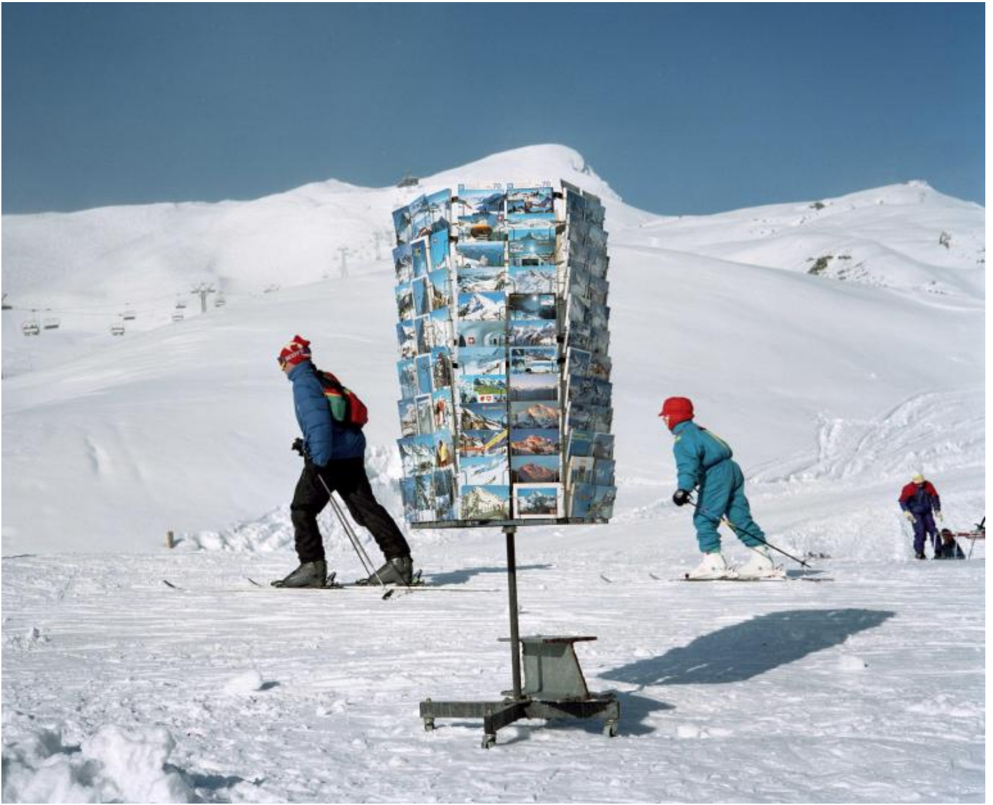
Martin Parr, Kleine Scheidegg, Switzerland, 1994.

Quanto è importante l'uso del flash anulare nel catturare un aspetto della tua ricerca?