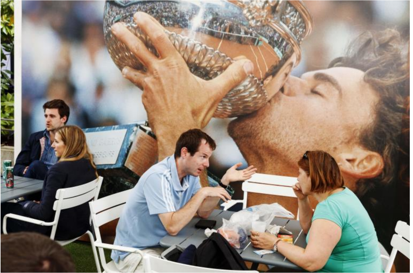
Martin Parr, Roland Garros, Paris, France, 2016.

Le priorità sono sempre mutevoli. Vent'anni fa nessuno parlava veramente del cambiamento climatico e ora è l'argomento numero uno. Penso che l'attenzione a questa causa sarà il grande punto all'ordine del giorno negli anni a venire.