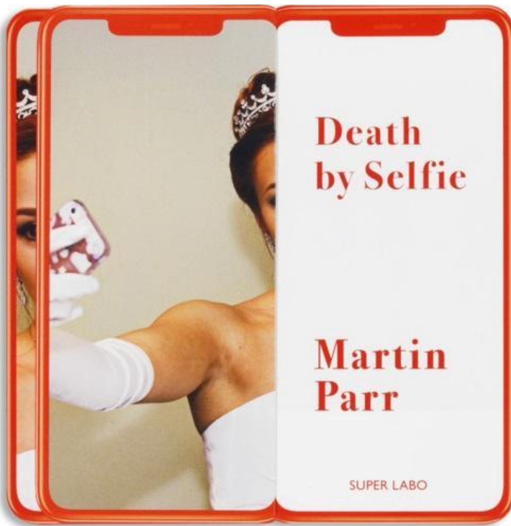
Martin Parr, Death by selfie super labo, 2019.

Eppure vuole comprendere la contraddizione che sta tra la mitizzazione di alcune porzioni del mondo e la realtà. Sente una responsabilità documentaria e combatte la propaganda, da cui siamo circondati, costantemente, su tutti i fronti, che si tratti di cibo, moda, viaggi, vita familiare o altro. L'idea delle riviste di viaggio è quella di vendere vacanze, quindi in esse tutto è bello e perfetto. Non mostreranno mai una scena in cui la gente viene assalita o dove un luogo pittoresco è preso d'assalto dalla massa, perché vogliono vendere sogni. Così pure fanno molte riviste e giornali asserviti ai poteri. Il suo lavoro è quello di mostrare il mondo come lo trova mentre gira per le strade, che ovviamente è molto diverso da quello della propaganda. Fa fotografie serie mascherate da intrattenimento.