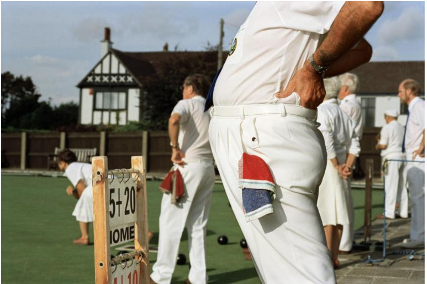
Martin Parr, Bristol England, 1995-99.

Cresciuto alla periferia del Surrey, da famiglia della classe media britannica, Parr è stato un collezionista fin dall'infanzia. Dagli 8 ai 12 anni aveva allestito un museo di storia naturale in cantina. Collezionava palline di uccelli rigurgitate dai rapaci. Oggi invece colleziona libri fotografici. Dopo che la sua collezione principale di libri fotografici è andata alla Tate, ha ricomprato tutti i titoli che aveva raccolto precedentemente. Secondo l'artista britannico anche la fotografia è un atto di collezionismo. Il retaggio collezionistico ha portato Parr a considerare anche le immagini come souvenir.