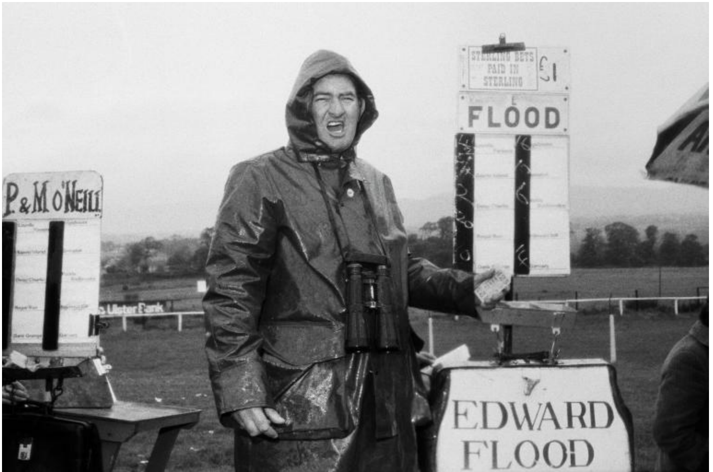
Martin Parr, Sligo races, Ireland, 1981.

Ho sempre sostenuto che definiamo chi siamo da ciò che facciamo nel nostro tempo libero. Il mio grande progetto di vita è il tempo libero del mondo occidentale, e il tennis e lo sport si aggiungono a questo.