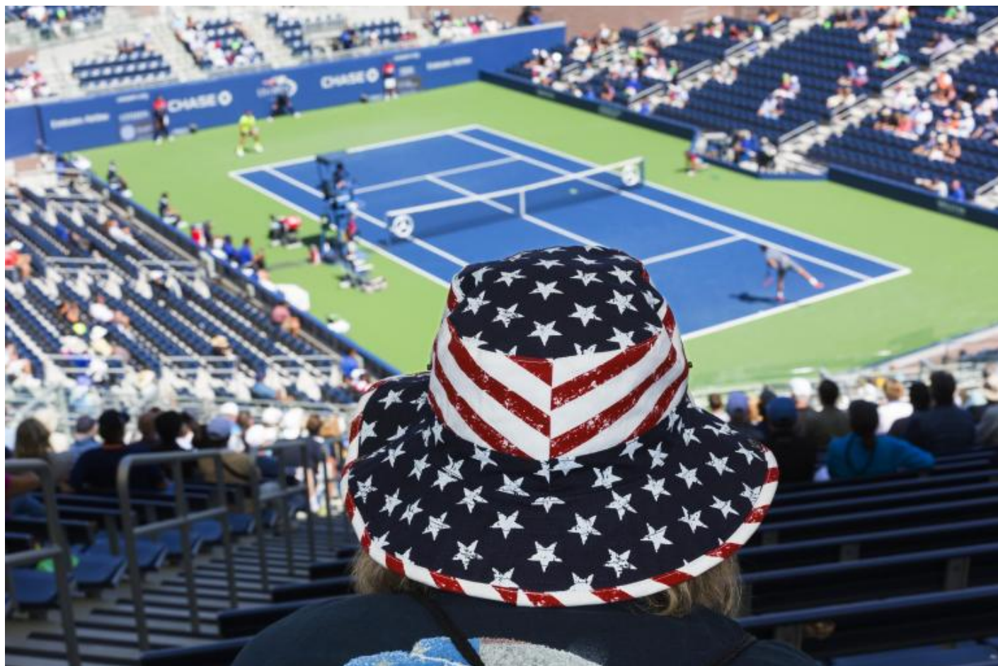
Martin Parr, Us open, New York, USA, 2017.

Come riesci a non lasciare che i tuoi critici ti chiudano in una categoria, in una definizione o in una ricerca unidirezionale? Come cerchi di uscire da ogni categorizzazione del tuo stile?