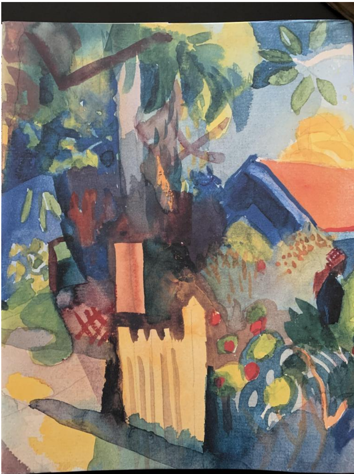
Copertina e cofanetto, retro: August Macke, Paesaggio con un albero chiaro, 1914, particolare. Berlino, Staatliche Museen zu Berlin, Kupferstichkabinett.