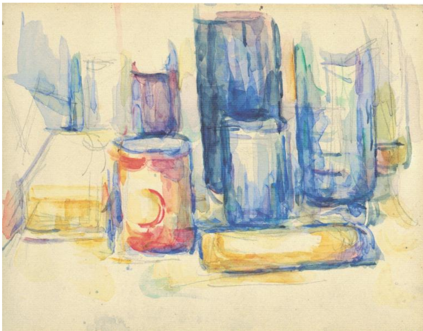
Paul Cézanne, Boccali e barattoli di vetro, 1902-1906, Parigi, Musée d'Orsay, conservato al Musée del Louvre (dono del barone Matsukata).