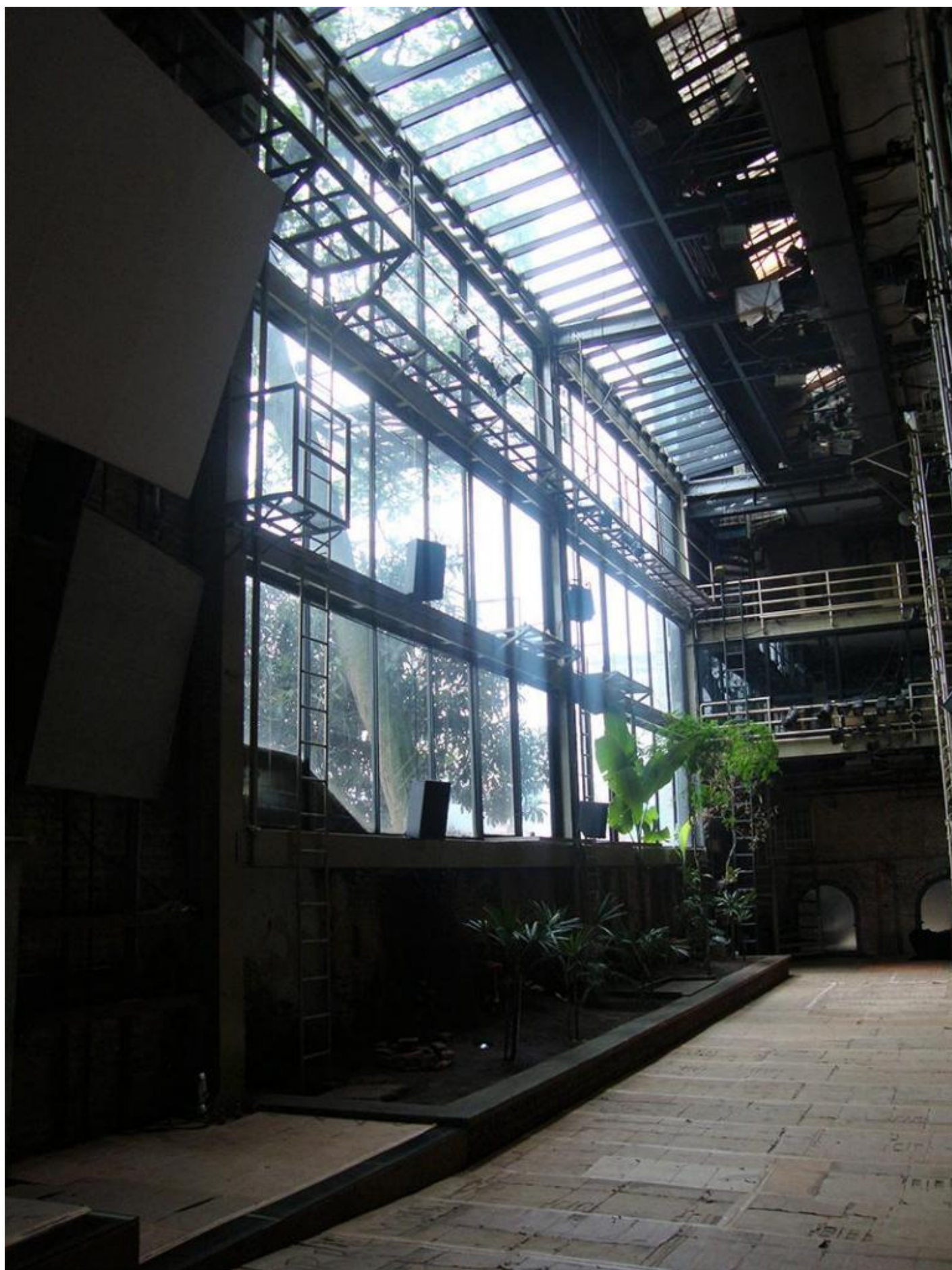
Teatro Oficina, Palco-rua (palco-strada) di Lina Bo Bardi ed Edson Elito.