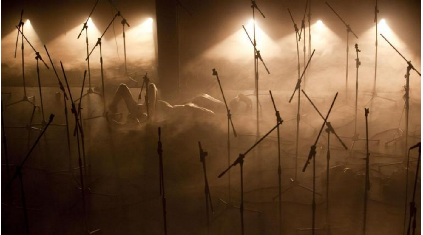
Tutto ciò che è grande nella tempesta, regia e scene di Andrea De Rosa, costumi di Fabio Sonnino, suono di Hubert Westkemper, luci di Pasquale Mari, Napoli, Sala Assoli, 2011.

Uno dei documenti più precisi, sottili, sofisticati e ironici che “illuminano” la questione sono cinque fotografie dell’allestimento della mostra di Constantin Brancusi alla Brummer Gallery di New York, numerate da Marcel Duchamp in controluce sul verso e associate alla frase Les 58 numéros flottent très facilement dans les 3 galleries . La frase (che troviamo in una lettera di Duchamp inviata a Brancusi il giorno successivo al vernissage) entra a pieno titolo nella costruzione dell’opera, che include una sottile ironia sul sistema dell’arte: i numeri sono quelli delle opere in catalogo. Ruotate specularmente in controluce per essere trasformate in numeri che fluttuano nell’aria (anche in questo caso la luce partecipa alla creazione di un’opera aeriforme), le sculture di Brancusi flottent nell’incavo tra recto e verso di un foglio fotografico, enigmatico spazio associato al respiro e all’esalazione di fumo, ai vapori e ai gas, uno spazio nel quale ora galleggiano anche le immagini, i testi, le voci e i rumori del nostro tempo.