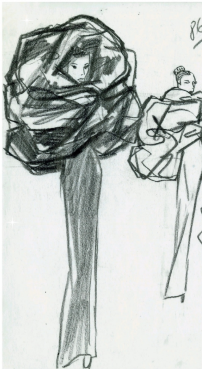
74. Cristóbal Balenciaga, bozzetti, inverno 1967.

La messa in discorso degli elementi distintivi di Balenciaga si intreccia con il tema del MET Gala “In America: A Lexicon of Fashion”, rappresentato da Gvasalia topicalizzando due pilastri della moda americana: la t-shirt e il divismo, magnificato dall’annullamento dei tratti caratterizzanti del volto, estremizzazione in pectore del mascheramento pandemico. Oltre a Kardashian, al MET Gala in Balenciaga c’era la cantante Rihanna che, invece, ha interpretato il corpo modello della maison grazie a una perfetta riscrittura di un capospalla del 1967, il cui bozzetto originale è riportato anche nel volume di Fabbri. I due corpi mediali dimostrano che si può portare avanti l’eredità stilistica riattualizzandola ? Rihanna ? oppure con una risemantizzazione estrema, che traccia una spaziatura e una differenza con il passato, che va nella direzione del cosa sarebbe accaduto se Balenciaga avesse vissuto nel presente .