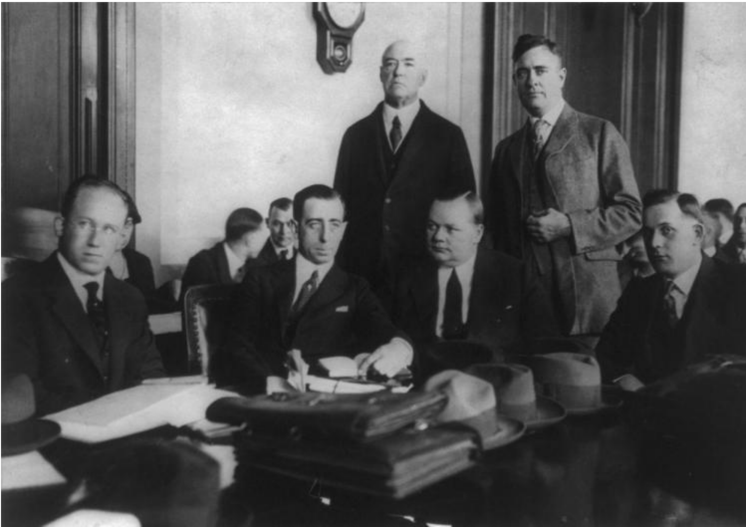
Roscoe Arbuckle (il terzo da sinistra, seduto) durante il processo

Arbuckle fu accusato di omicidio di primo grado. L'America profonda insorse. In un cinema dove si proiettava un suo film gli spettatori crivellarono di colpi lo schermo. A nulla valsero questa volta i tentativi dei dirigenti dello studio di corrompere il procuratore distrettuale che, comunque, non riuscì a farlo condannare nonostante tre processi segnati da testimonianze reticenti e confuse, da giurie che non riuscivano mai a raggiungere un verdetto unanime: alla fine "Fatty" fu assolto. L'unica consolazione per i puritani fu che Arbuckle non vide mai i tre milioni di dollari del contratto e che la Paramount mandò al macero i film non ancora in circolazione, esiliando dalla mecca del cinema l'ex comico, che morì alcolizzato a soli 46 anni.