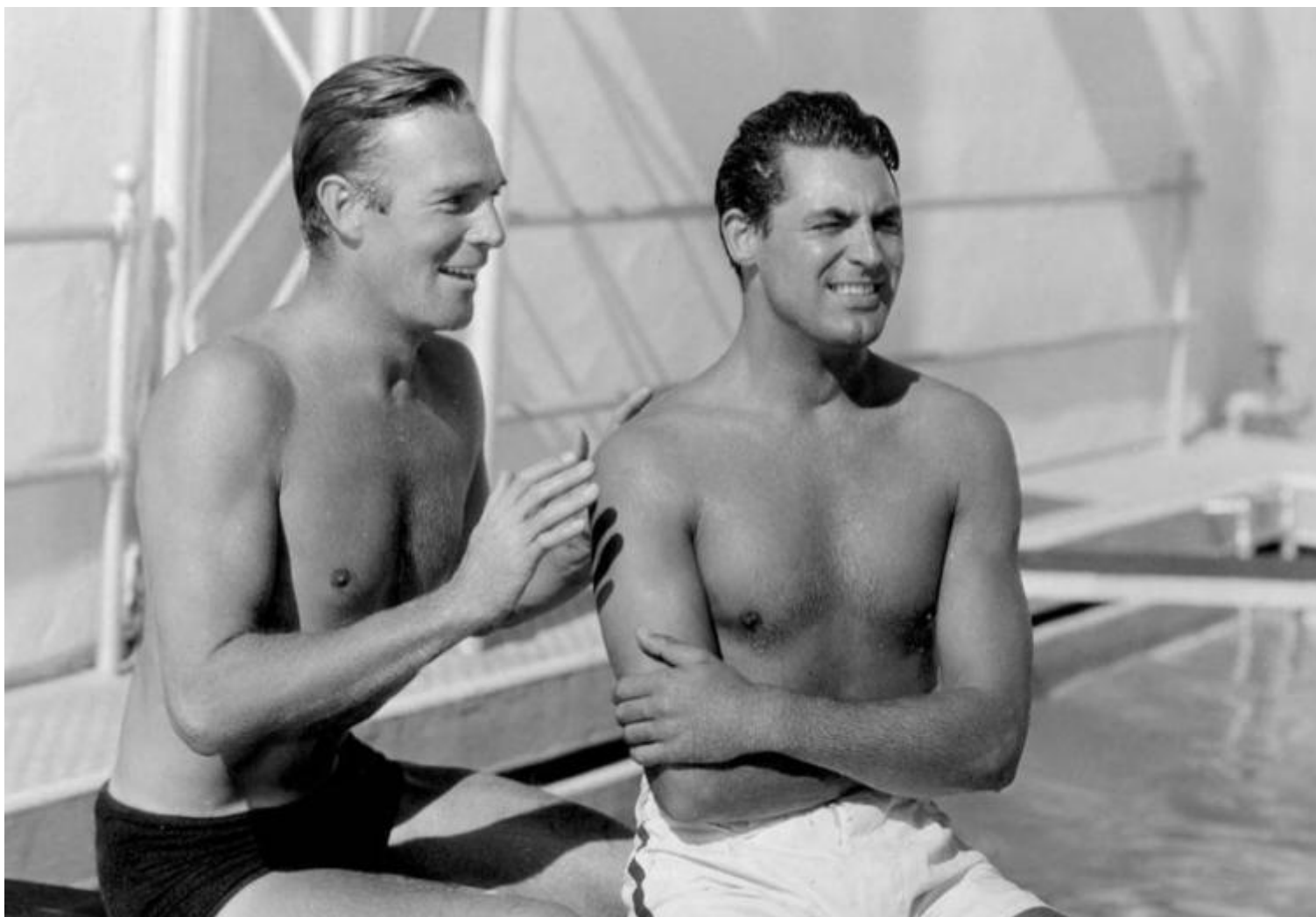
Cary Grant (a destra) con Randolph Scott