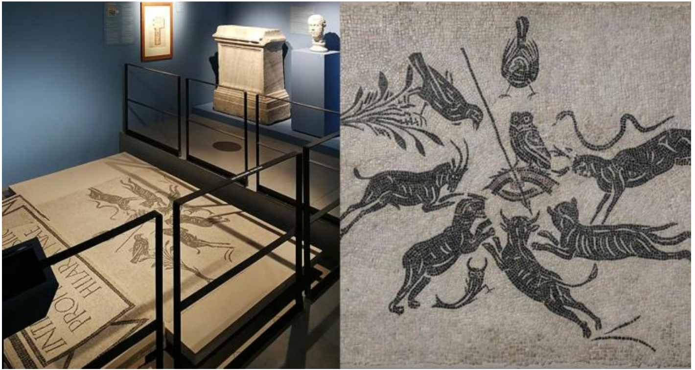
Veduta della sezione Gli spazi del sacro: la basilica Hilariana / Mosaico bianco nero con scena di malocchio. Metà del II sec. d.C. Roma, Musei Capitolini, Antiquarium, AC 4951.

Nella terza sezione Gli spazi del sacro: la basilica Hilariana , sede del collegio dei sacerdoti addetti al culto di Cibele e di Attis, è esposto un mosaico apotropaico raffigurante un occhio umano trafitto da una freccia, sul quale è appollaiata una civetta. Secondo gli studi condotti sul reperto, l'occhio trafitto da un dardo e circondato da una serie di animali sarebbe simbolo dell'invidia. Non è tuttavia chiaro se l'occhio abbia un rapporto anche con quello glaucopide di Atena, che vede nel buio (per questa ragione associata alla civetta) lanciando raggi visivi e luminosi rappresentati a guisa di dardi (Charles Mugler, Sur une polémique scientifique dans Aristophane , in Revue des Études Grecques , 1959). Albert Lejune, Euclide et Ptolome. Deux stades de l'optique geometrique grecque , Louvain, 1948, pp. 18-21 e 59). L'opacità di queste immagini costituisce la profondità stessa del simbolo, perché “il simbolo dà il suo senso in enigma ” (Paul Ricoeur, Il simbolo dà a pensare , Morcelliana, Brescia, 2002, p. 19). Il mosaico trovato all'ingresso della basilica Hilariana è un emblema posto al centro di un modo di pensare per immagini con valore simbolico, che spesso ricorrono nei contesti religiosi e funerari.