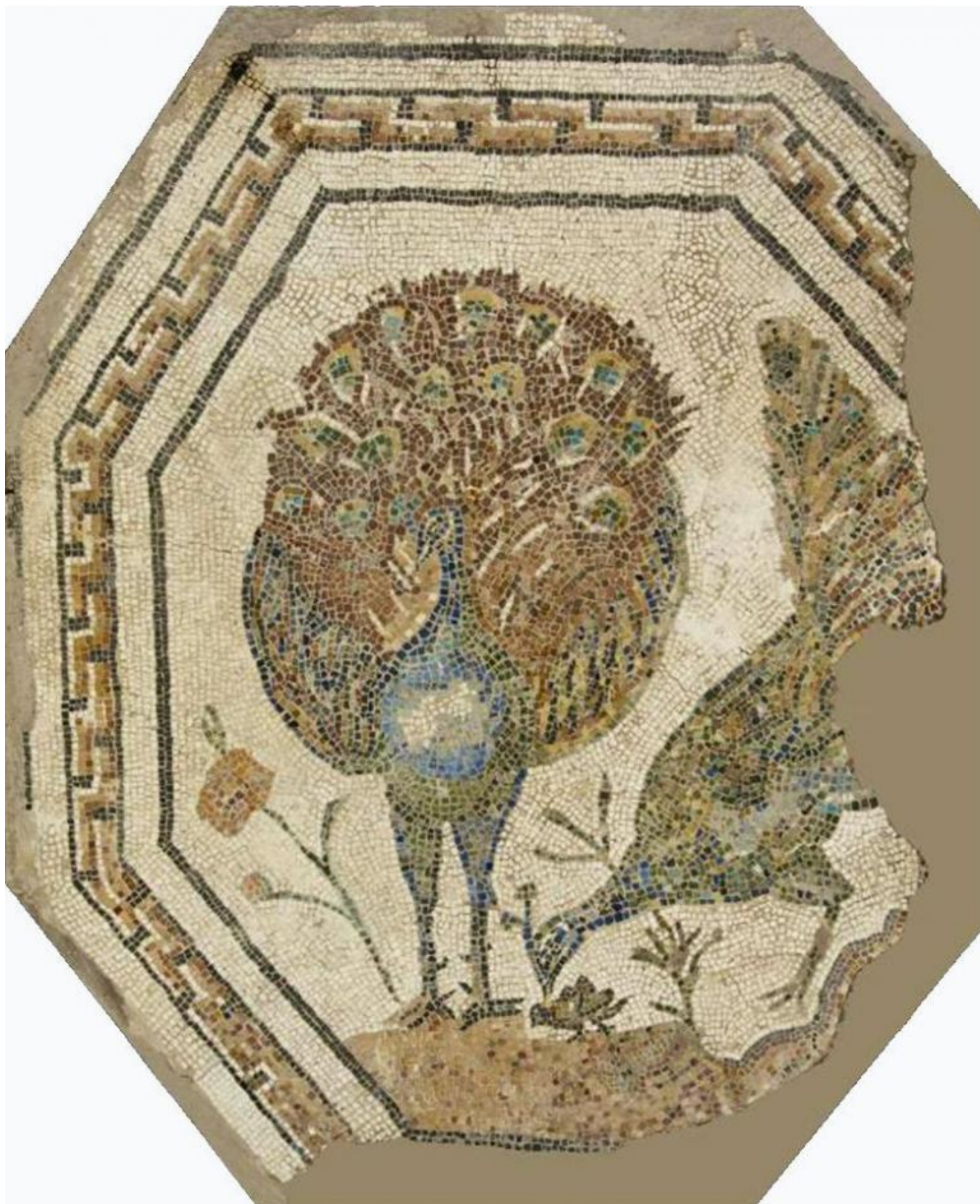
Mosaico policromo ottagonale con pavoni, proveniente da una tomba lungo la Via Appia. II secolo d.C. Roma, Musei Capitolini, Antiquarium, VM 60.