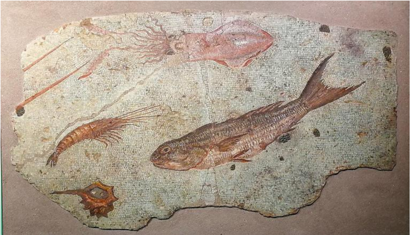
Mosaico policromo con fondale marino. Primo quarto del I secolo a.C. Roma, Musei Capitolini, Centrale Montemartini, AC 323559.

A differenza del mosaico della Casa del Poeta Tragico , qui non ci sono equivoci: l'immagine comunica anche a noi il fascino di ciò che appare d'un tratto e poi scompare: la natura breve e transitoria di un'esperienza, che Publio Ovidio Nasone associa alla bellezza: "La bellezza è un bene fragile" ( Ars Amatoria , II, 113). La caducità del bello ne aumenta il valore, annota Sigmund Freud nel resoconto di una passeggiata in compagnia di due amici, constatando che i due "avvertivano nel loro godimento del bello l'interferenza perturbatrice del pensiero della caducità" ( Caducità , in Opere. 1915-1917 , volume 8, OSF, Boringhieri 1989, pp. 173-176).