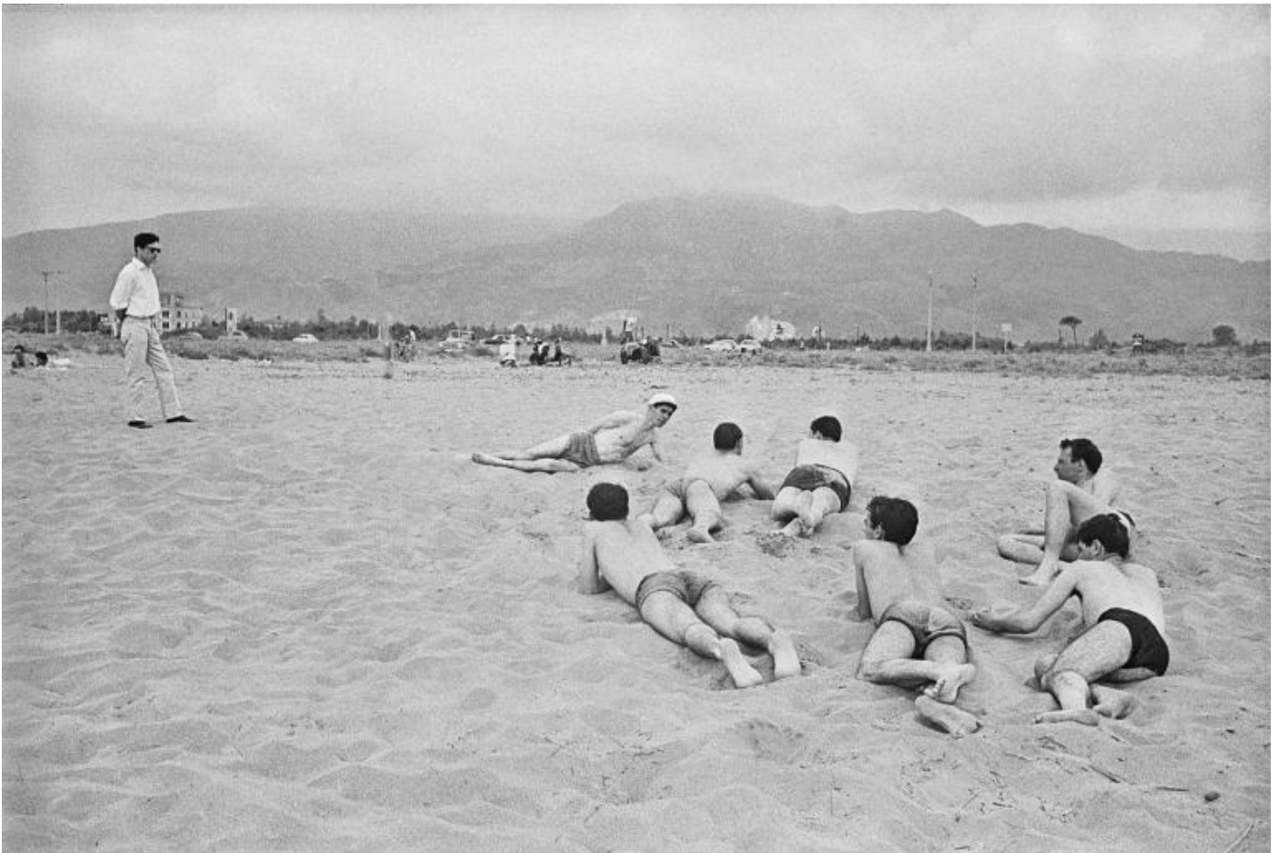
Pier Paolo Pasolini sulla spiaggia del Cinquale (Versilia), 1959

Laddove Di Paolo si sofferma con delicatezza sulla soglia, Pasolini irrompe con una scrittura “corsara” e velenosa. Alla descrizione lirica dei luoghi, alle sue sensazioni, alle emozioni, sin dalla prima puntata, si affianca la denuncia del degrado morale, prima che fisico, che descriverà negli scritti successivi: “Qui c’è la spiaggia del Cinquale. Un mare di memorie, alimentate soprattutto dal mio amico poeta Bertolucci, che viene a villeggiare qui, coi più squisiti dei letterati. Qui ci fu D’Annunzio. Qui tra il ’20 e il ’30 Huxley scrisse Foglie secche , e Thomas Mann – che faceva fare il bagno nudi ai figlioletti scandalizzando gli italiani – scrisse, indignato, Mario e il Mago . Da queste parti veniva anche Rilke (...). Ora cammino per la spiaggia del Cinquale, fra tutte queste memorie contro quel po’ po’ di sfondo dei monti della Versilia; e sapete che vedo? Una banda di giovinastri emiliani distesi a pancia in giù a guardare una tedesca, tutti un po’ grassi e spennacchiati, con uno che fa l’epilettico per buffoneria”.