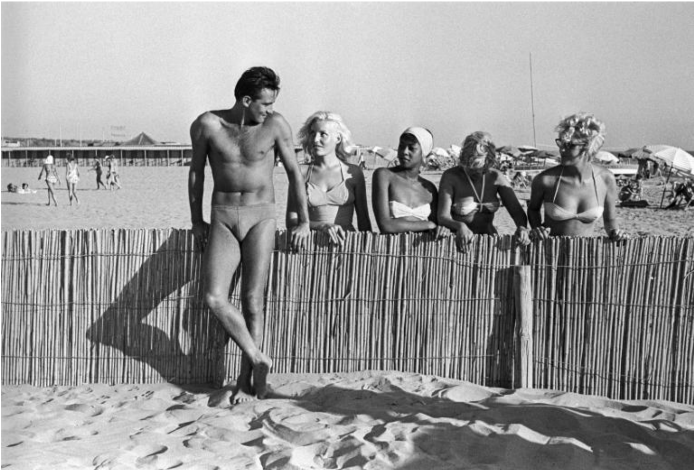
Walter Chiari a Fregene, 1959