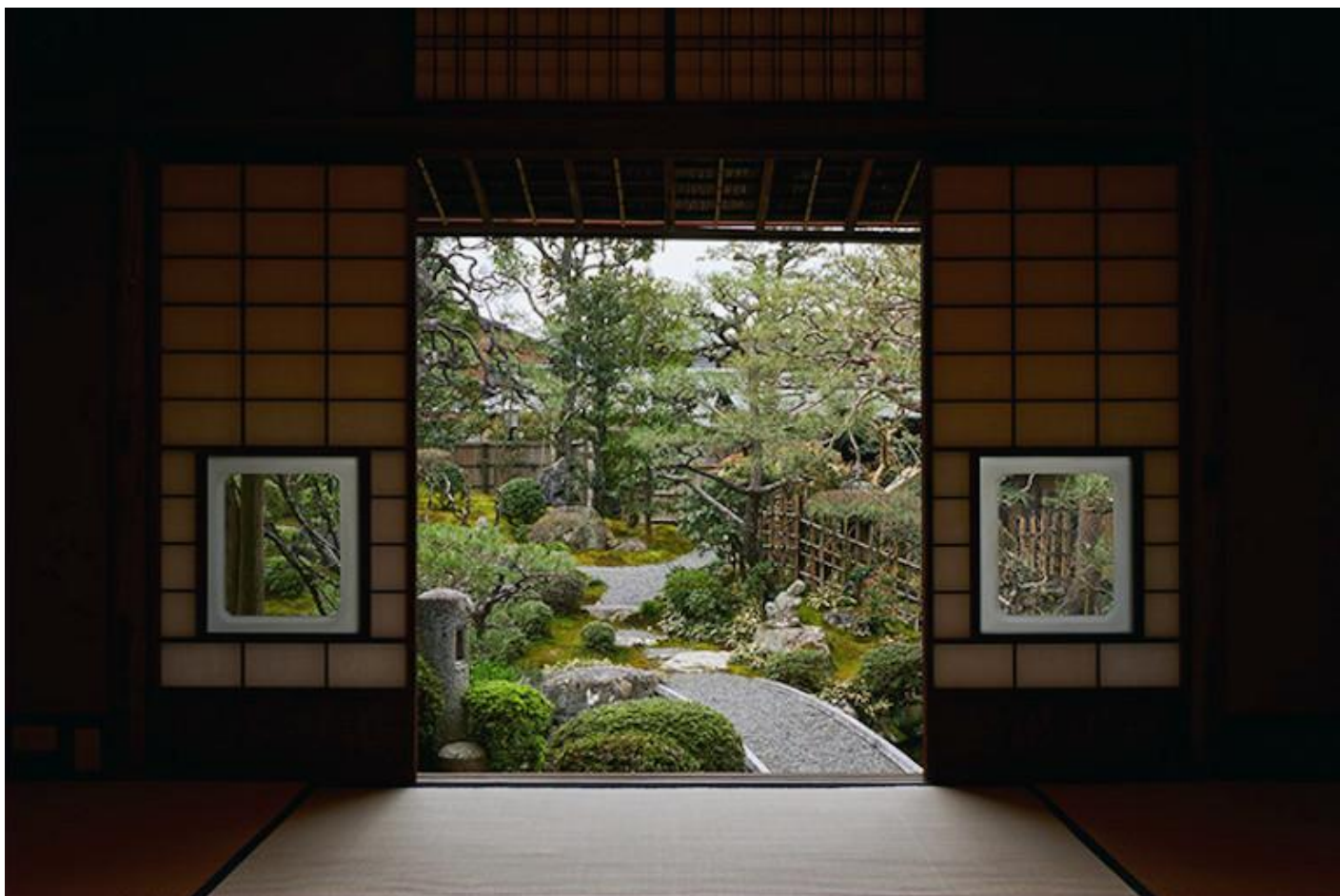
Una veduta del giardino della Sekison-tei, la casa in cui Tanizaki abitò dal 1949 al 1956.

Il corpo e la natura, e più in generale la meditazione sul passato, rimandano incessantemente per Tanizaki all'archetipo materno, dunque a un rapporto di fusione tra il bambino e la madre, che nel ricordo intreccia il piacere al rimpianto. Dopo una giovinezza influenzata soprattutto da modelli occidentali, il suo interesse per la cultura e le arti della tradizione crebbe a partire dagli anni '20, ed è spesso associato al trasferimento dal Kantō al Kansai, ma già in precedenza, non a caso, aveva trovato espressione in uno dei suoi racconti più evocativi basati su questo archetipo, scritto due anni dopo la morte della madre e poco prima di quella del padre. In Nostalgia della madre (1919) un bambino cammina nelle tenebre della notte tra filari di pini in uno scenario apparentemente sconfinato, seguendo i bagliori che intravede in lontananza, il rumore delle onde del mare e i suoni di voci e strumenti musicali che richiamano il Giappone di un tempo, come visioni di una fantasmagoria. E come in un altro racconto in cui Tanizaki reinventò la propria infanzia nella magnifica casa di Kyōto dove visse per alcuni anni dal 1949, Il ponte dei sogni (1959), due sono le figure femminili che incontra: dapprima una matrigna che scambia per sua madre, in una casa di contadini dal tetto ricoperto d'erba miscanthus , e lungo la strada, infine, la donna che stava cercando, dagli «occhi sottili come una inflorescenza di susuki », e che in un primo momento stenta a riconoscere.