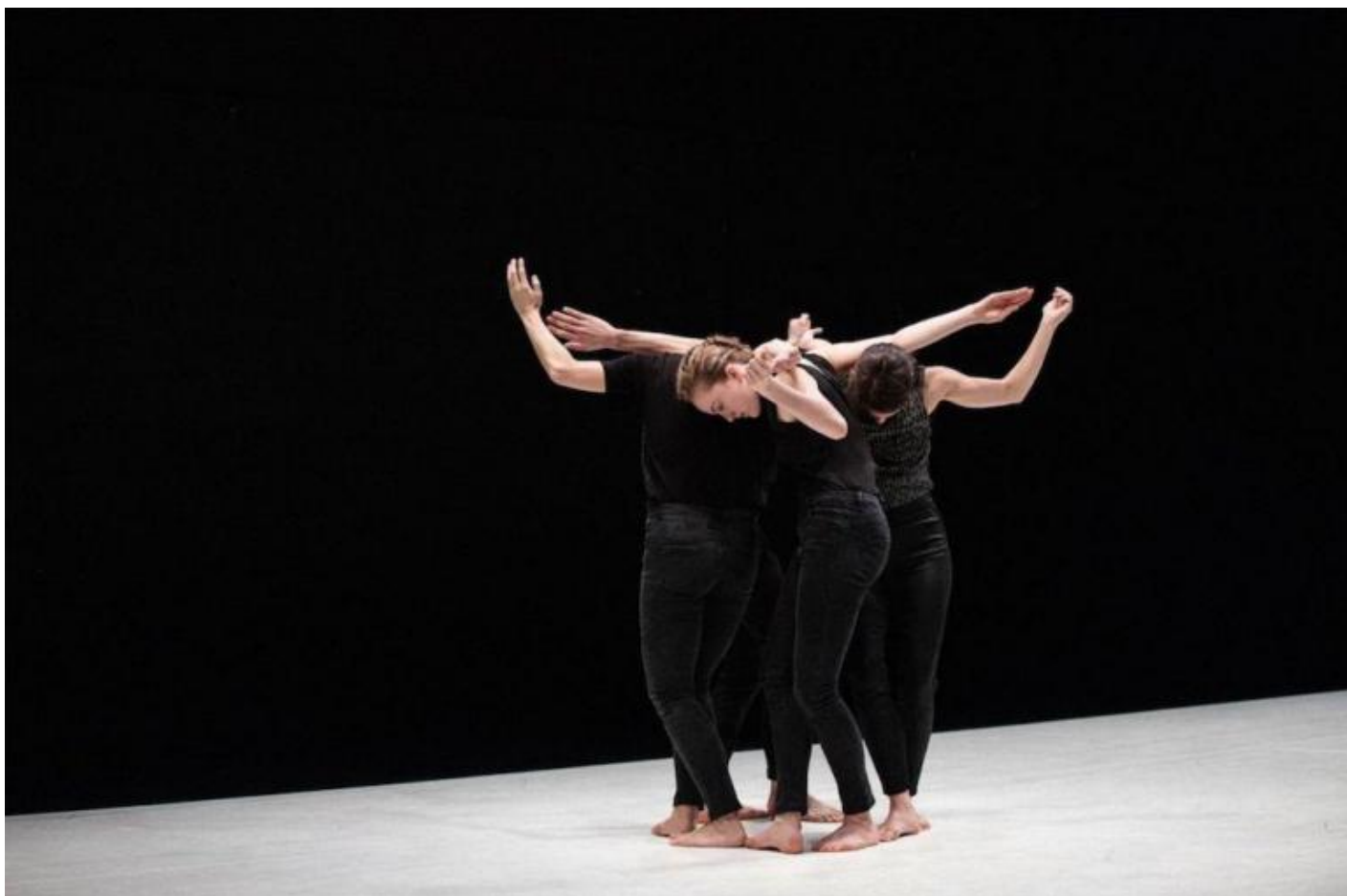
La Ronde / Quatuor, di Yasmine Hugonnet.