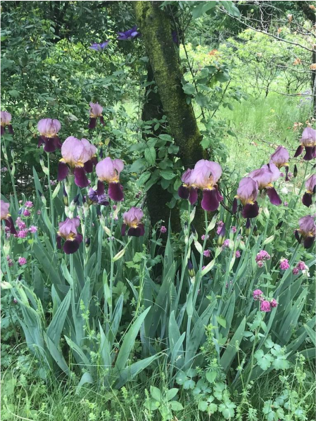
Abbozzo di dea