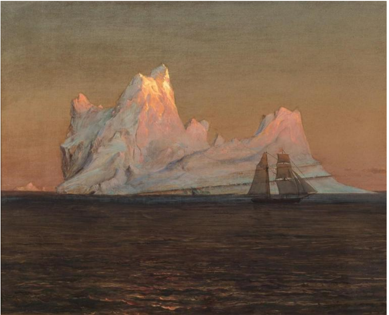
F. E. Church, The iceberg , 1875.

Come descrive bene Remaud, la vista fa difetto in un paesaggio monotono e monocromo, spesso senza ombre e poco sbalzato, in cui viene meno la capacità di misurare le distanze e la profondità, di ritagliare nettamente qualsiasi contorno, di isolarlo dall'insieme. Nei documentari solo la presenza di un elicottero, piccolo come un moscerino, dà vagamente l'idea dell'estensione del bianco paesaggio. Quello che sembra alto come un muretto è in realtà una scogliera. La vista fa difetto nel whiteout , dove la luce si riverbera nella neve, gli occhi bruciano al punto che il paesaggio si mostra solo filtrato dagli occhiali: il massimo della luce coincide non con il vertice della visibilità, secondo un'idea ancora modernista, ma con un danno alla retina o col rischio di cecità. In questa distesa senza limiti il nostro sguardo è disorientato e solo un cacciatore inuit sa trovare la strada. Un paesaggio simile al deserto, un "paesaggio che Milton o Dante potevano immaginare - minerale, desolato, misterioso" (p. 26), secondo il medico ed