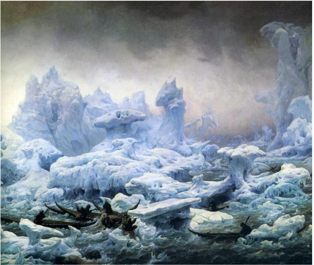
F. A. Biard, Vista dell'oceano glaciale, 1841.