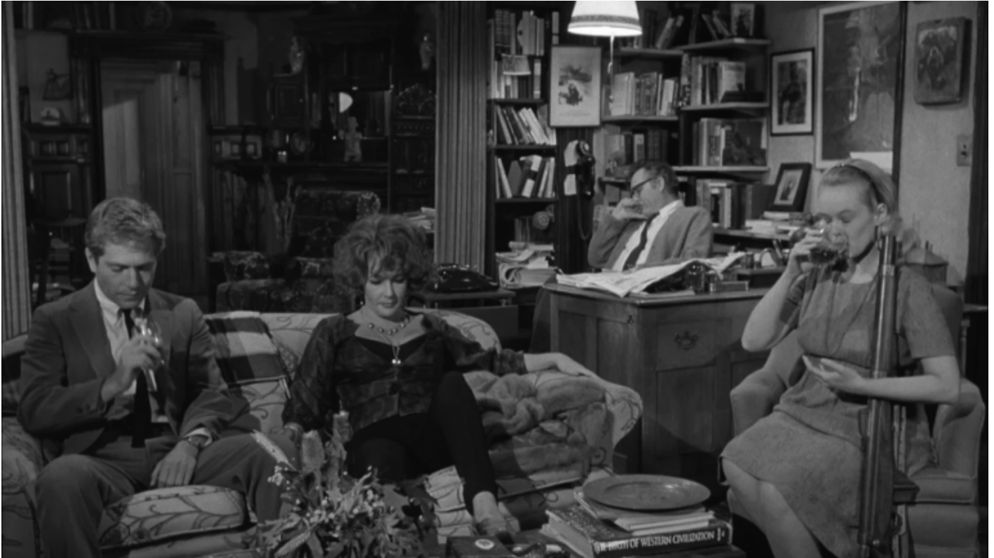
Mike Nichols, “Chi ha paura di Virginia Woolf?” (1966).

Guardando il film si ripensa al film più direttamente evocato da Malcolm & Marie , vale a dire Chi ha paura di Virginia Woolf?