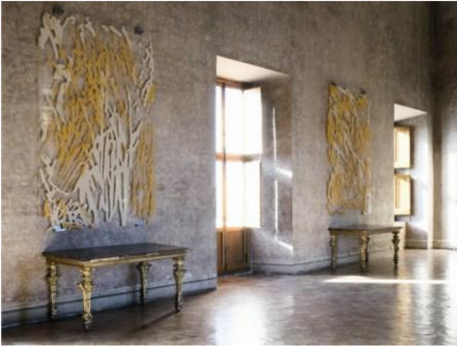
Jean-Marc Bustamante, Peintures , 2012. Ink on plexiglas, 145 x 185 x 4 cm.

personalmente da lui con una speciale tecnica in cui i pigmenti naturali erano portati direttamente sul muro. Se si usa il plexiglas come faccio io, lo sfondo assume una grande importanza. E così ho realizzato quattro dipinti monumentali per il Grand Salon, che mi sembravano una buona aggiunta alla sequenza di Saenredam.