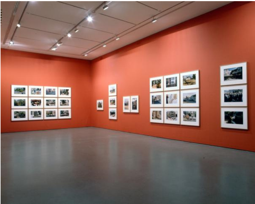
Jean-Marc Bustamante, Something is Missing , 1999. Veduta della mostra alla Tate Modern, Londra.

J.-M.B.: A volte è una cosa che ti aiuta, sapere di essersi persi e dover continuare diventa un modo di confrontarsi con se stessi e con lo schermo della realtà. Il soggetto non è poi così importante, puoi essere a Roma, a Buenos Aires, a Miami, a Tel Aviv, ma tu sei sempre la stessa persona, la questione è sentire il desiderio da decifrare. Bisogna essere più forti del proprio soggetto, a un certo punto decidere qualcosa, fare una fotografia, e non si tratta di fotografare qualcosa di interessante nel senso del pittoresco o dell'insolito, ma qualcosa di essenziale. Quando si trova il giusto equilibrio, quando la scena ti affascina per niente, perché c'è qualcosa che manca, riveli un frammento di mondo che tocca, che abbaglia, e questo perché alla ricerca di qualcosa il desiderio è lì quando qualcosa manca. La prima volta ho esposto questa serie alla Tate di Londra, ho deciso di dipingere i muri di rosso, e di allestire le foto in gruppi di due, quattro, sei, dodici, senza fare menzione dei luoghi. Era come un diario privato senza nomi, senza storie, ogni fotografia rispondeva alle altre, come un mondo melanconico senza qualità.