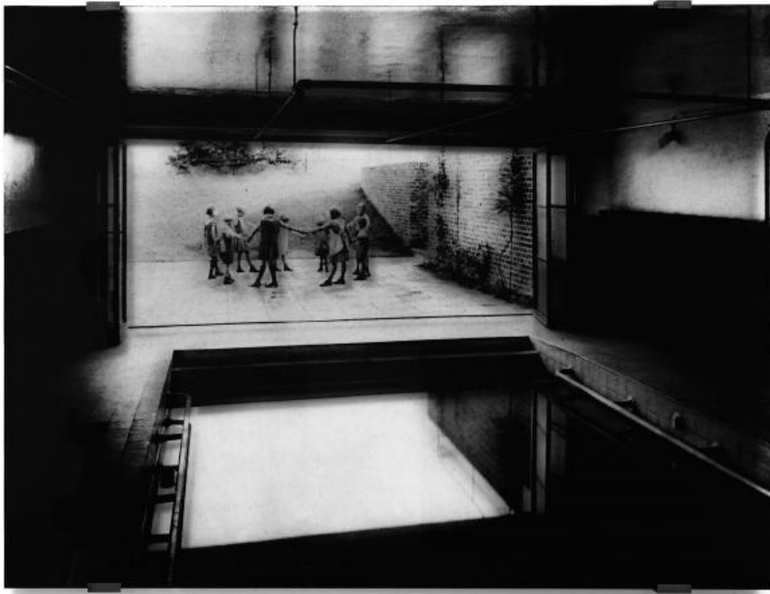
Jean-Marc Bustamante, Lumière 6.91 , 1991. Inchiostro su plexiglas, 145 x 18 5x 4 cm.

che lei considera come sculture, o meglio dove il suo lavoro è incentrato sul dialogo fra le due e le tre dimensioni. Questo esplicito gioco continuo mi sembra qualcosa che fa funzionare mente e occhi in maniera differente.