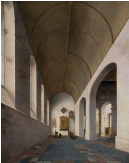
Pieter Jansz Saenredam, La cappella di Sant'Antonio nella chiesa di San Giovanni a Utrecht , 1645. Olio su tavola, 41,7 x 34 cm. Collectie Centraal Museum, Utrecht.