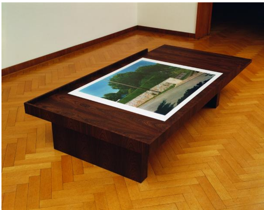
Jean-Marc Bustamante, Ouverture I , 1993. Legno, C-print, 43 x 210 x 182 cm.

Ma c'è una cosa che lega tutti questi media e produzioni, ed è la fotografia. Quando faccio un dipinto, è un dipinto che viene dalla fotografia, che ha le sue radici nella fotografia. Sarebbe stato impossibile concepire i miei dipinti senza la fotografia. E quando dico fotografia, intendo il fotografico, la specificità della fotografia.