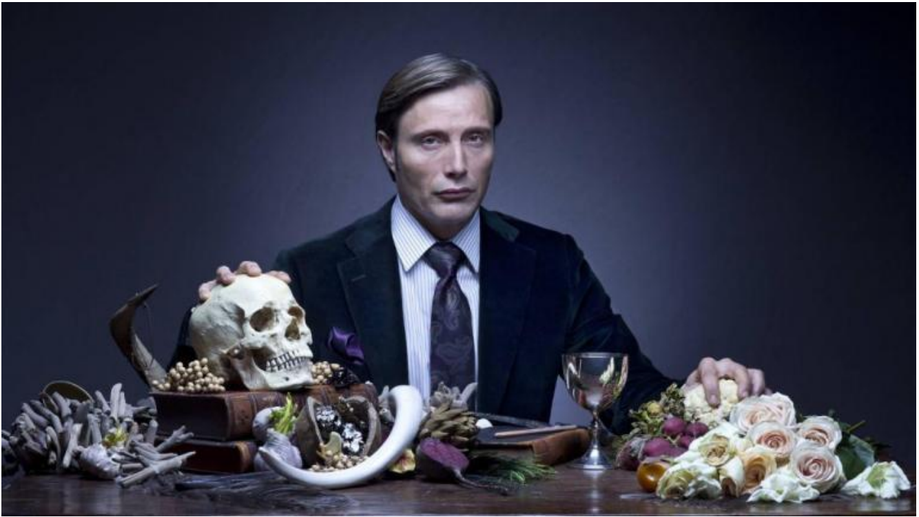
Mads Mikkelsen, "Hannibal".

La sublimazione ce l'abbiamo - ed è il quarto esempio - con la già citata Hannibal (2013-2015), che anche in virtù del carisma del protagonista (un eccezionale Mads Mikkelsen nel ruolo del titolo) eleva definitivamente la figura del dott. Lecter a icona culturale e di stile del nostro tempo. Vediamo lo psichiatra, sempre elegantissimo e di gusto dandistico quasi sovrumano, profondersi con infinita creatività e senza mai fare una piega nella sua doppia occupazione preferita: eliminare coloro che lo tediano, o che abbrutiscono il mondo; e servirli fastosamente a tavola dopo averli trasformati in prelibate e fantasiose pietanze. Ogni puntata delle prime due stagioni e mezzo si intitola come un piatto. E tale è la sua grazia sardonica che lo spettatore finisce quasi inevitabilmente per parteggiare per il serial killer cannibale.