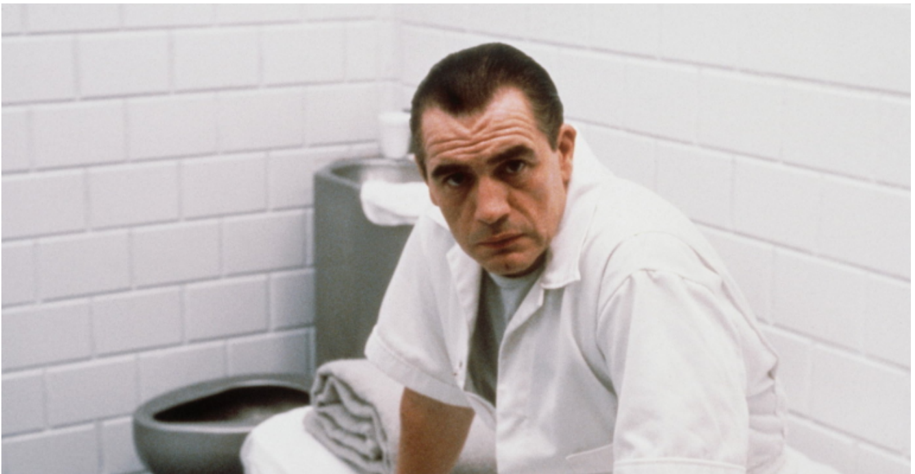
Brian Cox in " Manhunter ".

Manhunter è tratto dal romanzo di Thomas Harris Red Dragon , e costituisce una sorta di antefatto de Il silenzio degli innocenti . Segna l'esordio, tanto sulla pagina scritta quanto sullo schermo, del personaggio di Hannibal Lecter (qui ribattezzato "Lecktor" e interpretato da Brian Cox), che incontriamo già dietro le sbarre. Dove è finito dopo essere stato catturato dal profiler dell'FBI Will Graham, uscito profondamente segnato dall'incontro ravvicinato con lo psichiatra cannibale. È il navigato Graham (un ottimo William Petersen, mai più così in parte) a interpellarlo, come poi farà Clarice nel successivo Silence of the Lambs . Per la prima volta in modo così esplicito, un detective dà la caccia a un serial killer provando a entrare nella sua testa, immedesimandosi con le sue fantasie, accettando di mettere a repentaglio la propria identità e stabilità.