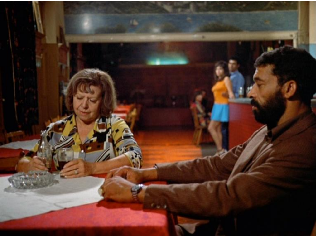
La paura mangia l'anima (1974).

Fece uno sforzo incredibile a non dimenticare mai le esigenze del grande pubblico, adeguandosi alla forza della tradizione hollywoodiana ispirandosi al cinema di Douglas Sirk e ai suoi melodrammi familiari degli anni Cinquanta. Il cineasta tedesco-americano si era specializzato in tragedie personali: amori non corrisposti, disillusioni, confidenze mal riposte, attese dolorose inscritte negli ambienti della piccola borghesia e della classe media. Fassbinder ne era completamente affascinato. Sirk mostrava gli eccessi nella sfera privata senza mai trascurare la rilevanza politica delle tematiche affrontate. Lo faceva in una maniera così trasparente da rendere lo spettatore completamente consapevole di alcune dinamiche messe in scena, facendogli capire come le situazioni difficili potessero essere superate prendendo le proprie decisioni.