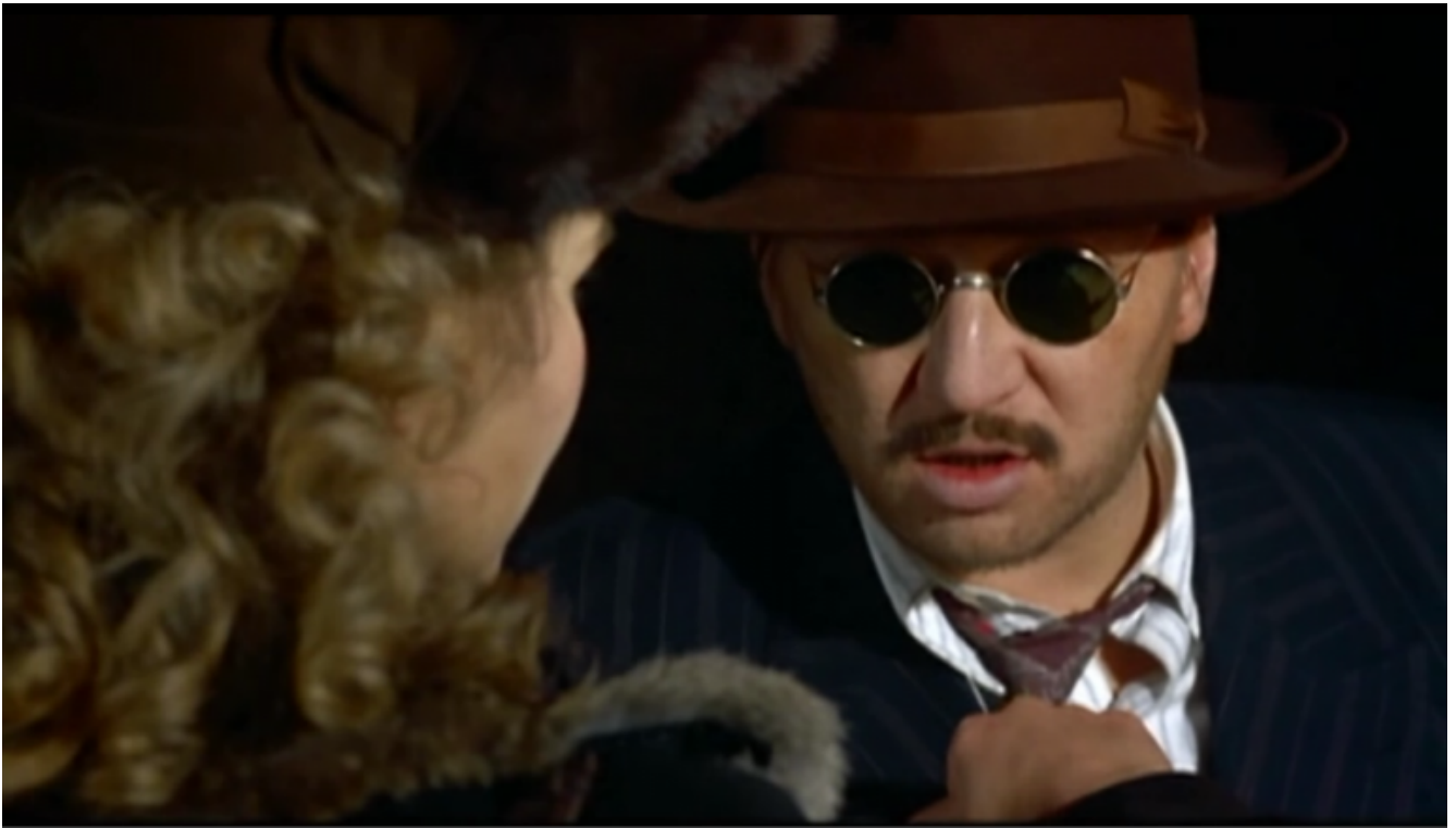
Cameo di Fassbinder in "Il matrimonio di Maria Braun" (1979)

In Il viaggio a Niklashausen (Die Niklashauser Fart, 1970) ritroviamo una sequenza in cui tre donne nel mezzo di una discarica fumante pronunciano il terrificante discorso estratto dalla Pentesilea di Kleist, conferendo al film un'affascinante aura oscura. E ancora, in Die Ehe der Maria Braun (Il Matrimonio di Maria Braun, 1979) , è proprio il regista ad interpretare in un cameo la parte del borsista nero che propone l'acquisto dell'opera omnia dell'autore tedesco a Maria (Hanna Schygulla). «I libri bruciano in fretta e non riscaldano» risponderà la protagonista, rifiutando l'acquisto dei volumi.