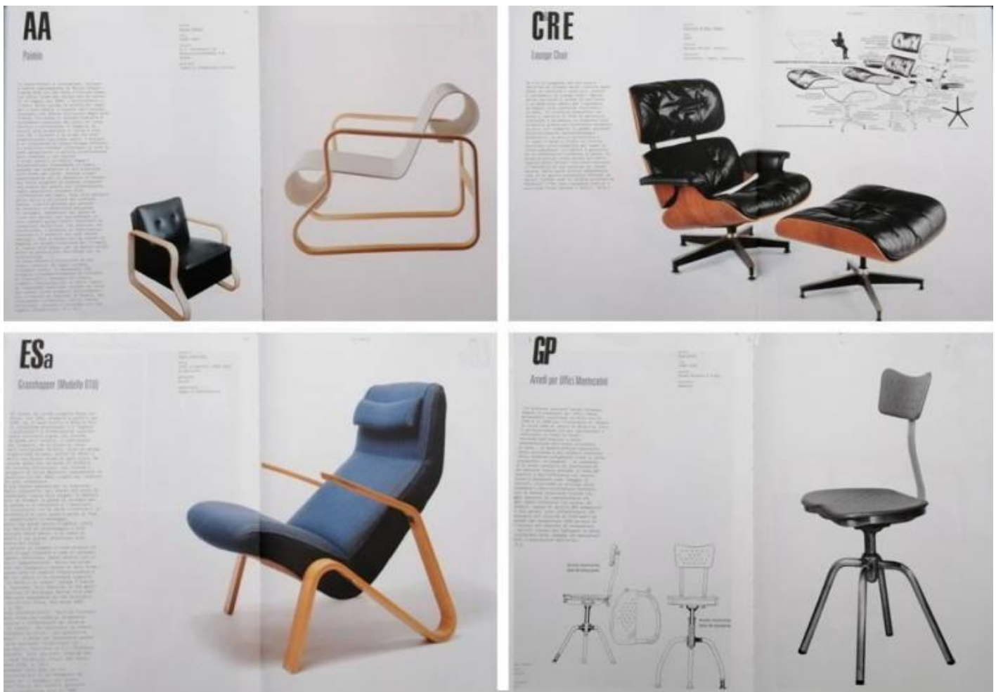
Alcune pagine del Big Book of Design , in alto: Paimio (1929 – 1933) di Alvar Aalto per Artek; Longue Chair (1957) di Charles e Ray Eames per Herman Miller (Vitra). In basso: Grasshopper (1943 – 1946) di Eero Saarinen per Knoll; Arredi per uffici Montecatini (1935 – 1938) di Gio Ponti per Parma Antonio & Figli.

C'è da dire che il Big book of Design è un libro piuttosto complesso da definire, in quanto è al tempo stesso saggio, manuale, atlante, agile raccolta di schede di quasi un centinaio di oggetti iconici, ma anche antologia di racconti autografi dei 25 maestri di cui ha scelto di occuparsi, comunicati attraverso interviste o dichiarazioni di poetica. Questa sua polivalenza ne declina quindi la destinazione tanto agli addetti ai lavori, quanto agli studenti di design, così come ai semplici curiosi e agli appassionati della disciplina. La sua raffinata eleganza grafica, poi, fa di esso un oggetto da collezione.