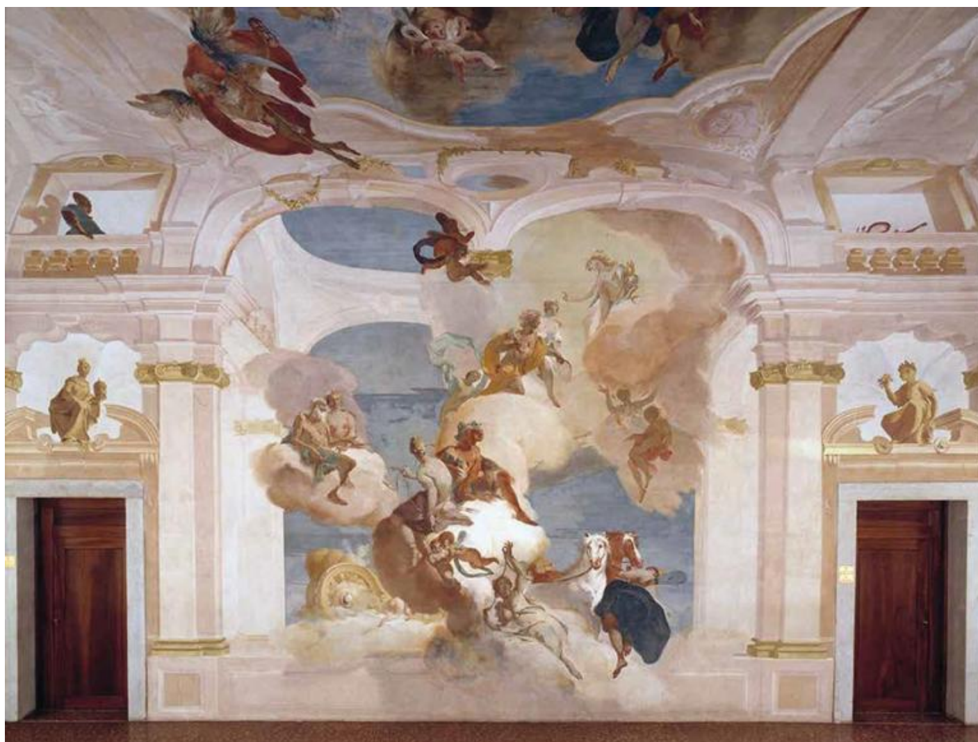
Giambattista Tiepolo (con la collaborazione di Girolamo Mengozzi Colonna), Mito di Fetonte, 1719. Massanzago (Padova), villa Baglioni.

La pandemia ha interrotto anche le visite alla mostra Tiepolo. Venezia, Milano, l'Europa , promossa dal Progetto Cultura della Banca Intesa (Gallerie d'Italia - Piazza Scala, Milano, dal 30 ottobre 2020 al 21 marzo 2021). Curata da Fernando Mazzocca e Alessandro Morandotti, la mostra accosta le opere di Tiepolo a quelle di altri artisti che lo hanno influenzato e che a sua volta egli ha influenzato. L'esposizione include una serie di opere restaurate per l'occasione, tra le quali alcune che sono normalmente poco o per nulla accessibili al pubblico: gli affreschi della basilica di Sant'Ambrogio e quello eseguito per Palazzo Gallarati Scotti. Al momento la mostra vive online a causa delle misure di contenimento dell'emergenza epidemiologica da COVID – 19. Un'applicazione ci consente di visitare virtualmente la mostra e un'altra esplora otto opere realizzate dall'artista. In entrambi i casi stiamo guardando delle riproduzioni esplorate da un software, non le opere di Tiepolo, per vedere le quali dobbiamo attendere la riapertura della mostra milanese, la prima che Milano dedica all'artista, e il ripristino delle visite guidate a Palazzo Clerici, Palazzo Isimbardi e Palazzo Dugnani, dove si possono ammirare in loco gli scorci dipinti da Tiepolo, perfettamente coniugati alla prospettiva cromatica.