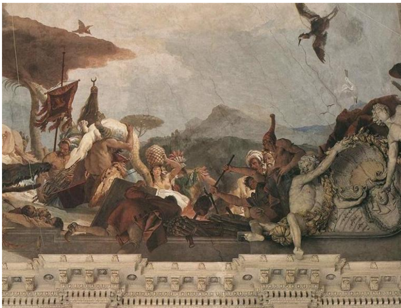
Giambattista Tiepolo, Apollo illumina e vivifica i quattro continenti, allegoria dell'America, particolare, 1753. Würzburg, Residenz.

Un pittore spia dei cannibali che arrostitiscono delle teste umane. Un macaco strappa le piume a uno struzzo. Caimani, cammelli e una varietà di soggetti bizzarri si arrampicano, transitano o sostano sul cornicione del soffitto dello scalone monumentale della Würzburger Residenz. Lungo questa cornice Giambattista Tiepolo mette in scena la rappresentazione allegorica dei quattro continenti allora conosciuti.