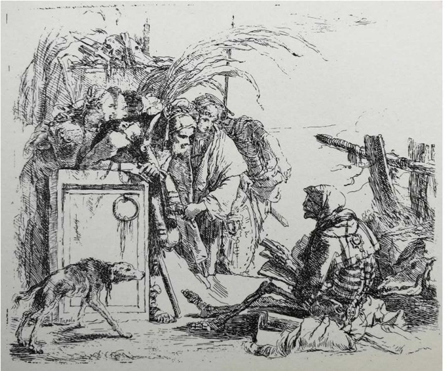
Giambattista Tiepolo, Capricci , tavola X, anteriore al 1743, anno in cui apparve nella prima Raccolta zanettiana. Venezia, Gabinetto Disegni e Stampe del Museo Correr.

della piramide visiva, guidando lo sguardo verso un perdimento della tinta nella luce, verso un fondo che non ha tempo, che non ha storia, verso una luce dell'inizio o della fine, o della fine all'inizio.