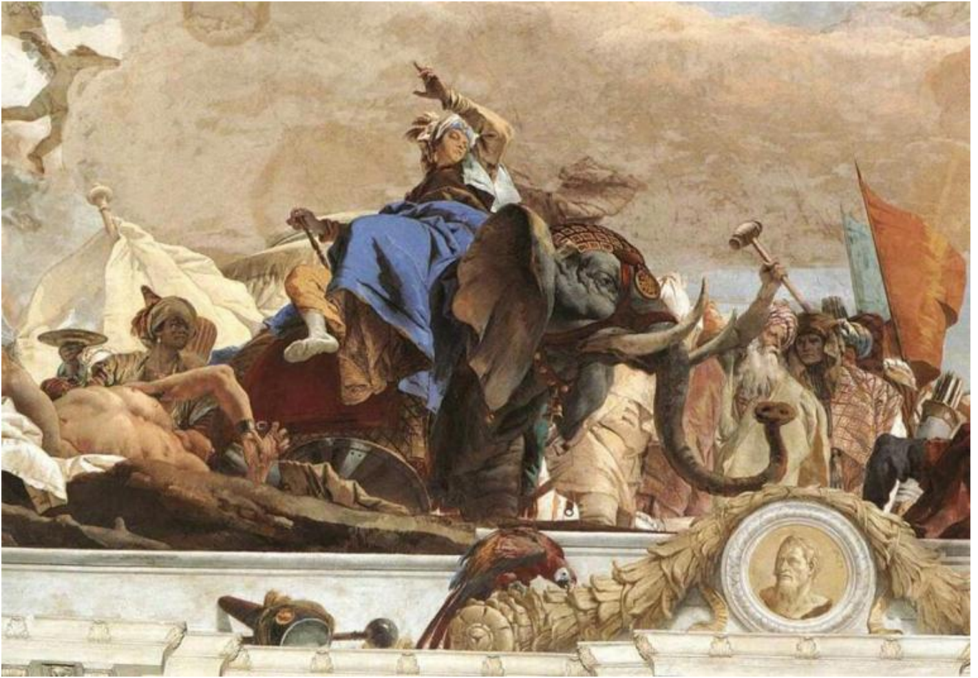
Giambattista Tiepolo, Apollo illumina e vivifica i quattro continenti, allegoria dell'Asia, particolare, 1753. Würzburg, Residenz.

Lo scorcio dialoga con la prospettiva lineare e con quella cromatica creando uno spazio in cui ciò che è razionale e ciò che non lo è convivono perfettamente. Anche nella pittura di Antonio Canal detto il Canaletto, contemporaneo e conterraneo di Tiepolo, il rigore ottico della prospettiva lineare dialoga con un timbro atmosferico, ma senza i capricci dello scorcio tiepolesco che, combinandosi al perdimento della tinta e della sua purezza, rappresenta ciò che si allontana, che va verso il fondo, dove le cose si perdono.