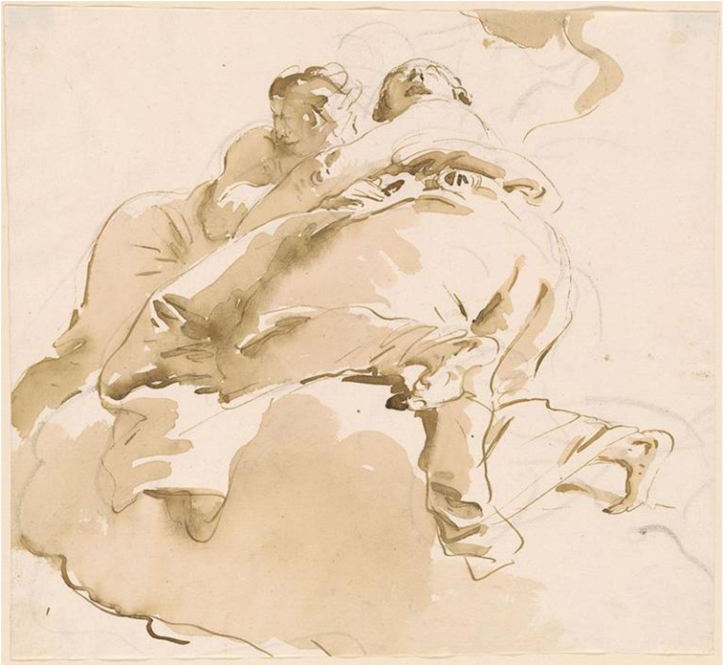
Giambattista Tiepolo, Due figure femminili sulle nuvole. Una inginocchiata che guarda verso l'alto. Album of Drawings by Giovanni Battista Tiepolo. New York, Collezione Pierpont Morgan Library, Dipartimento Disegni e Stampe.

cromatica e con la capricciosa bizzarria degli scorci, pronipoti degli antichi catagrapha usati per rappresentare le figure e i volti “in vari atteggiamenti, nell’atto cioè di guardare indietro, in alto, in basso” (Gaio Plinio Secondo, Storia Naturale , XXXV, 56).