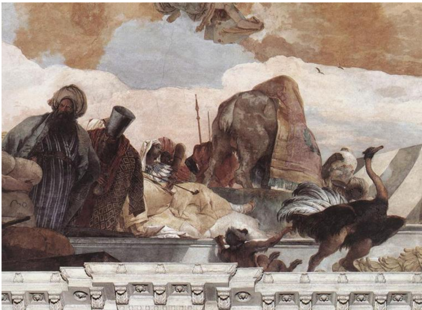
Giambattista Tiepolo, Apollo illumina e vivifica i quattro continenti, allegoria dell'Africa, particolare, 1753. Würzburg, Residenz.

Nelle decorazioni che Tiepolo affresca, insieme a figli e aiuti, per residenze pubbliche e private, il soffitto è un palcoscenico, scrive Giorgio Manganelli in un articolo pubblicato da L'Espresso il 26 settembre 1971. La pittura di Tiepolo eredita da Paolo Caliari detto il Veronese la dimensione architettonica e una sensibilità per la luce e il colore che è tipica della pittura veneta.