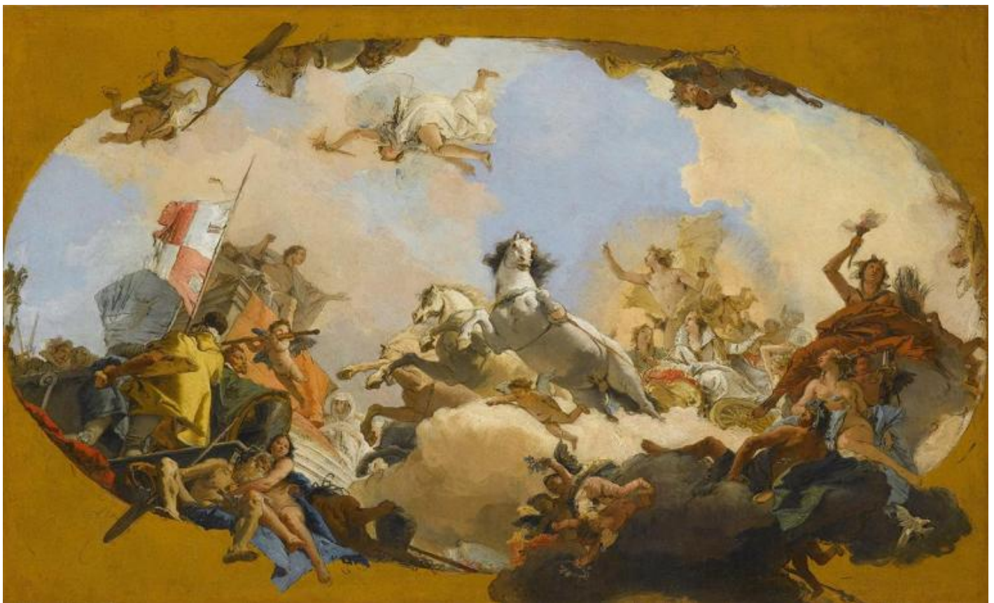
Giambattista Tiepolo, Apollo conduce Beatrice di Borgogna al Genio dell'Impero, particolare, 1751. Stoccarda, Staatsgalerie Stuttgart. Bozzetto per l'allegoria dipinta sul soffitto della sala da pranzo o Kaisersaal della Residenza di Würzburg.

Anche lo spettatore gira con il naso all'insù. L'affresco di Würzburg, come molti altri, va infatti visto muovendosi seguendo il variare, per intensità e direzione, della luce naturale, con la quale il colore dipinto interagisce generando a sua volta una luce nuova, diversa. Tiepolo stinge i colori, che si perdono in lontananza, ma non raffredda le tinte: non finge esattamente ciò che l'occhio vede. Ciò che Tiepolo rappresenta non è propriamente quello che appare: non è detto che l'apparenza sia il modo in cui la realtà si dà a vedere, anzi potrebbe essere il modo in cui si nasconde. La sua pittura rivela l'esistenza di una luce inapparente e gloriosa, intesa dai suoi mecenati in chiave allegorica. È il know-how dell'artista veneziano, che riceve importanti committenze per affreschi di soffitti e di sistemi di sale.