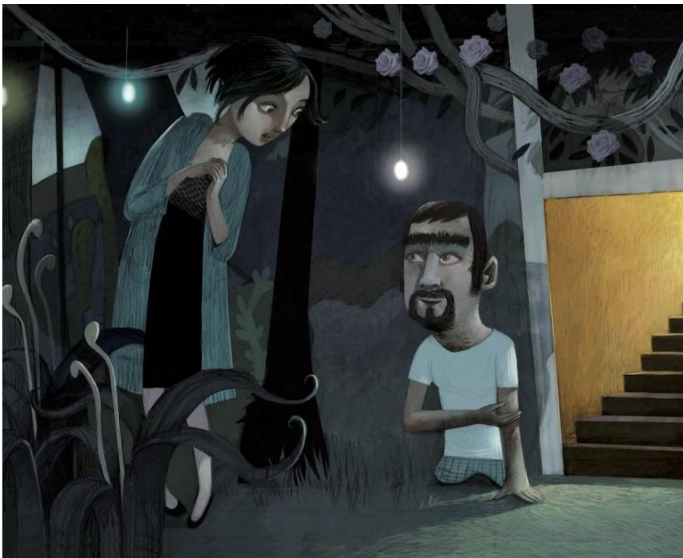
Biancaneve e Gongolo, da Gli alti e i bassi di Biancaneve.