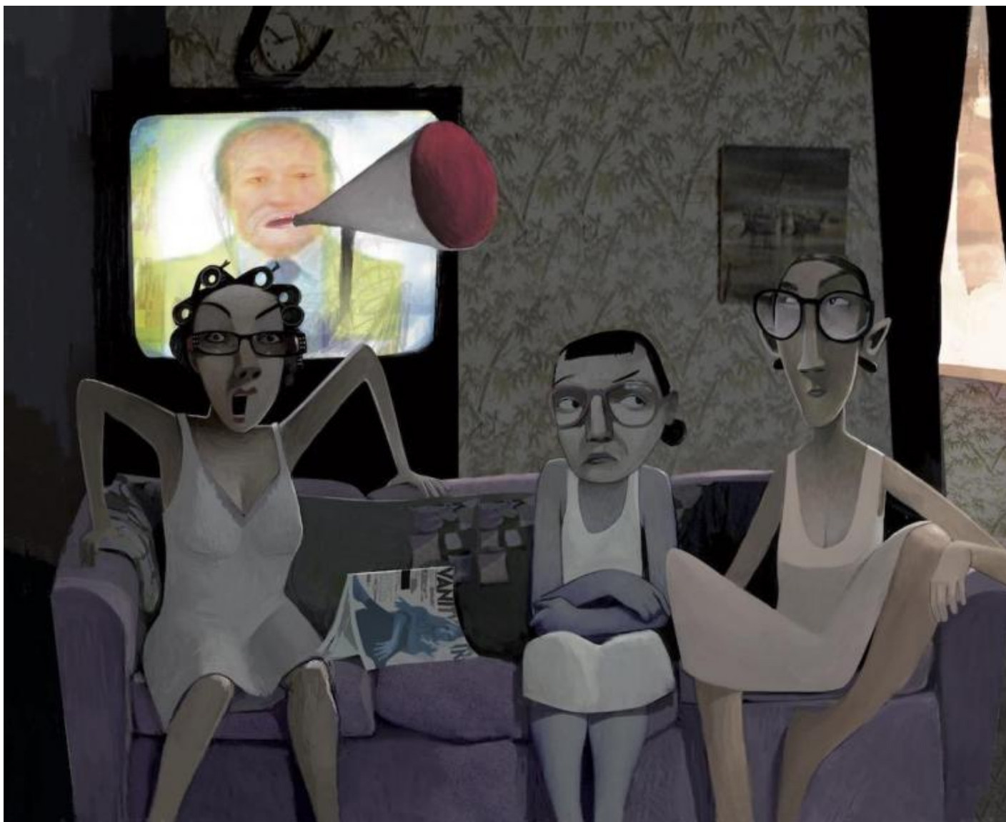
La matrigna e le sorellastre di Cenerentola.

La lingua, essenziale, accesa da inflessioni e locuzioni dialettali, fa da smagliante contrappunto alle immagini, ariose quando vengono scontornate nella pagina bianca, affogate nei chiaroscuri, nelle ombreggiature espressiviste quando si concentrano sui personaggi negativi, o quando esplorano i segreti e le paure della notte. Non mancano trovate umoristiche irresistibili, spesso debitorici al teatro popolare, come nei casi dei sette barbuti nani senza gambe, con Eolo che ‘pirita’, scoreggia, in continuazione, Pisolo che si addormenta ogni 5 minuti, Cucciolo in cerca delle mammelle della mamma eccetera.