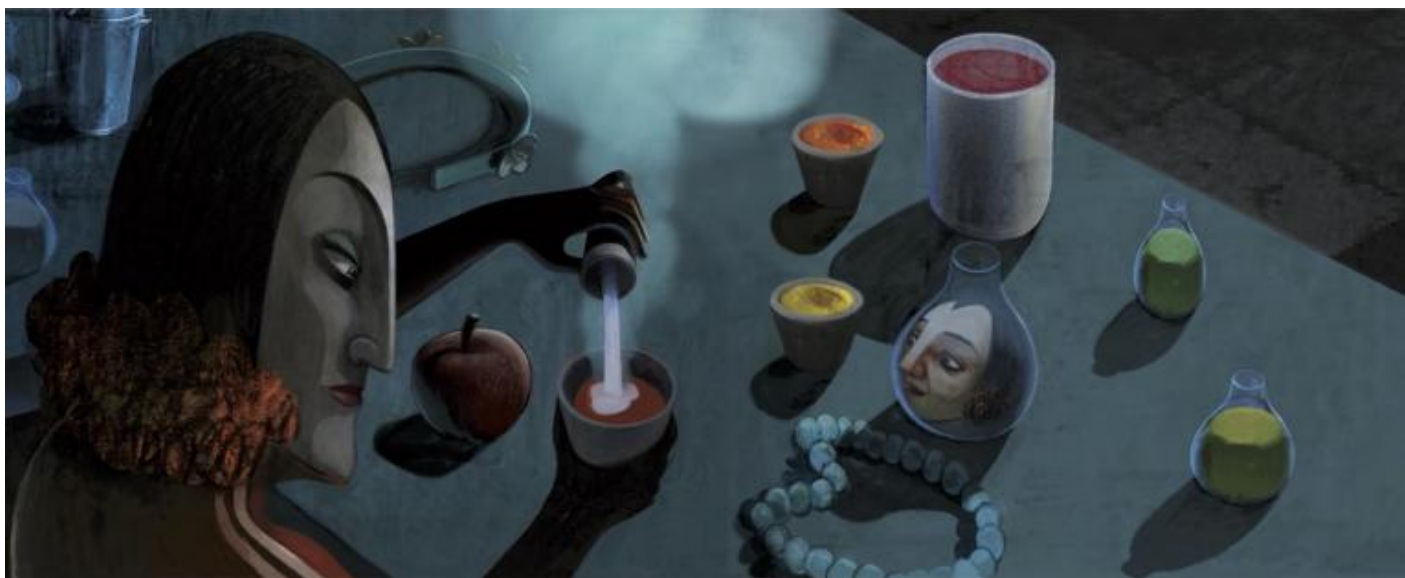
La regina malvagia prepara il veleno per uccidere Biancaneve.