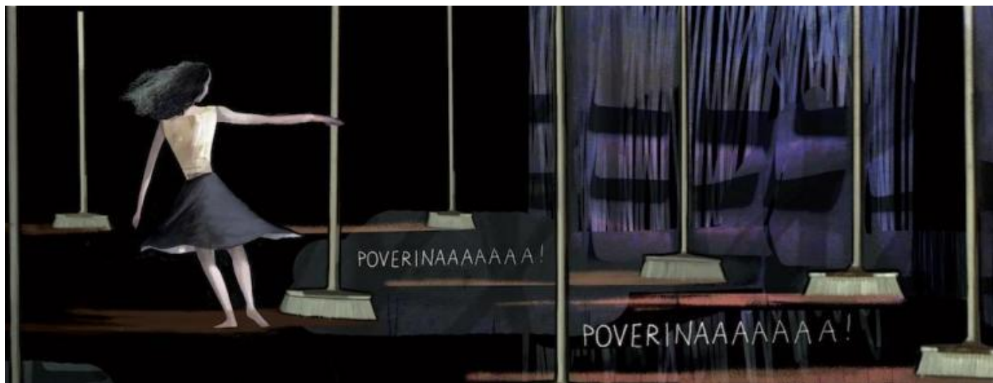
Il ballo con le scope da Anastasia, Genoveffa e Biancaneve.

È una bambina trascurata la Cappuccetto grassa, con un'identità incerta, continuamente esplicitata da sdoppiamenti e moltiplicazioni in tante altre Cappuccetto. E però è una che sa quello che vuole e lo raggiunge travolgendo gli ostacoli. Donne in cerca di identità, di felicità, sono queste, in un mondo non attrezzato, di proibizioni (Cappuccetto), invidie e maledizioni (Rosaspina), odi per l'ingenua bellezza della gioventù degli adulti che vedono sfuggire, nonostante sedute dall'estetista e jogging forsennati, il tempo (Biancaneve), soprusi di chi ha il potere, le orribili sorellastre di Cenerentola, donne avvelenate a loro volta dalla prosopopea e dall'avidità voglia di promozione sociale materna, in camicia da notte, 'villane' rifatte senza grazia. Una grazia che alla fine vince, determinata o inconsapevole, contro tutto .