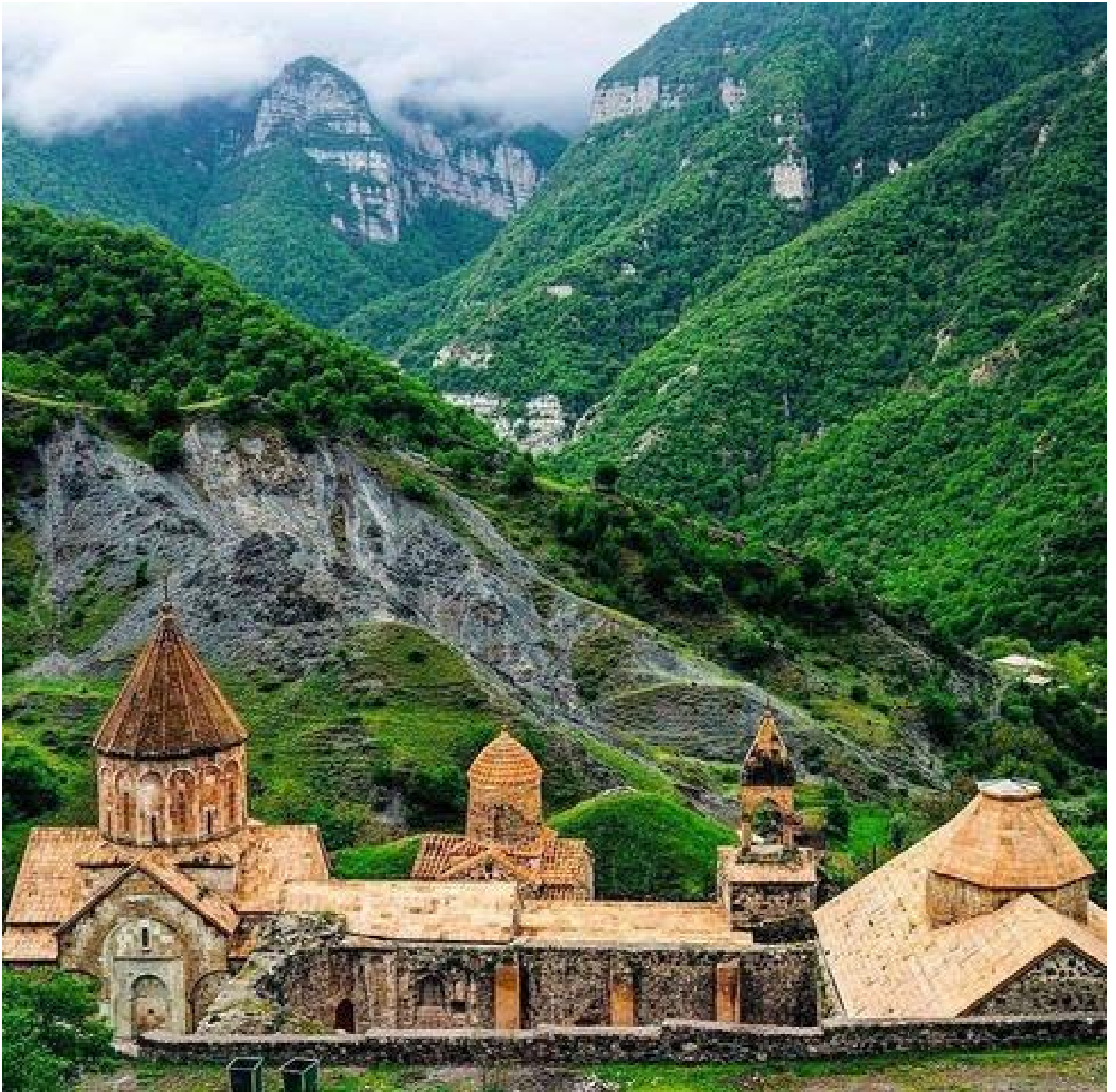
Monastero di S. Taddeo, o Dadivank? (seconda metà del XII-XIII secolo), Artsakh.

Contrariamente all'Armenia montagnosa, caratterizzata da un terreno accidentato, l'Albania del Caucaso, geograficamente facilmente accessibile e percorribile, fu largamente islamizzata dagli arabi già prima della fine dell'VIII secolo. Di conseguenza, la lingua albanese gradualmente svanì, mentre l'armeno diveniva la lingua dominante di tutte le popolazioni cristiane che rimanevano ancora sull'antico territorio dell'Albania, fossero esse di origine armena, albanese o altre, caucasiche o iraniane. Con la dominazione islamica sul mondo delle pianure che si stendono a oriente del Piccolo Caucaso, le inaccessibili gole dell'Artsakh divennero rifugio per cristiani di varie origini.