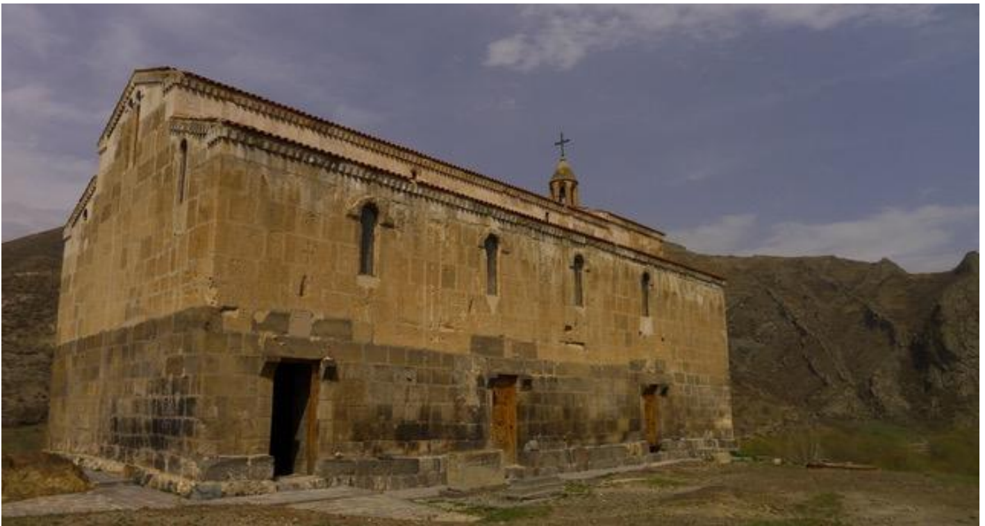
La chiesa di Cice?navank? (fondazioni dei secc. V-VI, basilica attuale dell'XI-XII secolo), Artsakh.

Il passato di ciascuna di esse, nondimeno, doveva essere ben distinto: vi erano, quindi, un'archeologia armena, una georgiana, una azerbaigiana, una turkmena e così via. La collaborazione tra Repubbliche vicine non era incoraggiata, perché il ruolo di mediatore e l'egemonia culturale erano prerogativa della Russia e del popolo russo. Per questo motivo, con la dissoluzione del regime sovietico e con la perdita di controllo da parte di Mosca sull'insieme del territorio sovietico nella seconda metà degli anni Ottanta, le Repubbliche si trovarono sprovviste di istituzioni e di pratiche di mediazione e di dialogo, che avrebbero consentito una collaborazione per il superamento di dissidi culturali e politici con i loro vicini.