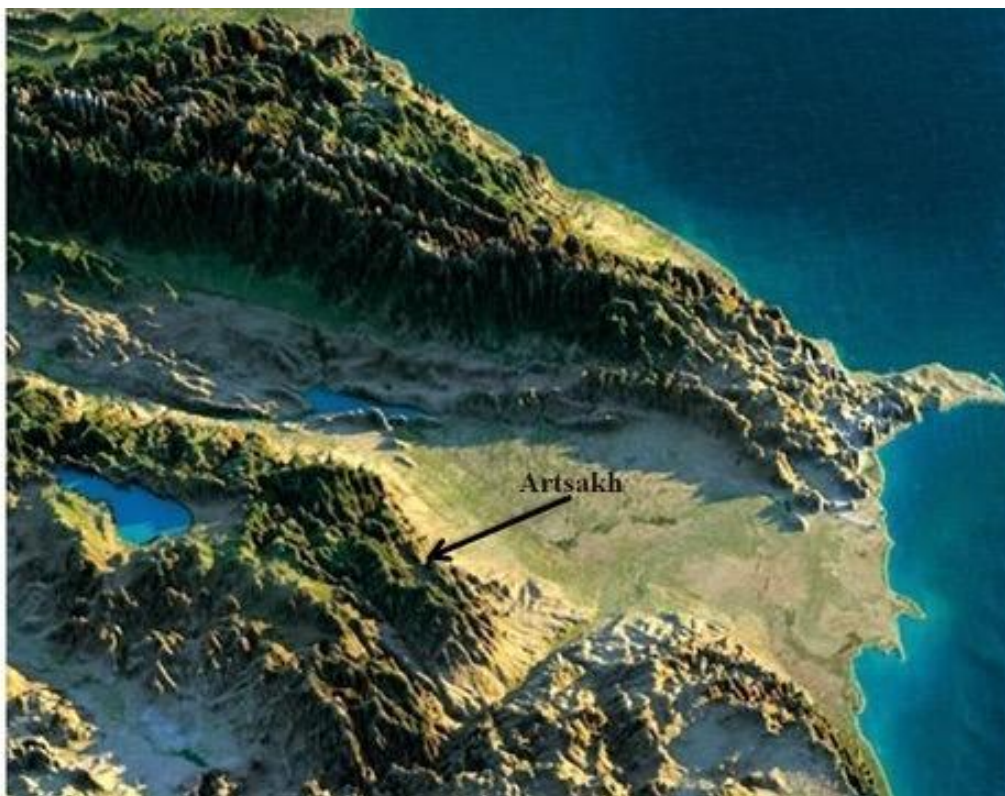
Mappa della regione.

Se osserviamo la mappa del Caucaso del sud – il territorio che si stende a sud della catena del Grande Caucaso tra il mar Nero e il mar Caspio – notiamo un netto confine geografico che divide l’ultima propaggine orientale del Piccolo Caucaso, la quale scende ripidamente verso il fiume Kur, e le pianure che si estendono a est fino alla costa caspiana. L’antica regione armena di Artsakh (l’estremità orientale dell’Armenia storica) occupa proprio quei monti che sovrastano la valle del Kur, l’antica frontiera con l’Albania del Caucaso. Il territorio di questo antico regno cristiano – da non confondere con l’Albania nei Balcani – coincideva in gran parte con quello dell’attuale Azerbaigian, in particolare con le pianure della riva sinistra del fiume Kur, estendendosi fino al litorale del Daghestan meridionale. La popolazione di questo regno aveva origini eterogenee e fino all’alto Medioevo parlava diverse lingue caucasiche del Nordest e iraniane.