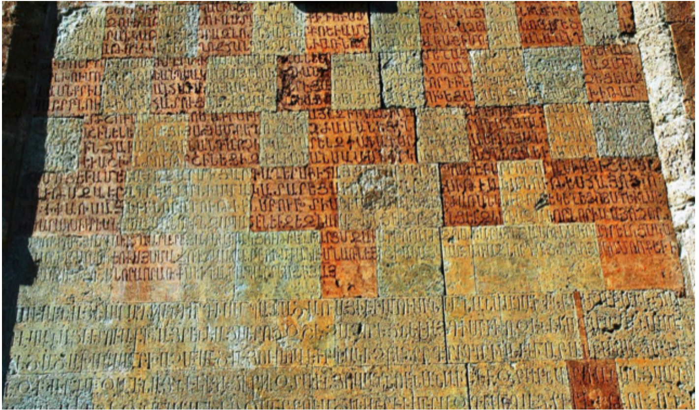
Dadivank?, iscrizione murale.

Quando, verso la fine del decimo secolo, tribù turcomanne e turche cominciarono a penetrare nel Caucaso del sud, esse non vi incontrarono, secondo ogni verosimiglianza, abitanti che scrivessero ancora l'albanese. Gli scambi tra i turchi e gli armeni furono, invece, intensi, come testimoniano i prestiti armeni relativi alla religione, a diverse attività professionali e alla famiglia in azerbaigiano e in turco, per esempio tor?n ? torun (nipote), orinak ? örnek (esempio), xa? ? haç (croce). Fu in ambienti urbani armeni che i turchi appresero anche le tecniche di costruzione.