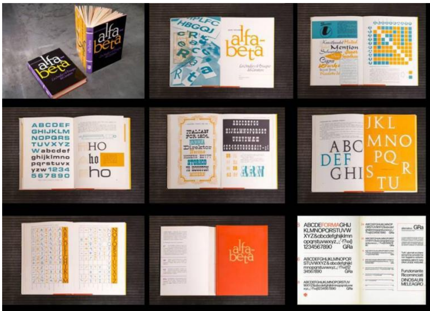
Alfa Beta, il libro e alcune sue pagine.