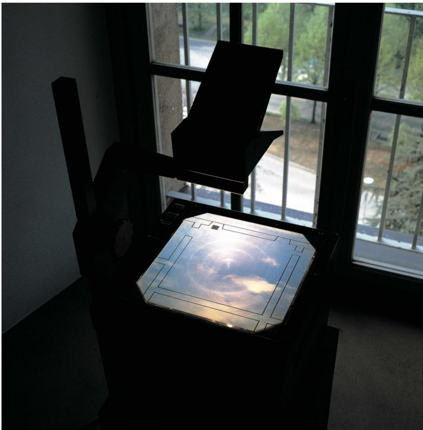
Giulio Paolini No Comment, 1991 Courtesy Fondazione Giulio e Anna Paolini, Torino Foto / Photo Paolo Pellion © Giulio Paolini

“Né quella sera né la successiva morì l’illustre Giambattista Marino [...], ma il fatto immobile e silenzioso che allora accadde fu veramente l’ultimo della sua vita. Carico d’anni e di gloria, l’uomo moriva in un vasto letto spagnolo a colonne intagliate. [...] Una donna ha posto in un vaso una rosa gialla; [...] Allora accadde la rivelazione. Marino vide la rosa, come poté vederla Adamo nel Paradiso, e sentì che essa stava nella propria eternità e non nelle sue parole e che noi possiamo menzionare o alludere ma non esprimere e che gli alti e superbi volumi che formavano in un angolo della sala una penombra d’oro non erano (come la sua vanità aveva sognato) uno specchio del mondo, ma una cosa aggiunta al mondo [...]”