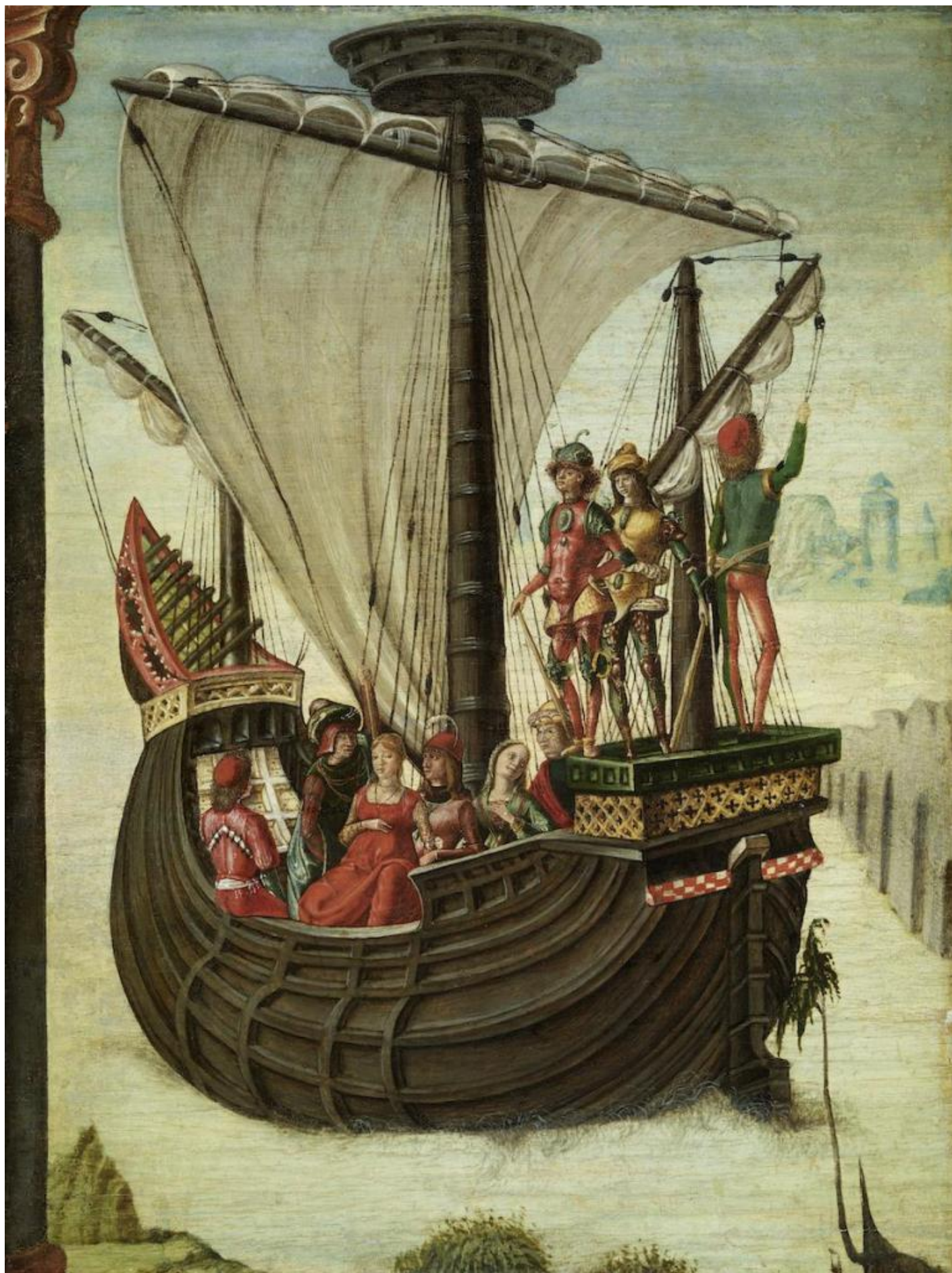
Lorenzo Costa (Attr. de' Roberti), Gli argonauti lasciano la Colchide, Museo Thyssen-Bornemisza Madrid.