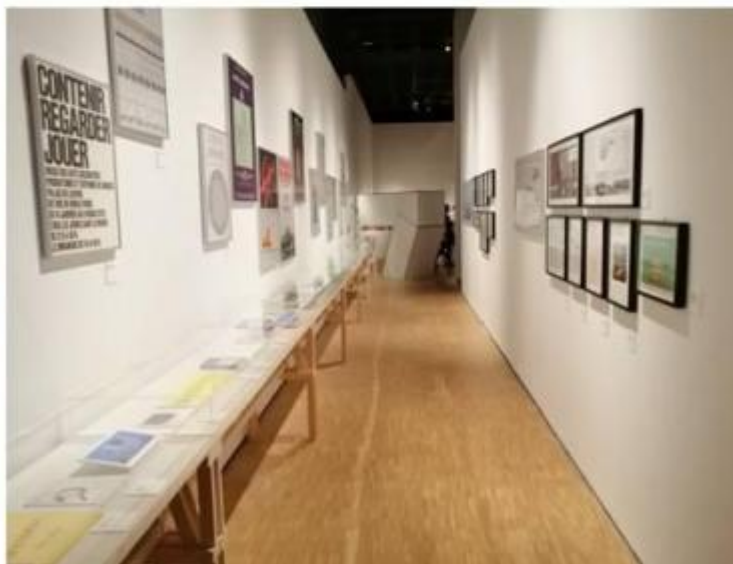
Alcuni scorci della mostra Enzo Mari curated by Hans Ulrich Obrist in Triennale