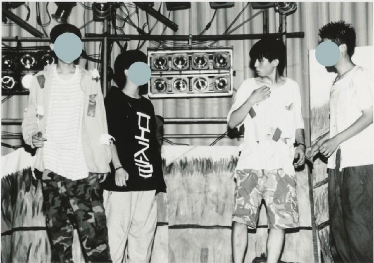
The History of Korean Western Theatre , di Jaha Koo.

È solo ora che Zaides, accompagnato dalla assistente alla ricerca Emma Gioia, abbandona il banco mixer per collocarsi al centro della scena. Con gesti calibrati e chirurgici, il performer estrae da un carrello i lacerti di un cadavere (una riproduzione tridimensionale che riesce a essere allo stesso tempo realistica e astratta) e lo ricomponpe pezzo per pezzo, con la sapienza anatomica del coreografo, con il ritmo sospeso di un officiante. Chi desidera partecipare al rito e – perché no? – contribuire all’ampliamento ancora in progress del database, può trovare il progetto al Pim off di Milano , o a Romaeuropa .