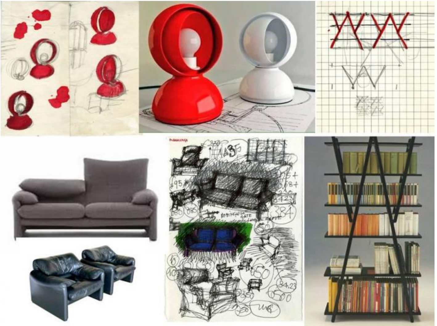
Vico Magistretti, schizzi per lampada Eclisse; lampada Eclisse (Artemide, 1965, Compasso d'Oro 1967); schizzo per libreria Nuvola Rossa, libreria Nuvola Rossa (Cassina, 1977); Poltrone e divano Maralunga (Cassina, 1973, Compasso d'oro 1979); schizzo di progetto per divano e poltrona Maralunga.