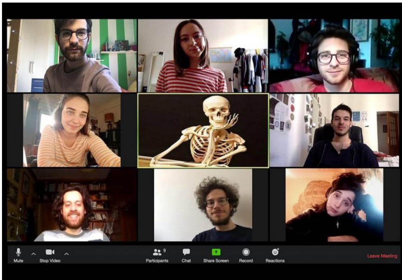
Schermata di 'Generazione Amleto', serie teatrale online trasmessa sul sito della scuola Paolo Grassi di Milano dal 4 maggio.

Su tre realtà, tre lezioni che qualunque critico già conosceva, ma che è stato costretto a reimparare da capo, con l'inesorabile efficacia didattica della congiuntura.