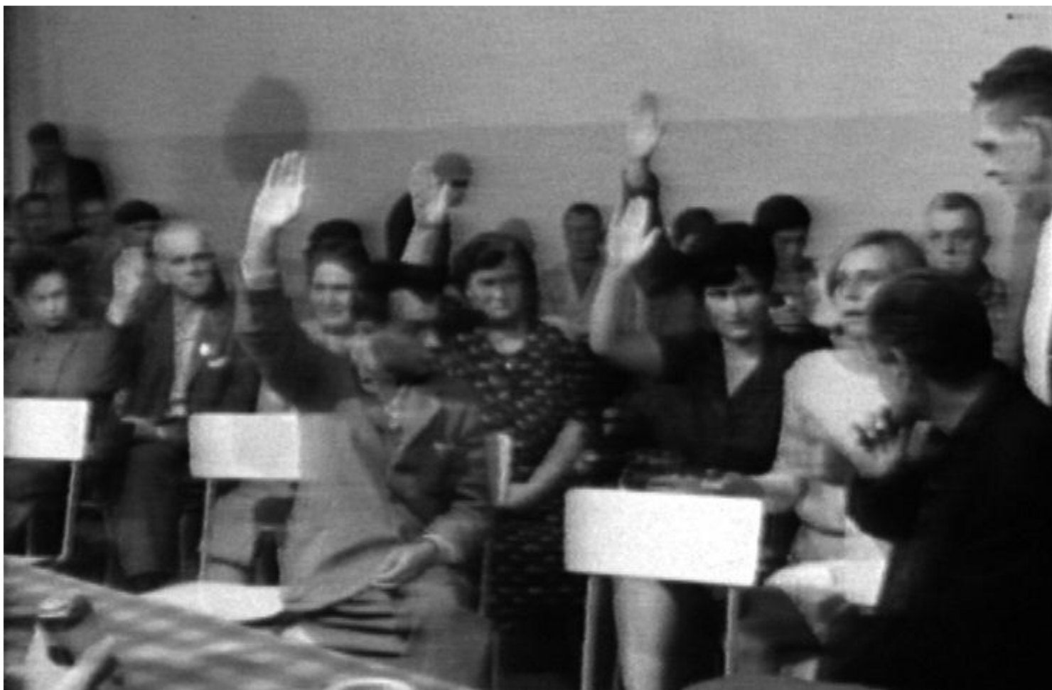
Assemblea all'interno dell'ospedale psichiatrico di Gorizia, tratta la La favola del serpente