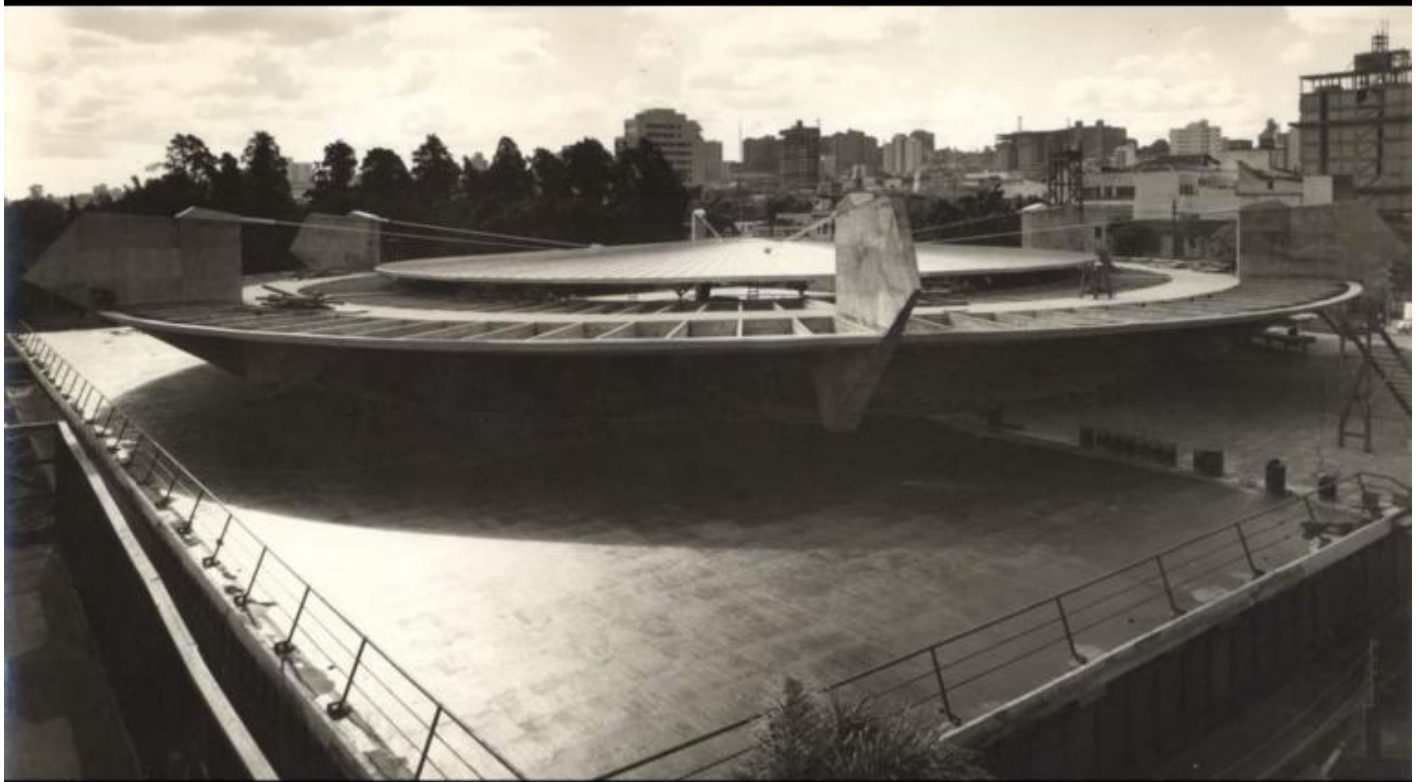
Paulo Mendes da Rocha, Club Athletico Paulistano, São Paulo (1958-1961)