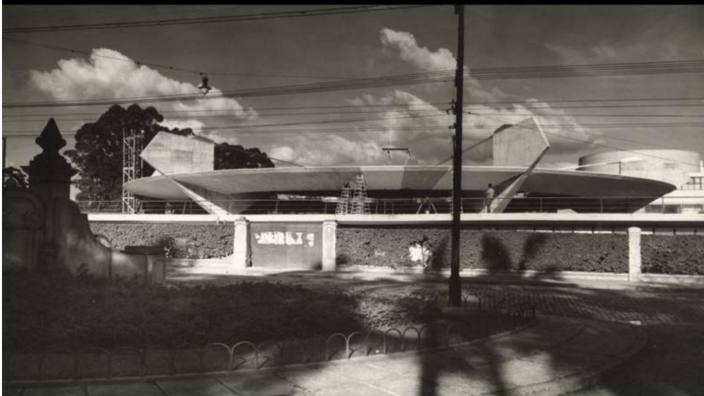
Paulo Mendes da Rocha, Club Athletico Paulistano, São Paulo (1958-1961)