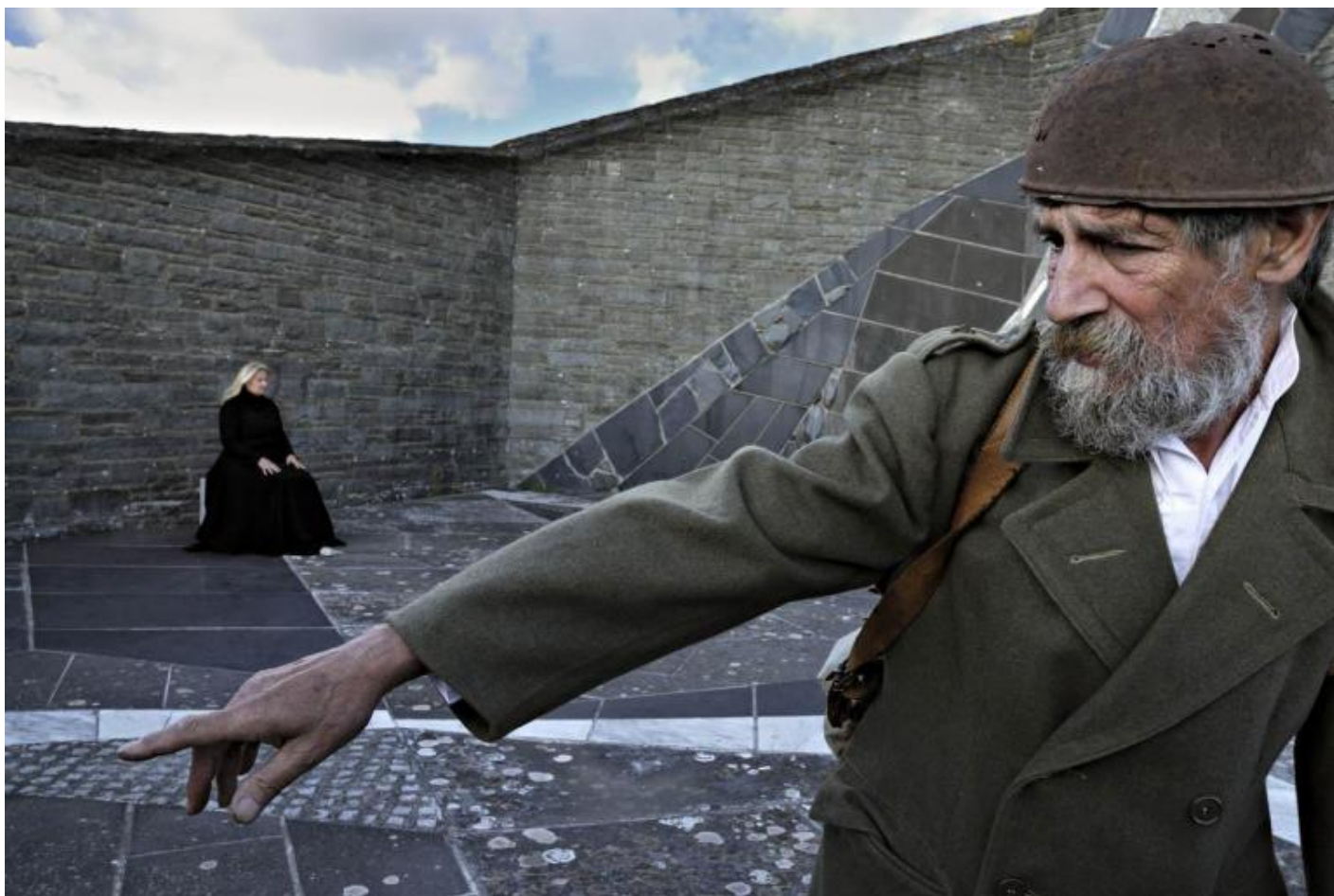
“Agamennone”, da Eschilo, 2010.

Le alternative possibili? «Ci siamo rivolti a vari comuni, per provare a trovare uno spazio alternativo. Alcuni hanno espresso tutta la loro solidarietà, altri, come Firenzuola, nel cui territorio è il Cimitero, hanno negato ogni dialogo. Stiamo discutendo col Comune di Bologna e con la Regione Emilia Romagna. Un’alternativa sempre possibile è spostare il nostro Pro e contra Dostoevskij a Monte Sole, nel parco che rievoca la strage nazifascista. Vi abbiamo già ambientato varie azioni, collaboriamo stabilmente con la Scuola di pace di Monte Sole. Ma non è facile riambientare in un altro luogo uno spettacolo pensato su uno spazio così connotato. Al Cimitero militare della Futa abbiamo anche dedicato un libro, Teatro di Marte , pubblicato in una nostra collana (si può richiedere scrivendo al sito www.archiviozeta.eu , ndr)».