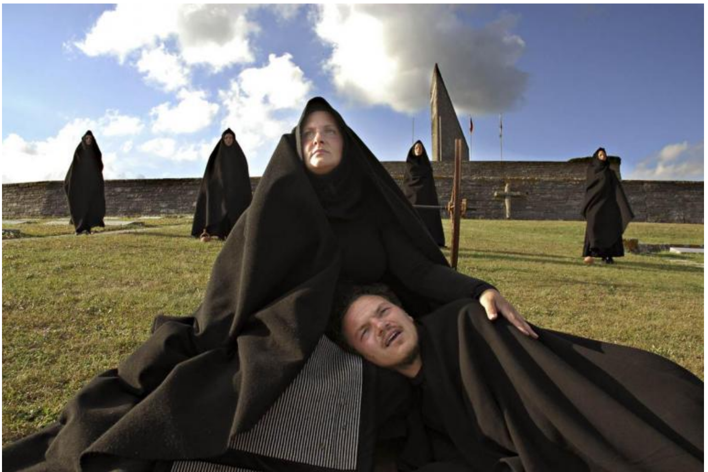
“Coefore”, da Eschilo, 2011.

È sorprendente questo spettacolo in mezzo ai boschi, in un luogo che ispira sentimenti contrastanti, la violenza cieca, per l'appunto, e la pace conquistata a prezzo di tante vite. È brechtiano, pasoliniano, ronconiano e perfino ispirato fortemente alle cartesiane, umanissime, aperte visioni ideologiche di quei geni che sono stati Jean-Marie Straub e Danièle Huillet, brechtiani radicali di fine novecento. È freddo, straniato, semplicemente, con grazia, destabilizzante. Ma è pure qualcosa di originale, un atto poetico che riduce il testo antico all'osso per andare a scalfirne le incrostazioni e portarlo a quello che contiene di ancora vivo, di perennemente bruciante. Un "teatro di parola" come lo sognava Pasolini, capace di diventare rito democratico, controversa analisi per via di fantasmi dell'immaginario del nostro stare, singolarmente e in comunità, nel mondo.