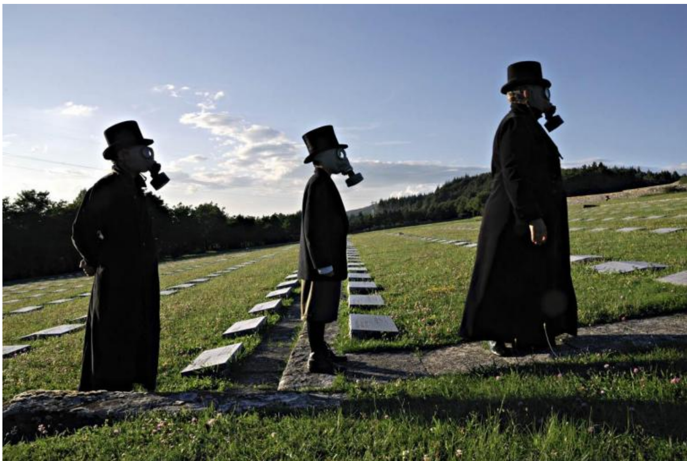
“Gli ultimi giorni dell’umanità”, da Karl Kraus, 2014.

Ma lo spettacolo questa estate non si farà. Prima di raccontare perché, provo a narrare il teatro fuori dell’ordinario di Archivio Zeta, riprendendo vecchi articoli del 2012, scritti con la felicità di aver scoperto qualcosa che veramente cambia lo sguardo.