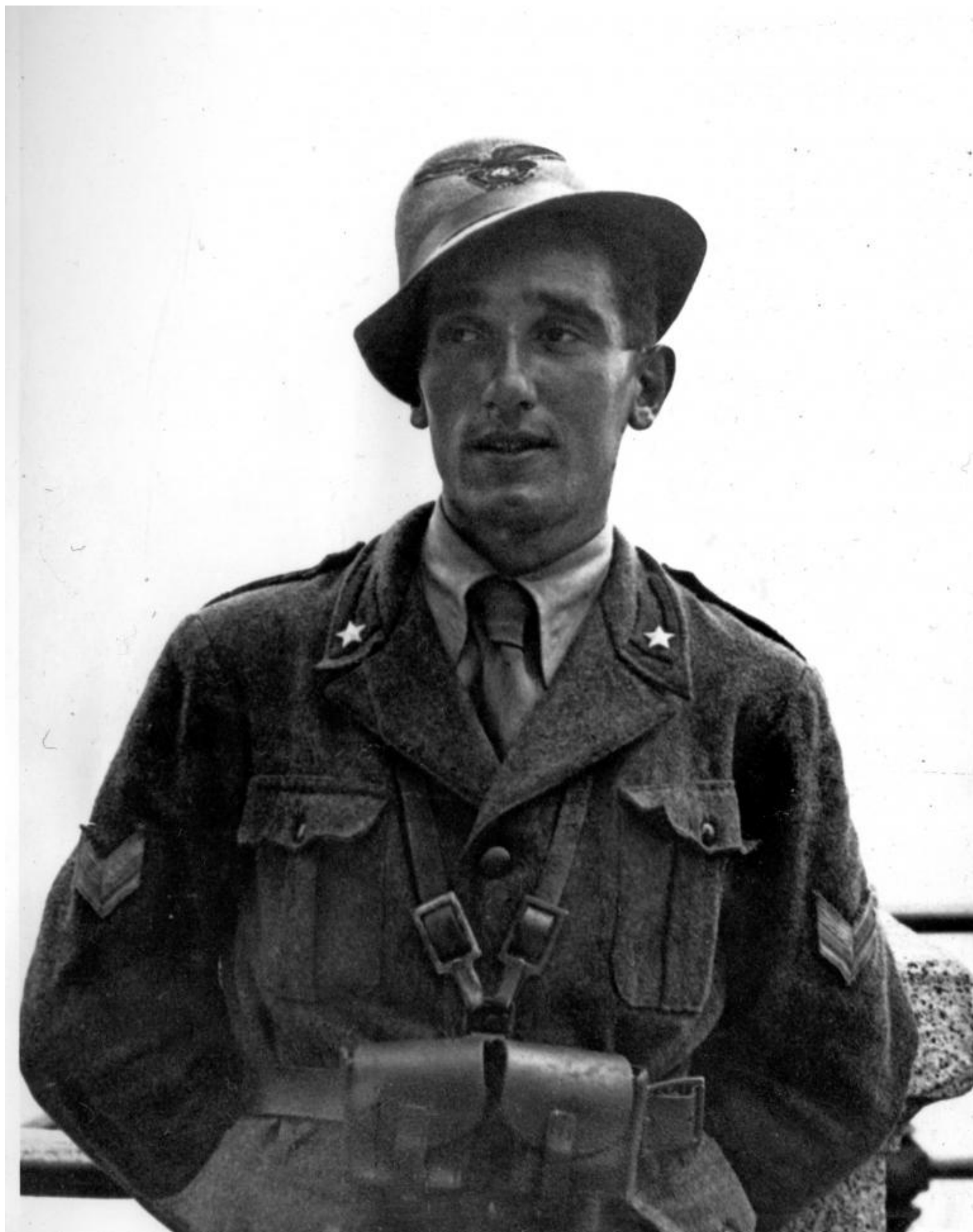
Mario Rigoni Stern nel 1941