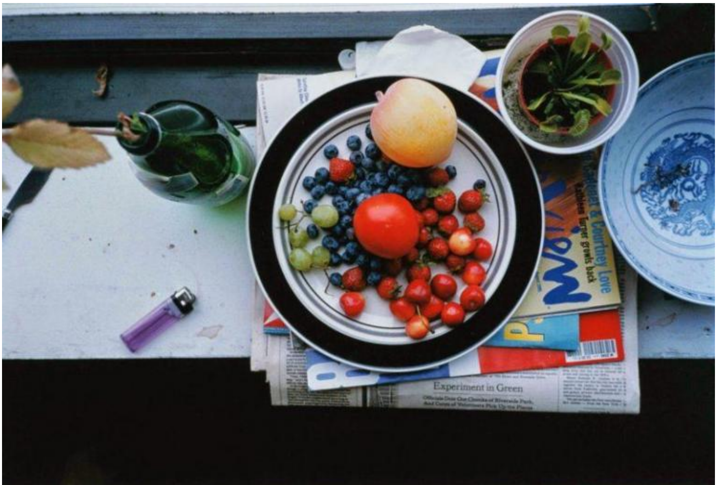
Opera di Wolfgang Tillmans.

Come è inutile fare pronostici sul futuro, nello stesso modo non ha senso parlare del Covid-19 come di un "trauma collettivo". Dal punto di vista dell'inconscio, un trauma non corrisponde ad una situazione concreta, nel nostro caso la pandemia. Ci sono troppi fattori che intervengono, e il fatto che sia collettivo non cambia l'affare. resta quindi ad ognuno di noi di trovare il modo di reagire di fronte a questa esperienza inattesa, sicuramente inusuale, ma non necessariamente traumatica.